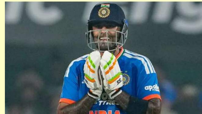
નોંધપાત્ર પ્રભાવ પાડવામાં નિષ્ફળ ગયો, તેણે ફક્ત ૩૨ રન બનાવ્યા. જોકે, સૂર્યકુમાર યાદવ આગામી મેચમાં શાનદાર વાપસી કરી, ઉત્તમ અડધી સદી ફટકારી. તેણે બીજા મેચમાં અણનમ ૮૨ અને ત્રીજા મેચમાં અણનમ ૫૭ રન બનાવ્યા. ચોથી મેચમાં પણ તેની પાસેથી આવી જ ઈનિંગની અપેક્ષા છે, જેનાથી તેને

વિશાખાપટ્ટનમ, ભારત અને ન્યૂઝીલેન્ડ વચ્ચેની ટી ૨૦ શ્રેણી ચાલી રહી છે, ત્રણ મેચના પરિણામો પહેલાથી જ જાહેર થઈ ગયા છે. ભારતીય ટીમે પ્રથમ ત્રણ મેચ જીતીને ટી ૨૦ શ્રેણીમાં ૩-૦ની અજેય લીડ મેળવી છે. ભારત હવે ન્યૂઝીલેન્ડ સામે શ્રેણી જીતવા પર નજર રાખી રહ્યું છે. ચોથી મેચમાં ભારતીય ટીમ કેવું પ્રદર્શન કરે છે તે જોવું રસપ્રદ રહેશે. પાંચ મેચની ટી ૨૦ શ્રેણીનો ચોથો મેચ ૨૮ જાન્યુઆરીએ વિશાખાપટ્ટનમમાં રમાશે, જ્યાં ભારતીય ચાહકો કેપ્ટન સૂર્યકુમાર યાદવ પાસેથી બીજા મોટી ઈનિંગની અપેક્ષા રાખશે. વર્તમાન ટી ૨૦ શ્રેણીમાં, સૂર્યકુમાર પ્રથમ મેચમાં બેટથી