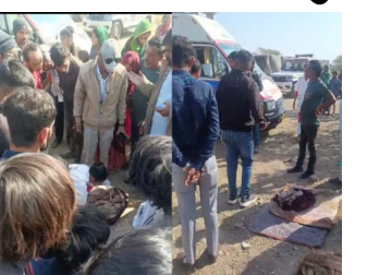
અનુસાર હાલ બાળકની સ્થિતિ સ્વસ્થ હોય પરંતુ વજન ઓછી હોવાથી તેને ઓક્સિજન સપો