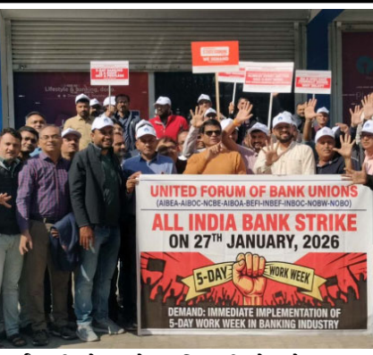
કર્મચારીઓ અને અધિકારીઓ જોડાયા હતા. અગાઉ આઈબીએ સાથે થયેલી સમજુતીઓ અને કરાર હેઠળ બેંકોમાં પાંચ દિવસનું સપ્તાહ યુનિયનને માંગ્યું છે.

રાજકોટ:દેશની સરકારી બેંકોમાં શનિ-રવિ-સોમની રજા બાદ આજે ખુલતા સપ્તાહે મંગળવારે હડતાલનું એલાન આપવામાં આવતા રાજકોટ-ગુજરાત સહિત દેશભરમાં બેંકીંગ કામકાજ ઠપ્પ થયું હતું. સૌરાષ્ટ્ર-કચ્છના ૫૫૦૦ સહિત ગુજરાતના ૧૫ હજાર અધિકારી અને કર્મચારીઓ આજે હડતાલમાં જોડાયા હતા. આજે સરકારી બેંકો બહાર યુનિયનના આગેવાનોએ સુનોચ્યાર કર્યા હતા. ગ્રાહકોના વ્યવહારો બંધ થતા બેંક કચેરીઓ સુમસામ દેખાઈ હતી. જોડે ખાનગી અને સહકારી બેંકોમાં રાખેલા મુજબ વ્યવહાર ચાલુ રહેવા છતાં મોટા ભાગના બેંકીંગ વ્યવહારો પ્રભાવિત થયા હતા. દેશભરની જાહેરરેત્ર તેમજ ખાનગી બેંકોના કર્મચારીઓના નવ યુનિયનના બનેલા યુનાઈટેડ ફોરમ ઓફ બેંક યુનિયન દ્વારા બેંકોમાં પાંચ દિવસના સપ્તાહના અમલીકરણની માંગણીના ટેકામાં આજે દેશભરની બેંક હડતાલનું એલાન અપાતા વિવિધ બેંકોના ૮ લાખ જેટલા કર્મચારીઓ અને અધિકારીઓ જોડાયા હતા. અગાઉ આઈબીએ સાથે થયેલી સમજુતીઓ અને કરાર હેઠળ બેંકોમાં પાંચ દિવસનું સપ્તાહ યુનિયનને માંગ્યું છે. મહીનાના તમામ શનિવારે જાહેર રજા રાખવાનું નક્કી થયું હતું જેના બદલામાં બેંક કર્મચારીઓ સોમવારથી શુક્રવાર