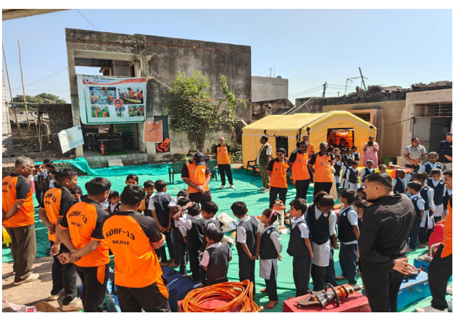
આ કાર્યક્રમમાં જિલ્લા પ્રાથમિક શિક્ષણાધિકારીશ્રી, તાલુકા મામલતદારશ્રી, તાલુકા પ્રાથમિક શિક્ષણાધિકારીશ્રી, સરપંચશ્રી, સ્થાનિક આગેવાનો, ઈંડ્રા કો-ઓર્ડિનેટર, SDRF ટીમ તેમજ શાળાનો સમગ્ર સ્ટાફ ઉપસ્થિત રહ્યો હતો. અંગે ઉલ્લેખનીય છે કે, તા. ૨૭/૦૧/૨૦૨૬થી મુખ્યમંત્રીશ્રી દ્વારા રાજ્યમાં શાળા સલામતી સપ્તાહ - ૨૦૨૬ની શરૂઆત કરવામાં આવી છે. જે અંતર્ગત રાજકોટ જિલ્લામાં ડિઝાસ્ટર મેનેજમેન્ટ સેલ તથા જિલ્લા પ્રાથમિક શિક્ષણાધિકારીશ્રી દ્વારા કલેક્ટરશ્રીના માર્ગદર્શન હેઠળ કુલ ૭૦ શાળાઓમાં મેગા ઇવેન્ટનું આયોજન કરાયું છે. જે અન્યથે વિદ્યાર્થીઓ તેમજ શિક્ષકોને સલામતીના પાઠ શીખવવામાં આવી રહ્યા છે.

રાજકોટ: શાળા સલામતી સપ્તાહ - ૨૦૨૬ અંતર્ગત રાજ્યના મુખ્યમંત્રીશ્રી ભુપેન્દ્ર પટેલની વચ્ચે અલ ઉપસ્થિતિમાં રાજકોટ જિલ્લામાં ડિઝાસ્ટર મેનેજમેન્ટ સેલ તથા જિલ્લા પ્રાથમિક શિક્ષણાધિકારીશ્રીની કચેરી દ્વારા મહીકા પ્રાથમિક શાળા ખાતે મેગા ઇવેન્ટ યોજાયો હતો. જેમાં SDRF ટીમ દ્વારા શોષ અને બચાવ અંગે જીવંત નિદર્શન રજૂ કરાયું હતું. કાર્યક્રમ દરમિયાન ધરતીકંપ, પૂર, આગ સામે રક્ષણ, ઝઈ સહિતની સલામતી બાબતોની તાલીમનો શાળાના ૧૦૦ જેટલા બાળકોએ લાભ લીધો હતો. ગાંધીનગરથી પ્રસારિત થયેલા મુખ્યમંત્રીશ્રી, આનંદલાલ કાર્યક્રમને ઉપસ્થિત સૌએ નિહાળ્યો હતો. આ કાર્યક્રમમાં જિલ્લા પ્રાથમિક શિક્ષણાધિકારીશ્રી, તાલુકા મામલતદારશ્રી, તાલુકા પ્રાથમિક શિક્ષણાધિકારીશ્રી, સરપંચશ્રી, સ્થાનિક આગેવાનો, ઈંડ્રા કો-ઓર્ડિનેટર, SDRF ટીમ તેમજ શાળાનો સમગ્ર સ્ટાફ ઉપસ્થિત રહ્યો હતો. અંગે ઉલ્લેખનીય છે કે, તા. ૨૭/૦૧/૨૦૨૬થી મુખ્યમંત્રીશ્રી દ્વારા રાજ્યમાં શાળા સલામતી સપ્તાહ - ૨૦૨૬ની શરૂઆત કરવામાં આવી છે. જે અંતર્ગત રાજકોટ જિલ્લામાં ડિઝાસ્ટર મેનેજમેન્ટ સેલ તથા જિલ્લા પ્રાથમિક શિક્ષણાધિકારીશ્રી દ્વારા કલેક્ટરશ્રીના માર્ગદર્શન હેઠળ કુલ ૭૦ શાળાઓમાં મેગા ઇવેન્ટનું આયોજન કરાયું છે. જે અન્યથે વિદ્યાર્થીઓ તેમજ શિક્ષકોને સલામતીના પાઠ શીખવવામાં આવી રહ્યા છે.