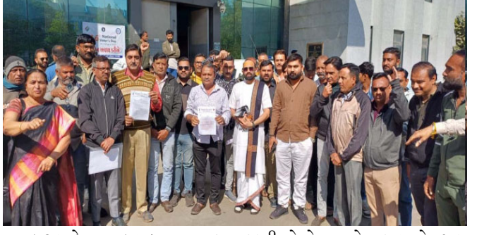
અસમાનતા વધે એ પ્રકારથી કાયદો અમલ થઈ રહ્યો હોય ત્યારે આની સમીક્ષા કરી હાલમાં જે પ્રકારની નીતિઓથી વર્તમાન સરકાર સૌનો સાથ સૌનો વિકાસ અને જાતીવાદથી ઉપર રાષ્ટ્રવાદ અને સનાતન સંસ્કૃતિને ઉજાગર કરવાની નીતિ મુજબ ચાલી રહી છે. ત્યારે એક મોટા સામાજિક વર્ગના બાળકોને અન્યાય ન થાય એ માટેથી બદલાવ લાવી કોઈને અન્યાય ન થાય તેમ કરવું જોઈએ.