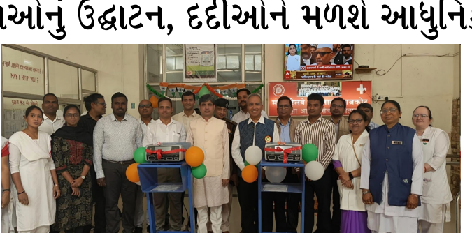
અને સારવારની સેવાઓ મળી શકશે. આ પ્રસંગે રાજકોટ ડિવિઝનલ રેલ પ્રબંધક શ્રી ગિરિરાજ કુમાર મીનાએ જણાવ્યું હતું કે, આ નવી સુવિધાઓ શરૂ થવાથી રેલવે

રાજકોટ: રેલવે કર્મચારીઓ અને તેમના પરિવારોને આધુનિક સ્વાસ્થ્ય સેવાઓ પૂરી પાડવાના સંકલ્પ સાથે, રાજકોટ ડિવિઝનલ રેલવે હોસ્પિટલમાં હાલમાં જ અનેક મહત્વપૂર્ણ તબીબી સુવિધાઓનો પ્રારંભ કરવામાં આવ્યો હતો. રાજકોટ ડિવિઝનલ રેલ પ્રબંધક શ્રી ગિરિરાજ કુમાર મીના દ્વારા આ નવી સુવિધાઓનું ઉદ્ઘાટન કરવામાં આવ્યું હતું. જેની વિગતો નીચે મુજબ છે: ૧) આધુનિક ફિઝિયોથેરાપી ક્લિનિક: હોસ્પિટલમાં સુસજ્જ ફિઝિયોથેરાપી ક્લિનિક શરૂ કરવામાં આવ્યું છે, જેનાથી દર્દીઓને અસરકારક પુનર્વસન અને સારવારની સેવાઓ મળી શકશે. ૨) ઇલેક્ટ્રિકલ કોટરી ઉપકરણ: સર્જરી અને સારવારને વધુ સચોટ અને સરળ બનાવવા માટે આધુનિક 'ઇલેક્ટ્રિકલ કોટરી' મશીનનું લોકાર્પણ કરવામાં આવ્યું હતું. ૩) દર્દીઓની સુવિધા માટે ભેટ: પશ્ચિમ રેલવે મહિલા કલ્યાણ સંગઠન રાજકોટ દ્વારા દર્દીઓની સુવિધા માટે હોસ્પિટલને ૨૦ વિઝિટિંગ ચેર અર્પણ કરવામાં આવી હતી. આ પ્રસંગે રાજકોટ ડિવિઝનલ રેલ પ્રબંધક શ્રી ગિરિરાજ કુમાર મીનાએ જણાવ્યું હતું કે, આ નવી સુવિધાઓ શરૂ થવાથી રેલવે