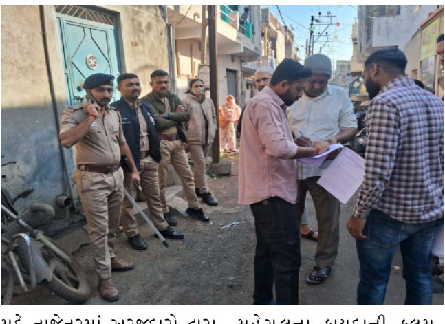
મુદ્દે તાજેતરમાં અરજદારો દ્વારા કોર્ટમાં ત્રણ કેવિએટ દાખલ કરાઈ હતી જે પૈકી બે કેવિએટ નીકળી ગઈ છે અને હજુ એક પેન્ડીંગ છે. જો કે તંત્રએ પણ અગાઉથી જ હાઈકોર્ટમાં કેવિએટ દાખલ કરી છે. આજરોજ તંત્રએ પાઠવેલી આખરી નોટીસમાં જણાવાયું છે કે, મામલતદાર, રાજકોટ શહેર (પૂર્વ) સને ૧૮૭૮ના મુંબઈના મહેસુલના કાયદાની કલમ-૨૦૨માં ઠરાવ્યા પ્રમાણે તેઓને આ નોટીસ આપી છે, આ નોટીસ મળ્યાથી દિન-૭માં સદરહું જમીન છોડી દેવા અન્યથા આપને આ જમીન પરથી ખસેડવામાં આવશે જેની તમામ જવાબદારી આપની રહેશે અને જંગલેશ્વરની સરકારી જમીનમાં થયેલા દબાણો તદ્દન ગેરકાયદેસર સાબિત થયા છે.