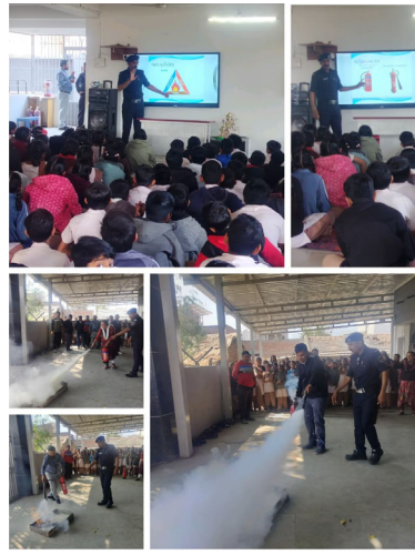
સરકારી શાળાઓમાં ફર્સ્ટ એડ (પ્રાથમિક સારવાર) અને આપત્તિ વ્યવસ્થાપન વિષયક તાલીમ આપવામાં આવશે.

ભાવનગર, તા. ૨૯ ભાવનગર મહાનગરપાલિકા તથા ગુજરાત સ્ટેટ ડિઝાસ્ટર મેનેજમેન્ટ ઓથોરિટી (GSDMA) ના સંયુક્ત આયોજન હેઠળ શહેરની સરકારી શાળાઓમાં વિદ્યાર્થીઓમાં સલામતી અંગે જાગૃતિ વિકસાવવા અને આપત્તિ પ્રત્યે સજાગતા વધારવાના હેતુથી "શાળા સલામતી સપ્તાહ-૨૦૨૬" નું આયોજન કરવામાં આવ્યું છે. આ શાળા સલામતી સપ્તાહ અંતર્ગત ભાવનગર શહેરની કુલ ૩૦ સરકારી શાળાઓમાં વિવિધ સલામતી સંબંધિત તાલીમ, ડેમોન્સ્ટ્રેશન તથા જાગૃતિ કાર્યક્રમો યોજવામાં આવશે. જેમાં ૧૦ સરકારી શાળાઓમાં ફાયર એન્ડ સેફ્ટી ડેમોન્સ્ટ્રેશન, ૧૦ સરકારી શાળાઓમાં ૧૦૮ ઈમરજન્સી મેડિકલ સેવા અંગેનું ડેમોન્સ્ટ્રેશન તથા ૧૦