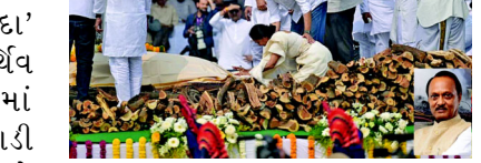
આશરે ૬ કિલોમીટરનું અંતર કાપીને સ્મશાન ભૂમિ પહોંચી હતી. આ યાત્રામાં હજારોની સંખ્યામાં સમર્થકો, પક્ષના કાર્યકરો અને સામાન્ય જનતા જોડાયા હતા. કાર્યકરોએ ભારે હૈયે ‘અજિત દાદા અમર રહે’ના નારા લગાવ્યા હતા. તેમને સંપૂર્ણ રાજકીય સન્માન સાથે વિદાય આપવામાં આવી હતી. રસ્તાની બંને બાજુ ઉભેલા લોકો

બારામતી મહારાષ્ટ્રના રાજકારણના કદાવર નેતા અને લાખો કાર્યકરોમાં ‘દાદા’ તરીકે લોકપ્રિય અજિત પવારના પાર્શ્વિક દેહની આજે અંતિમવિધિ કરવામાં આવી હતી. બારામતીના કાટેવાડી સ્થિત તેમના નિવાસસ્થાનેથી જ્યારે તેમની અંતિમ યાત્રા નીકળી ત્યારે વાતાવરણ અત્યંત ગમગીન બની ગયું હતું. મહારાષ્ટ્રના વિકાસમાં તેમના યોગદાનને ક્યારેય ભૂલી શકાય તેમ નથી, તેવા નેતાને વિદાય આપવા માટે આખું બારામતી રસ્તા પર ઉતરી આવ્યું હોય તેવા દ્રશ્યો જોવા મળ્યાં હતાં. અજિત પવારની અંતિમ યાત્રા