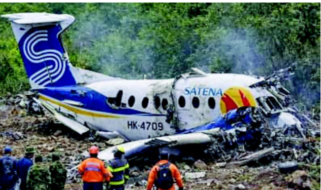
ત્યારબાદ વ્યાપક સર્ચ ઓપરેશન શરૂ કરવામાં આવ્યું હતું. સઘન શોધખોળ બાદ બચાવ ટીમોને વિમાનનો કાટમાળ કેટટુઓના અત્યંત દુર્ગમ અને પહાડી વિસ્તારમાંથી મળી આવ્યો છે. સ્થાનિક મીડિયા અને એરલાઈન સત્તાવાળાઓએ પુષ્ટિ કરી છે કે આ દુર્ઘટનામાં વિમાનમાં સવાર તમામ ૧૩ મુસાફરો અને ૨ ક્રૂ મેમ્બર્સ

કુકુટા, કોલંબિયા કોલંબિયામાં સર્જાયેલી એક ભયાનક વિમાન દુર્ઘટનામાં સાંસદ સહિત તમામ ૧૫ લોકોના કમકમાટીભર્યા મોત નિપજ્યા છે. કોલંબિયામાં કુકુટાથી ઓકાણા જઈ રહેલું ‘Beechcraft 1900’ નામનું કોમર્શિયલ વિમાન બુધવારે સવારે ૧૧:૪૨ વાગ્યે ઉડાન ભર્યા બાદ રહસ્યમય રીતે ગુમ થઈ ગયું હતું. ઉડાનના થોડા સમય બાદ અને લેન્ડિંગની માત્ર ૧૧ મિનિટ પહેલા જ રડાર સાથેનો તેનો સંપર્ક તૂટી ગયો હતો. રાજ્ય એરલાઈન અનુસાર, વિમાનનો છેલ્લો સંપર્ક ‘કેટટુઓ’ ક્ષેત્ર ઉપર નોંધાયો હતો,