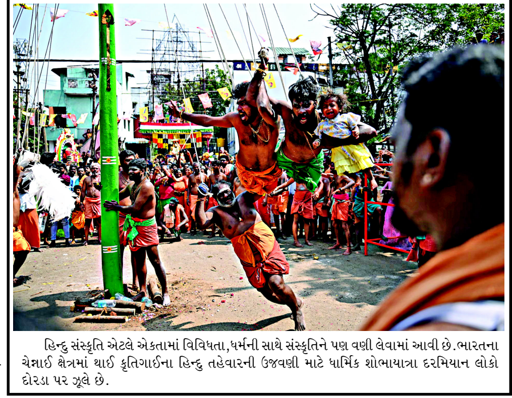
હિન્દુ સંસ્કૃતિ એટલે એકતામાં વિવિધતા, ધર્મની સાથે સંસ્કૃતિને પણ વણી લેવામાં આવી છે. ભારતના ચેન્નાઈ શહેરમાં થાઈ કૃતિગાઈના હિન્દુ તહેવારની ઉજવણી માટે ધાર્મિક શોભાયાત્રા દરમિયાન લોકો દોરડા પર ચૂલે છે.

લાંબા સમયથી ચાલતી સમસ્યાઓના અવકાશથી આગળ વધી રહ્યો છે અને સ્થાયી અને લાંબા ગાળાના ઉકેલો તરફ આગળ વધી રહ્યો છે. વડા પ્રધાન મોદીએ ભારત અને યુરોપિયન યુનિયન વચ્ચે મુક્ત વેપાર કરારને આત્મનિર્ભર અને સ્પર્ધાત્મક ભારત તરફ એક મુખ્ય પગલું ગણાવ્યું. તેમણે જણાવ્યું હતું કે આ કરાર દેશ માટે ઉજ્જવળ ભવિષ્ય અને ભારતીય યુવાનો માટે નવી શક્યતાઓ સંકેત આપે છે. પીએમ મોદીએ કહ્યું, મને વિશ્વાસ છે કે આ કરાર આત્મવિશ્વાસપૂર્ણ, સ્પર્ધાત્મક અને ઉત્પાદક ભારત તરફ એક મોટું પગલું છે. વર્તમાન ત્રિમાસિક ગાળાની શરૂઆત ખૂબ જ સકારાત્મક રીતે થઈ છે, અને આજે, એક આત્મવિશ્વાસપૂર્ણ ભારત વિશ્વ માટે આશાના કિરણ તરીકે ઉભરી આવ્યું છે. પ્રધાનમંત્રીએ કહ્યું હતું કે ભારત અને યુરોપિયન યુનિયન વચ્ચેનો મુક્ત વેપાર કરાર ભવિષ્ય માટે અને ભારતીય યુવાનો માટે ઉજ્જવળ ભવિષ્યનું પ્રતિનિધિત્વ કરે છે.