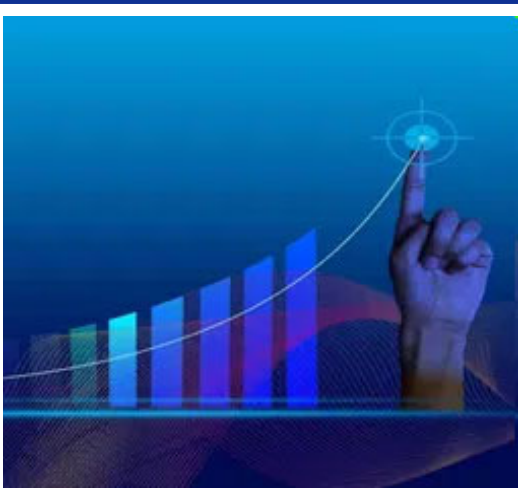
બજેટ અંદાજ મુજબ, મૂડી સંપત્તિ માટે અનુદાન: વિવિધ સ્તરે સંપત્તિ નિર્માણ માટે સરકારની ગ્રાન્ટમાં પણ વધારો થયો છે. તે નાણાકીય વર્ષ ૧૬ માં ૧.૩ લાખ કરોડથી વધીને નાણાકીય વર્ષ ૨૬ માં ૪.૩ લાખ કરોડ થઈ ગઈ છે. આ આંકડો નાણાકીય વર્ષ ૨૬ માં ૧૮.૮ લાખ કરોડ સુધી પહોંચ્યો.

નાણામંત્રી નિર્મલા સીતારમણ ૧ ફેબ્રુઆરી, ૨૦૨૬ ના રોજ સંસદમાં આગામી કેન્દ્રીય બજેટ રજૂ કરતી વખતે ફરી એકવાર ઈન્ફ્રાસ્ટ્રક્ચર વિકાસ પર ધ્યાન કેન્દ્રિત કરે તેવી અપેક્ષા છે. સ્ટેટ બેંક ઓફ ઈન્ડિયાના તાજેતરના ઈકોનોમિક રિપોર્ટ અનુસાર, કેન્દ્ર સરકારનો મૂડી ખર્ચ, અથવા મૂડીખર્ચ, નાણાકીય વર્ષ ૨૦૨૭ માં ૧૨ લાખ કરોડને વટાવી શકે છે. એસબીઆઈ રિપોર્ટનો અંદાજ છે કે ઈન્ફ્રાસ્ટ્રક્ચર બનાવવા અને આર્થિક વિકાસને વેગ આપવાની સરકારની વ્યૂહરચના ચાલુ રહેશે. અહેવાલ મુજબ, નાણાકીય વર્ષ ૨૭ માં સરકારી મૂડીખર્ચ વાર્ષિક ધોરણે આશરે ૧૦ ટકા વધી શકે છે. આ આંકડો મહત્વપૂર્ણ છે કારણ કે વૈશ્વિક અનિશ્ચિતતાઓ વચ્ચે પણ ભારત સરકાર તેના મૂડીખર્ચમાં ઘટાડો કરવાના મૂડમાં દેખાતી નથી. અહેવાલમાં આપેલા ડેટા સ્પષ્ટપણે દર્શાવે છે કે છેલ્લા કેટલાક વર્ષોમાં બજેટરી મૂડી ખર્ચમાં નોંધપાત્ર વધારો થયો છે: બજેટ ૨૦૨૬: નાણાકીય વર્ષ ૨૦૧૬ (એફવાય ૧૬) માં માત્ર ૨.૫ લાખ કરોડથી વધીને નાણાકીય વર્ષ ૨૦૨૬ (એફવાય ૨૬) માં ૧૧.૨ લાખ કરોડ થયો છે,