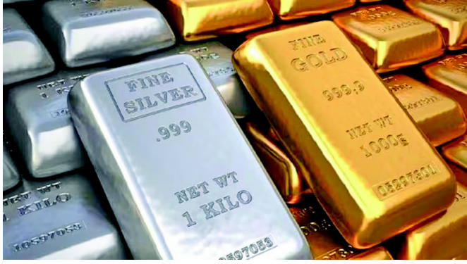
૩.૪,૦૦,૦૦૦ ની ઐતિહાસિક સપાટી વટાવી દીધી છે. એમસીએક્સ પર ચાંદીનો વાયદો ૩,૯૯,૦૦૦ ના ભાવે પૂલ્યો હતો અને જોતજોતામાં ૪,૦૭,૪૫૬ ની સર્વોચ્ચ

મુંબઈ, સોનુ અને ચાંદી હાલમાં સામાન્ય વર્ગ માટે દુર્લભ ધાતુ બની રહી છે. બંને ધાતુઓની કિંમતમાં અસામાન્ય વધારો થઈ રહ્યો છે. વૈશ્વિક બજારમાં કિંમતી ધાતુઓની માગમાં થયેલા પ્રચંડ વધારાને કારણે ભારતીય કોમોડિટી માર્કેટમાં આજે ઐતિહાસિક રેકોર્ડ સર્જાયો છે. આજે બજાર ખુલતાની સાથે જ ચાંદીએ ઈતિહાસ રચતા પ્રથમવાર ભાવ પ્રતિ કિલોએ