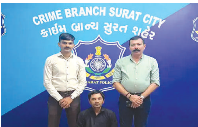
લાંબા સમયથી નાસતા ફરતા એક શખ્સને સુરત શહેર કાઠમ બ્રાંચની ટીમે ભાતમીના આધારે સીતાનગર ચાર રસ્તા પાસેથી ઢબોચી લીધો હતો અને વધુ પૂછપરછ માટે સુરત શહેર કાઠમ બ્રાંચની કચેરી ખાતે લાવવામાં આવ્યો હતો.