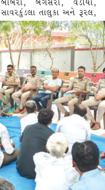
અમરેલી પોલીસ અધિક્ષક સંજય ખરાતના નિર્દેશ હેઠળ યોજાયેલા કાર્યક્રમમાં અમરેલી શહેર, રૂરલ, લાઠી, લીલીયા, દામનગર,

અમરેલી જિલ્લા પોલીસ દ્વારા જિલ્લાના કાયદો અને વ્યવસ્થાને વધુ મજબૂત બનાવવા તેમજ અન્ય જિલ્લા અને બહારના રાજ્યમાંથી રોજગારી માટે આવતા મજૂરો-કારીગરોની ચોકસાઈભરી માહિતી ઉપલબ્ધ રહે તે માટે શરૂ કરાયેલી અમરેલી સુરક્ષા કવચ ડિજિટલ એપ્લિકેશન અંગે જિલ્લાના ૨૦ પોલીસ સ્ટેશન વિસ્તારમાં વિશાળ જનજાગૃતિ અભિયાન હાથ ધરાવ્યું હતું. ૨૭ જૂને યોજાયેલા સેમિનારમાં અંદાજે ૨ હજાર જેટલા મજૂરો અને કારીગરોને એપ અંગે માર્ગદર્શન આપવામાં આવ્યું હતું. તેમજ સ્થળ પર જ તેમની નોંધણી પણ કરવામાં આવી હતી.