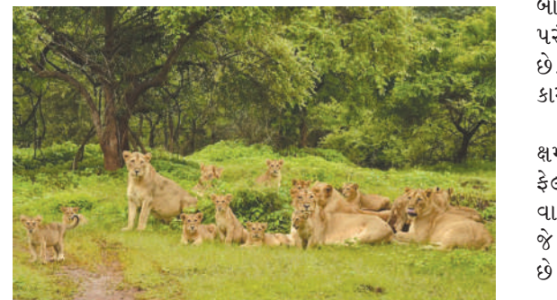
રેકોર્ડિંગ વધારો થયો છે, પરંતુ જંગલનો વિસ્તાર તે પ્રમાણમાં વધ્યો નથી. પરંતુ તેમાં ઘટાડો થયો છે.