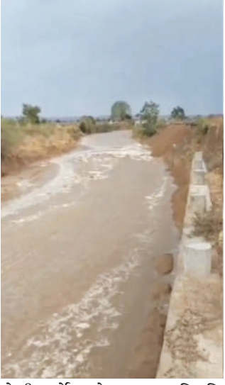
ખેતીકાર્યો માટે અનુકૂળ સ્થિતિ સર્જઈ હોવાનું ખેડૂતો જણાવી રહ્યા છે.

અમરેલી જિલ્લામાં રવિવારે વાતાવરણમાં અચાનક પલટો જોવા મળ્યો હતો. ખાંભા પંથકમાં બપોર બાદ ધનઘોર વાદળો છવાઈ જતાં વરસાદી માહોલ સર્જાયો હતો. થોડા જ સમયમાં ધીમીધારે વરસાદ શરૂ થતાં લાંબા સમયથી અનુભવાતી ગરમી અને ભારે બફારામાંથી લોકોને રાહત મળી હતી.