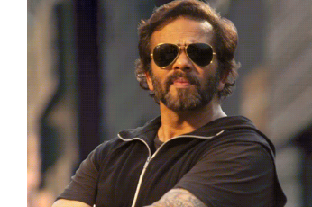
કે, 'ચાર મહિના પહેલા તેમના જુદું સ્થિત ઘર પર થયેલો ગોળીબાર તો, માત્ર એક ટ્રેલર હતું. જો માંગણીઓને નજરઅંદાજ કરવામાં આવશે, તો આ વખતે ગોળીઓ અચૂક વાગશે' રોહિત શેટ્ટીની ટીમે, આ અંગે ઔપચારિક ફોજદારી ફરિયાદ નોંધાવી છે. મુંબઈ પોલીસની કાર્ટમ બ્રાન્ચ અને જુહાપુરા સ્થાનિક વલીવટી તંત્રે એન્ટી-એક્ટરોશન સેલ (ખંડણી વિરોધી વિંગ)ને એકિટવ કરી દીધો છે. તપાસકર્તાઓના પ્રાથમિક વોઈસ મેચિંગ એનાલિસિસ દર્શાવે છે કે, જેલમાં બંધ ગેંગ લીડર લોરેન્સ બિશ્વોઈના ધમકી સાંભળી શકાય છે. ઓડિયોમાં કહેવામાં આવ્યું છે

મુંબઈ, બોલિવૂડ ફિલ્મમેકર રોહિત શેટ્ટીને જાનથી મારી નાખવાની ધમકી મળી છે. આ ધમકી તેમને એક ઓડિયો ક્લિપ દ્વારા આપવામાં આવી છે, અને તેની જવાબદારી લોરેન્સ બિશ્વોઈ ગેંગે લીધી છે. આ ગેંગે ૨૦ કરોડ રૂપિયાની ખંડણી માંગી છે અને આ નવી ધમકી જુદું સ્થિત રોહિત શેટ્ટીના ઘરની બહાર ચાર રાઉન્ડ ગોળીબાર થયાના થોડા મહિનાઓ બાદ જ આવી છે. શુભમ લોનકર તરફથી રોહિત શેટ્ટીની ટીમને મોકલવામાં આવેલી આ કથિત ઓડિયો ક્લિપમાં ધમકી સાંભળી શકાય છે. ઓડિયોમાં કહેવામાં આવ્યું છે કે, 'ચાર મહિના પહેલા તેમના જુદું સ્થિત ઘર પર થયેલો ગોળીબાર તો, માત્ર એક ટ્રેલર હતું. જો માંગણીઓને નજરઅંદાજ કરવામાં આવશે, તો આ વખતે ગોળીઓ અચૂક વાગશે' રોહિત શેટ્ટીની ટીમે, આ અંગે ઔપચારિક ફોજદારી ફરિયાદ નોંધાવી છે. મુંબઈ પોલીસની કાર્ટમ બ્રાન્ચ અને જુહાપુરા સ્થાનિક વલીવટી તંત્રે એન્ટી-એક્ટરોશન સેલ (ખંડણી વિરોધી વિંગ)ને એકિટવ કરી દીધો છે. તપાસકર્તાઓના પ્રાથમિક વોઈસ મેચિંગ એનાલિસિસ દર્શાવે છે કે, જેલમાં બંધ ગેંગ લીડર લોરેન્સ બિશ્વોઈના ધમકી સાંભળી શકાય છે. ઓડિયોમાં કહેવામાં આવ્યું છે