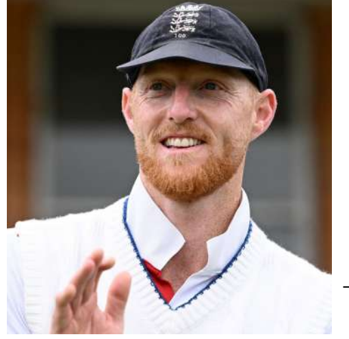
વર્તમાન ટેસ્ટ શ્રેણીની પ્રથમ મેચ વખતે સ્ટોકસ નાઈટકલબના વિવાદને કારણે ચર્ચસ્પષ્ટ થયો હતો. શિસ્તભંગના પગલાં તરીકે તેને શ્રેણીની બીજી ટેસ્ટની બહાર કરવામાં આવ્યો હતો અને હવે ત્રીજી ટેસ્ટની મધ્યમાં તેણે રિટાયરમેન્ટ જાહેર કરી દીધું છે.

નોટિંગમ, ઈંગ્લેન્ડના ઓલરાઉન્ડર અને કેપ્ટન બેન સ્ટોકસે જાહેર કર્યું છે કે અહીં ન્યૂ ઝીલેન્ડ સામે યાલ્વી રહેલી ત્રીજી ટેસ્ટ તેની આંતરરાષ્ટ્રીય ક્રિકેટની અંતિમ મેચ છે. તેણે જાહેરાત કરી છે કે તે આ ટેસ્ટને અંતે નિવૃત્તિ લેશે. સોમવાર, ૨૯મી જૂન આ ટેસ્ટનો અંતિમ દિવસ છે અને એ બેન સ્ટોકસની શાનદાર કારકિર્દીનો પણ આખરી દિવસ બનશે. તેણે આ જાહેરાત રવિવારે મેચના ચોથા દિવસે કરી હતી. ૩૫ વર્ષના સ્ટોકસની કરીઅરના ટૂંકમાં આંકડા આ મુજબ છે: (૧) ૧૨૧ ટેસ્ટમાં ૭,૨૨૮ રન અને ૨૪૬ વિકેટ (૨) ૧૧૪ વન-ડેમાં ૩,૪૬૩ રન અને ૭૪ વિકેટ (૩) ૪૩ ટી-૨૦માં ૫૮૫ રન અને ૨૬ વિકેટ. ૨૦૧૯માં ન્યૂ ઝીલેન્ડ સામેની વન-ડે વર્લ્ડ કપ ડબલ ટાઈવાળી ફાઈનલની જીત સ્ટોકસની ૧૫ વર્ષની અસાધારણ કારકિર્દીની સર્વશ્રેષ્ઠ મેચ હતી. ઈંગ્લેન્ડને ૨૦૨૨માં ટી-૨૦ વર્લ્ડ કપનો તાજ અપાવવામાં પણ તેનું મહત્વનું યોગદાન હતું. એ જ વર્ષમાં તેને કેપ્ટન્સી મળી હતી. ન્યૂ ઝીલેન્ડ સામેની