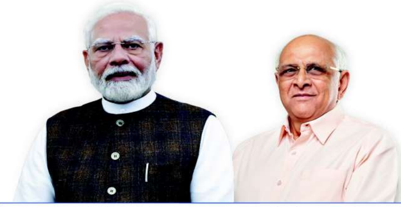
શ્રી નરેન્દ્ર મોદી માનનીય વડાપ્રધાન