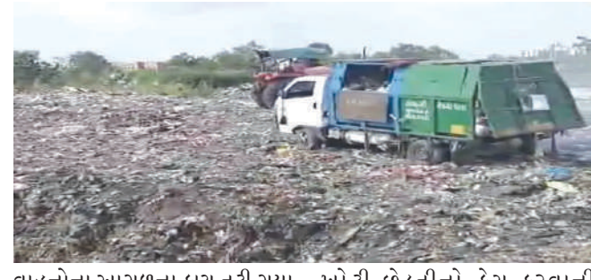
વાહનોના આગળના કાચ તૂટી ગયા હતા. આ ઉપરાંત, આરોપીએ વાહનના ડ્રાઈવર સહિત કમ્પાર્ટમેન્ટની છરી લઈને પીછો કર્યો હતો અને ગાળો આપી જાનથી મારી નાખવાની ધમકીઓ પણ આપી હતી.