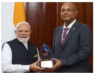
"હું આ સન્માનનો નમ્રતાપૂર્વક સ્વીકાર કરું છું અને તેને તે બધા રાષ્ટ્રોને સમર્પિત કરું જે આબોહવા પરિવર્તનના પડકાર સામે લડી રહ્યા છે અને પર્યાવરણીય સંરક્ષણને ભવિષ્યની પેઢીઓ પ્રત્યેની જવાબદારી તરીકે જુએ છે," પ્રધાનમંત્રીએ કહ્યું.

વિક્ટોરિયા, રવિવારે (૨૮ જૂન) વડા પ્રધાન નરેન્દ્ર મોદીને પર્યાવરણીય સંરક્ષણ અને ટકાઉ વિકાસમાં નેતૃત્વ માટે સેશેલ્સનો સર્વોચ્ચ સન્માન 'ગાર્ડિયન ઓફ ધ બ્લુ હોરાઈઝન' આપવામાં આવ્યું. સેશેલ્સના રાષ્ટ્રપતિ પેટ્રિક હર્મિનીએ પીએમ મોદીને આ એવોર્ડ એનાયત કર્યો. આ તેમનો વિદેશી રાષ્ટ્રતરફથી ૩૮મો આંતરરાષ્ટ્રીય સન્માન છે. આ એવોર્ડ પીએમ મોદીના ટકાઉ વિકાસ અને તેમના ગ્રીન વિઝન માટેના લાંબા સમયથી ચાલતા પ્રયાસને સ્વીકારે છે. સેશેલ્સ કોસ્ટ ગાર્ડિયન ખાતે આયોજિત એક સમારોહમાં, પીએમ મોદીએ દેશના કોસ્ટ ગાર્ડિયન 'મેડ ઇન ઇન્ડિયા' કોસ્ટ પ્રોટેક્શન પ્લાન સોલ્યું, જે તેમની દરિયાઈ સુરક્ષા ક્ષમતાઓને મજબૂત બનાવવાની નવી દિલ્હીની પ્રતિબદ્ધતાને પુનઃપુષ્ટ કરે છે. પીએમ મોદીએ આબોહવા પરિવર્તન પડકારોનો સામનો કરતા દેશોને સન્માન સમર્પિત કર્યું. સેશેલ્સમાં 'ગાર્ડિયન ઓફ ધ બ્લુ હોરાઈઝન' એવોર્ડ પ્રાપ્ત કર્યા પછી, પીએમ મોદીએ આ સન્માન આબોહવા પરિવર્તન દ્વારા ઉભા થયેલા પડકારોનો સામનો કરવા માટે કામ કરતા તમામ રાષ્ટ્રોને સમર્પિત કર્યું. સેશેલ્સના રાષ્ટ્રપતિ ડો. પેટ્રિક હર્મિની સાથે સંયુક્ત પ્રેસ નિવેદન દરમિયાન, પ્રધાનમંત્રી નરેન્દ્ર મોદીએ કહ્યું કે 'ગાર્ડિયન ઓફ ધ બ્લુ હોરાઈઝન' એવોર્ડ મેળવવો તેમના અને ભારતના ૧.૪ અબજ લોકો માટે ખૂબ જ ગર્વની વાત છે.