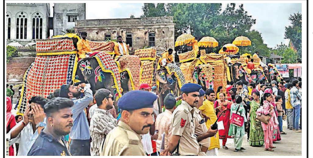
પ્રસિદ્ધ જગન્નાથ પુરીની સાથોસાથ અમદાવાદ ખાતે પણ રંગદર્શી જળયાત્રા સાથે રથયાત્રા મહોત્સવનો પ્રારંભ થયો છે. આ યાત્રામાં મોટી સંખ્યામાં ભાવિકો જોડાયા હતા.

આતંકવાદી હુમલાઓના જવાબમાં આ કડક ઓપરેશન શરૂ કરાયું છે. પાકિસ્તાન પોતાની રાષ્ટ્રીય સુરક્ષા અને સરહદોની રક્ષા મામલે કોઈ પણ પ્રકારનું સમાધાન નહી કરે. આતંકવાદીઓના સંપૂર્ણ સંક્રાંચા સુધી આ સૈન્ય કાર્યવાહી અટકશે નહીં.' આ હુમલા બાદ પાકિસ્તાન અને અફઘાનિસ્તાનની તાલિબાન સરકાર વચ્ચે સરહદી તણાવ ચરમસીમાએ પહોંચી ગયો છે.