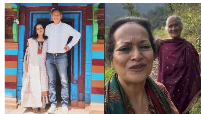
સિનેમા અને ટેલિવિઝન જગતમાં પોતાનું આગવું સ્થાન જાળવ્યું છે. તાજેતરમાં જ અભિનેત્રી મુંબઈના શોરબકોરથી દૂર પોતાના માદરેવતન શાંતિની પળો પસાર કરી રહી છે, ત્યારે પોતાના ગામનો સુંદર વીડિયો સોશિયલ મીડિયા પર શેર કર્યો હતો. હિમાની શિવપુરી હાલમાં ઉત્તરાખંડના ભટવાડી ગામમાં મુલાકાતે પહોંચી છે. આ ગામ ઉત્તરકાશી જિલ્લાનું અત્યંત પ્રાચીન અને સુંદર ગામ છે. પોતાની ગામની વિઝિટ કરાવતા અભિનેત્રીએ પોતાના ચાહકો સમક્ષ પોતાના સંબંધીઓનો પણ પરિચય કરાવ્યો હતો.

હિમાનીએ શેર કરેલા વીડિયોમાં તેમણે ગામમાં આવેલા ખેતરો, વૃક્ષો અને તે પહાડો પર પગ જમીનથી જોડાયેલા છે. અન્ય સામાન્ય વ્યક્તિની જેમ ગામમાં હળીમળીને પોતાના ખુશીના પળો માણી રહેલી અભિનેત્રીના સુંદર ગામને જોઈને ચાહકો પણ મને અહીંયાના જુદા જુદા ફળો અને વનસ્પતિ વિષે જણાવ્યું હતું અભિનેત્રીએ પોતાના વારસાગત ઘરની બહારની તસવીરો નેટવર્ક સાથે શેર કરી હતી. આ ફોટા સાથે કેપ્શનમાં લખ્યું હતું કે 'સુપ્રભાત. ગામડાની શાંતિ, તાજી હવા, પોતાનાઓનો પ્રેમ, ઘરના તાજા શાકભાજી, ઝરણાનું પાણી... શું શું ગણાવું.' આ ફોટા અને વીડિયો પરથી શિવપુરીએ ફિલ્મજગતમાં ખૂબ ઉત્તમ અભિનય કર્યો છે. જેમાં તેમણે 'હમ આપકે હે કોન', 'હમ સાથ સાથ હે', 'દિલવાલે દુલહનિયા લે જાયેંગે' જેવી બીજી ઘણી સુપરહિટ ફિલ્મોમાં કામ કરી દર્શકોના દિલ જીતી ચૂકી છે.