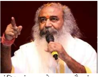
મંદિરમાં થયેલા કોભાંડ, અનિયમિતતાઓ અને ગેરરીતિઓની ઝૂંટે તપાસ થવી જોઈએ. દેશના લોકોને વડા પ્રધાન નરેન્દ્ર મોદીમાં વિશ્વાસ છે. ભારતના કરોડો લોકો જ નહીં પરંતુ વિશ્વભરના સનાતન ધર્મના અનુયાયીઓ પણ તેમના પર સંપૂર્ણ વિશ્વાસ રાખે છે, અને તેઓ હાલમાં છેતરાયાનો અનુભવ કરે છે," કૃષ્ણમે જણાવ્યું. "આપણે જાણવાની જરૂર છે કે કોણ સંરોવાયેલ છે, કોણ સંરોવાયેલ છે, આ વ્યક્તિઓને કોણે નિયુક્ત કર્યા

નવી દિલ્હી/અયોધ્યા, કોંગ્રેસના ભૂતપૂર્વ નેતા આચાર્ય પ્રમોદ કૃષ્ણમે કથિત રીતે ઉત્તર પ્રદેશ ખાતે આવેલ વિશ્વ વિખ્યાત રામ મંદિરમાં થયેલ દાન ચોરી કોભાંડ કેસમાં સેન્ટ્રલ બ્યુરો ઓફ ઇન્વેસ્ટિગેશન (CBI) તપાસની માંગ કરી હતી, અને કહ્યું હતું કે કરોડો મકતોની શ્રદ્ધા અને વિશ્વાસ જાળવવા માટે ઉચ્ચ સ્તરીય તપાસ જરૂરી છે. મીડિયા સાથે વાત કરતા આચાર્ય પ્રમોદ કૃષ્ણમે કહ્યું કે આ મામલો લાખો લોકોની શ્રદ્ધા અને આદર સાથે સંબંધિત છે અને તેની સંપૂર્ણ તપાસ થવી જોઈએ. "આ કરોડો લોકોની શ્રદ્ધા, આદર અને વિશ્વાસ સાથે સંબંધિત છે. તે વિશ્વાસને જાળવી રાખવા અને શ્રદ્ધાને જાળવી રાખવા માટે, રામ