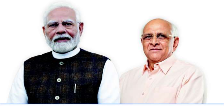
શ્રી નરેન્દ્ર મોદી માનનીય વડાપ્રધાન