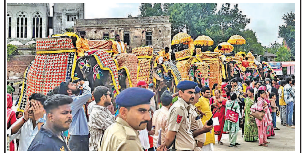
પ્રસિદ્ધ જગન્નાથ પુરીની સાથોસાથ અમદાવાદ ખાતે પણ રંગદર્શી જળયાત્રા સાથે રથયાત્રા મહોત્સવનો પ્રારંભ થયો છે. આ યાત્રામાં મોટી સંખ્યામાં ભાવિકો જોડાયા હતા.

આતંકવાદી હુમલાઓના જવાબમાં આ કડક ઓપરેશન શરૂ કરાયું છે. પાકિસ્તાન પોતાની રાષ્ટ્રીય સુરક્ષા અને સરહદોની રક્ષા મામલે કોઈ પણ પ્રકારનું સમાધાન નહી કરે. આતંકવાદીઓના સંપૂર્ણ સફાયા સુધી આ સૈન્ય કાર્યવાહી અટકશે નહીં.' આ હુમલા બાદ પાકિસ્તાન અને અફઘાનિસ્તાનની તાલિબાન સરકાર વચ્ચે સરહદી તણાવ ચરમસીમાએ પહોંચી ગયો છે.