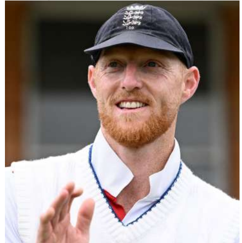
વર્તમાન ટેસ્ટ શ્રેણીની પ્રથમ મેચ વખતે સ્ટોકસ નાઈટકલબના વિવાદને કારણે ચર્ચસ્પષ્ટ થયો હતો. શિસ્તભંગના પગલાં તરીકે તેને શ્રેણીની બીજી ટેસ્ટની બહાર કરવામાં આવ્યો હતો અને હવે ત્રીજી ટેસ્ટની મધ્યમાં તેણે રિટાયરમેન્ટ જાહેર કરી દીધું છે.

નોટિંગમ, ઈંગ્લેન્ડના ઓલરાઉન્ડર અને કેપ્ટન બેન સ્ટોકસે જાહેર કર્યું છે કે અહીં ન્યૂ ઝીલેન્ડ સામે યાલ્વી રહેલી ત્રીજી ટેસ્ટ તેની આંતરરાષ્ટ્રીય ક્રિકેટની અંતિમ મેચ છે. તેણે જાહેરાત કરી છે કે તે આ ટેસ્ટને અંતે નિવૃત્તિ લેશે. સોમવાર, ૨૯મી જૂન આ ટેસ્ટનો અંતિમ દિવસ છે અને એ બેન સ્ટોકસની શાનદાર કારકિર્દીનો પણ આખરી દિવસ બનશે. તેણે આ જાહેરાત રવિવારે મેચના ચોથા દિવસે કરી હતી. ૩૫ વર્ષના સ્ટોકસની કરીઅરના ટૂંકમાં આંકડા આ મુજબ છે: (૧) ૧૨૧ ટેસ્ટમાં ૭,૨૨૮ રન અને ૨૪૬ વિકેટ (૨) ૧૧૪ વન-ડેમાં ૩,૪૬૩ રન અને ૭૪ વિકેટ (૩) ૪૩ ટી-૨૦માં ૫૮૫ રન અને ૨૬ વિકેટ. ૨૦૧૯માં ન્યૂ ઝીલેન્ડ સામેની વન-ડે વર્લ્ડ કપ ડબલ ટાઈવાળી ફાઈનલની જીત સ્ટોકસની ૧૫ વર્ષની અસાધારણ કારકિર્દીની સર્વશ્રેષ્ઠ મેચ હતી. ઈંગ્લેન્ડને ૨૦૨૨માં ટી-૨૦ વર્લ્ડ કપનો તાજ અપાવવામાં પણ તેનું મહત્વનું યોગદાન હતું. એ જ વર્ષમાં તેને કેપ્ટન્સી મળી હતી. ન્યૂ ઝીલેન્ડ સામેની