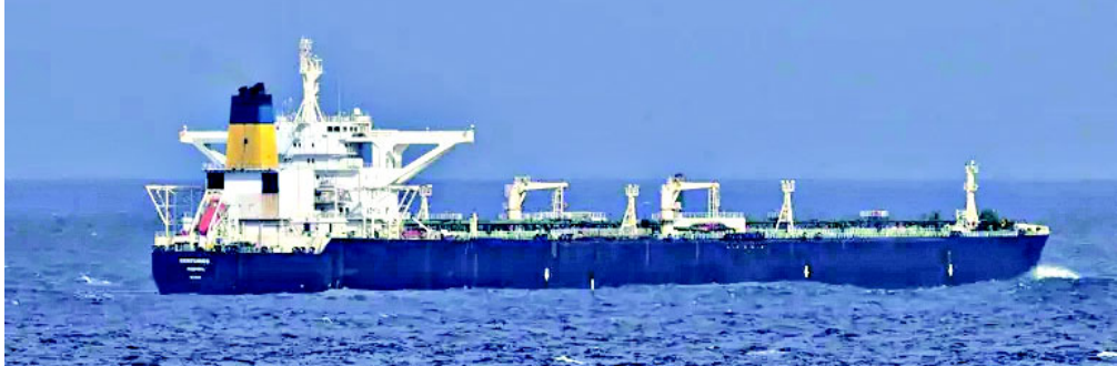
કોસ્ટ ગાર્ડ અને લશ્કરી દળોએ સમુદ્રમાં ઓપરેશન કરીને સ્ સોફિયાને અટકાવ્યું હતું. તે સમયે અમેરિકાએ આ જહાજને "રાજ્યવિહીન" અને "ડાર્ક ફ્લીટ" (પ્રતિબંધો ચોરી છૂપીથી તોડતું જહાજ) ગણાવ્યું હતું. આરોપ હતો કે આ ટેન્કર વેનેઝુએલાના અમેરિકાએ વેનેઝુએલાના આવા

વોશિંગ્ટન અમેરિકાના પ્રમુખ ડોનાલ્ડ ટ્રમ્પના વહીવટીતંત્રે એક અત્યંત આશ્ચર્યજનક નિર્ણય લેતા વેનેઝુએલાનું જમ કરેલું કૂડ ઓઈલનું ટેન્કર પરત કરવાનો આદેશ આપ્યો છે. પનામાના ધ્વજ ધરાવતા સ્ સોફિયા (સૂ જીરેક) નામના આ ટેન્કરને મુક્ત કરવાના નિર્ણયથી આખી દુનિયા ચોકી ઉઠી છે, કારણ કે ટ્રમ્પ પ્રશાસન સામાન્ય રીતે પ્રતિબંધોના મામલે અત્યંત કડક વલણ માટે જાણીતું છે. અહેવાલો અનુસાર, સાતમી જાન્યુઆરી ૨૦૨૬ના રોજ યુએસ