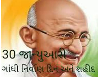
30 જાન્યુઆરી ગાંધી નિર્વાણ દિને અને શહીદ ગાંધીજીની દીર્ઘ દ્રષ્ટિ અને ભાવિ સંકેતથી સોમનાથ મંદિર નિર્માણકાર્ય સુયોગ્ય રીતે પરિપૂર્ણ થયું હતું. જો કે સરદાર કે ગાંધીજી આ નૂતન મંદિરને જોઈ શક્યા ન હતા. ગાંધીજીના વેરાવળ સોમનાથ ખાતેના સંસ્મરણો અનેક છે. ગાંધીજી રાષ્ટ્રપિતા ન હતા એ વખતે વડિયા દરબાર અને વાળા બાવા તેમજ સુમરીબાઈના કેસ અંગે એડવોકેટ તરીકે ૧૯૦૨માં તા. ૩-૪-૧૯ એપ્રિલે વેરાવળ પોલિટિકલ એજન્ટની કોર્ટમાં આવ્યા હતા. તા. ૬ ના રોજ વેરાવળથી રાજકોટ જવા નીકળ્યા હતા. ગાંધીજીના નિર્વાણ બાદ તા. ૧૨ ફેબ્રુઆરી ૧૯૪૮ના રોજ પ્રભાસના પવિત્ર ત્રિવેણી સંગમમાં રામધૂન સાથે અસ્થિ વિસર્જન કરવામાં આવ્યા હતા. ગાંધીજીના દેહાંતના રેડિયો ન્યુઝ લોકોએ રેડિયો પરથી સાંભળ્યા ત્યારે શોકમગ્ન થઈ ગયા હતા. અસ્થિકળશ વેરાવળથી સોમનાથ પહોંચ્યો ત્યારે 'ગાંધીજી અમર રહો'ના ગગનભેદી નારાઓ લાગ્યા હતા.

પ્રભાસપાટણ: દેશને આઝાદી અપાવવામાં મહત્વનું યોગદાન આપનારા મહાત્મા ગાંધીજીના આજે પુણ્યતિથિ છે. ગાંધી નિર્વાણ દિને એ જાણવું રસદ્રવ્ય થશે કે સોમનાથ મહાદેવ મંદિરનો જિર્ણોદ્ધાર કરવા સરદાર પટેલે દ્રઢ સંકલ્પ કર્યો તેમાં સરકારની મંજૂરી પણ મળી ગઈ હતી. આમ છતાં સરદાર પટેલે ગાંધીજીનું માર્ગદર્શન માગ્યું હતું. એ વખતે ગાંધીજીએ કહ્યું હતું કે આ મંદિર લોકજાળાથી બને અને એની દેખરેખ તેમજ અમલ માટે ટ્રસ્ટની રચના કરવામાં આવે. આ સૂચન સરદાર પટેલે શિરોમાન્ય રાખ્યું અને સોમનાથ ટ્રસ્ટની રચના કરવામાં આવી હતી. 30 જાન્યુઆરી ગાંધી નિર્વાણ દિને અને શહીદ ગાંધીજીની દીર્ઘ દ્રષ્ટિ અને ભાવિ સંકેતથી સોમનાથ મંદિર નિર્માણકાર્ય સુયોગ્ય રીતે પરિપૂર્ણ થયું હતું. જો કે સરદાર કે ગાંધીજી આ નૂતન મંદિરને જોઈ શક્યા ન હતા. ગાંધીજીના વેરાવળ સોમનાથ ખાતેના સંસ્મરણો અનેક છે. ગાંધીજી રાષ્ટ્રપિતા ન હતા એ વખતે વડિયા દરબાર અને વાળા બાવા તેમજ સુમરીબાઈના કેસ અંગે એડવોકેટ તરીકે ૧૯૦૨માં તા. ૩-૪-૧૯ એપ્રિલે વેરાવળ પોલિટિકલ એજન્ટની કોર્ટમાં આવ્યા હતા. તા. ૬ ના રોજ વેરાવળથી રાજકોટ જવા નીકળ્યા હતા. ગાંધીજીના નિર્વાણ બાદ તા. ૧૨ ફેબ્રુઆરી ૧૯૪૮ના રોજ પ્રભાસના પવિત્ર ત્રિવેણી સંગમમાં રામધૂન સાથે અસ્થિ વિસર્જન કરવામાં આવ્યા હતા. ગાંધીજીના દેહાંતના રેડિયો ન્યુઝ લોકોએ રેડિયો પરથી સાંભળ્યા ત્યારે શોકમગ્ન થઈ ગયા હતા. અસ્થિકળશ વેરાવળથી સોમનાથ પહોંચ્યો ત્યારે 'ગાંધીજી અમર રહો'ના ગગનભેદી નારાઓ લાગ્યા હતા.