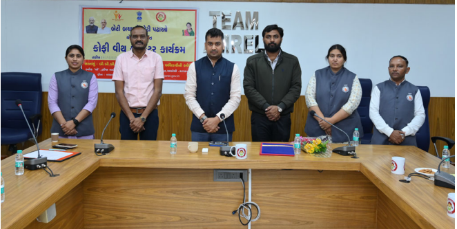
કેન્દ્ર સરકાર અને રાજ્ય સરકાર દ્વારા આયોજિત વિવિધ સ્પર્ધાત્મક પરીક્ષાઓમાં દીકરીઓ ભાગ લે ઉપરાંત પરીક્ષાઓમાં સફળતા પ્રાપ્ત કરી શકે તે માટે જિલ્લા કલેક્ટર શ્રી વિકલ્પ ભારદ્વાજ દ્વારા વિસ્તૃત માર્ગદર્શન પૂરું પાડવામાં આવ્યું હતું. જિલ્લા કલેક્ટરશ્રીના હસ્તે લાભાર્થીઓને દીકરી વધામણા કીટ, હાઈજીન કીટ, શિક્ષણ કીટ, વ્હાલી દીકરી યોજના હેઠળ મંજૂરી હુકમનું વિતરણ કરવામાં આવ્યું હતું. સાથે સરકારની વિવિધ લોક કલ્યાણલક્ષી અને મહિલાલક્ષી યોજનાઓ વિષયક માહિતી આપવામાં આવી હતી. ઉલ્લેખનીય છે કે, સમગ્ર કાર્યક્રમ જિલ્લા મહિલા અને બાળ અધિકારીશ્રીની કચેરી દ્વારા યોજાયો હતો.

અમરેલી: અમરેલી જિલ્લા સેવા સદન ખાતે "બેટી બચાવો, બેટી પઢાવો" યોજના હેઠળ જિલ્લા કલેક્ટર શ્રી વિકલ્પ ભારદ્વાજના અધ્યક્ષ સ્થાને 'કોફી વીથ કલેક્ટર' કાર્યક્રમ યોજાયો હતો. જેમાં વિવિધ સ્પર્ધાત્મક પરીક્ષાની તૈયારી કરતી દીકરીઓ સાથે જિલ્લા કલેક્ટરશ્રીએ પ્રેરણાત્મક સંવાદ સાધ્યો હતો. કેન્દ્ર સરકાર અને રાજ્ય સરકાર દ્વારા આયોજિત વિવિધ સ્પર્ધાત્મક પરીક્ષાઓમાં દીકરીઓ ભાગ લે ઉપરાંત પરીક્ષાઓમાં સફળતા પ્રાપ્ત કરી શકે તે માટે જિલ્લા કલેક્ટર શ્રી વિકલ્પ ભારદ્વાજ દ્વારા વિસ્તૃત માર્ગદર્શન પૂરું પાડવામાં આવ્યું હતું. જિલ્લા કલેક્ટરશ્રીના હસ્તે લાભાર્થીઓને દીકરી વધામણા કીટ, હાઈજીન કીટ, શિક્ષણ કીટ, વ્હાલી દીકરી યોજના હેઠળ મંજૂરી હુકમનું વિતરણ કરવામાં આવ્યું હતું. સાથે સરકારની વિવિધ લોક કલ્યાણલક્ષી અને મહિલાલક્ષી યોજનાઓ વિષયક માહિતી આપવામાં આવી હતી. ઉલ્લેખનીય છે કે, સમગ્ર કાર્યક્રમ જિલ્લા મહિલા અને બાળ અધિકારીશ્રીની કચેરી દ્વારા યોજાયો હતો.