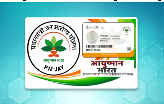
આરોગ્ય યોજના' હેઠળ આ તમામ નાગરિકોને કુલ મળીને રૂ. ૧૬.૯૯ કરોડના ખર્ચે નિ:શુલ્ક આરોગ્ય સારવાર આપવામાં આવી છે. જિલ્લામાં વર્ષ ૨૦૨૪-૨૫માં (ચાલુ વર્ષ) કુલ ૫૩,૭૦૨ નવા 'આયુષ્માન કાર્ડ'નું વિતરણ કરવામાં આવ્યું છે, આમ વંચિત, ગરીબોને આરોગ્ય કવચ