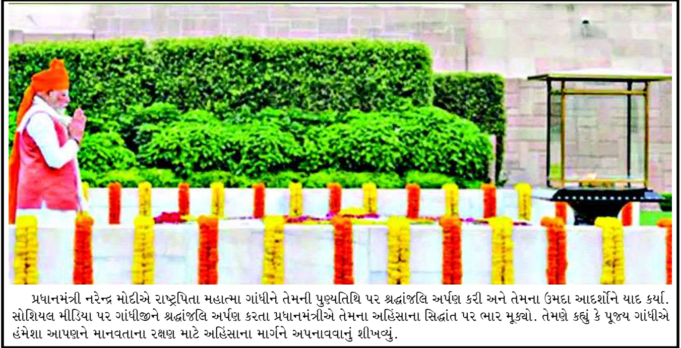
પ્રધાનમંત્રી નરેન્દ્ર મોદીએ રાષ્ટ્રપિતા મહાત્મા ગાંધીને તેમની પુણ્યતિથિ પર શ્રદ્ધાંજલિ અર્પણ કરી અને તેમના ઉમદા આદર્શોને યાદ કર્યાં. સોશિયલ મીડિયા પર ગાંધીજીને શ્રદ્ધાંજલિ અર્પણ કરતા પ્રધાનમંત્રીએ તેમના અહિંસાના સિદ્ધાંત પર ભાર મૂક્યો. તેમણે કહ્યું કે પૂજ્ય ગાંધીએ હંમેશા આપણને માનવતાના રક્ષણ માટે અહિંસાના માર્ગને અપનાવવાનું શીખવ્યું.

હાલમાં પોલીસે અકસ્માત સ્થળે પંચનામું કરી મૃતકોની ઓળખ વિધિ માટેની પ્રક્રિયા હાથ ધરી છે. કારના નંબર અને એન્જિન નંબરના આધારે માલિકની ઓળખ કરવાના પ્રયાસો ચાલુ છે. આ ઘટનાને પગલે ગોંડલ પંથકમાં અરેરાટી વ્યાપી ગઈ છે.