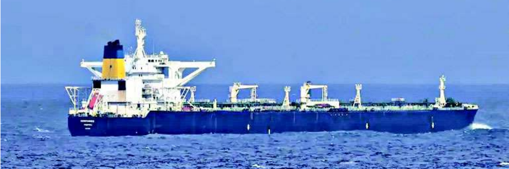
કોસ્ટ ગાર્ડ અને લશ્કરી દળોએ સમુદ્રમાં ઓપરેશન કરીને સ્ સોફિયાને અટકાવ્યું હતું. તે સમયે અમેરિકાએ આ જહાજને "રાજ્યવિહીન" અને "ડાર્ક ફ્લીટ" (પ્રતિબંધો ચોરી છૂપીથી તોડતું જહાજ) ગણાવ્યું હતું. આરોપ હતો કે આ ટેન્કર વેનેઝુએલાના અમેરિકાએ વેનેઝુએલાના આવા

વોશિંગ્ટન અમેરિકાના પ્રમુખ ડોનાલ્ડ ટ્રમ્પના વહીવટીતંત્રે એક અત્યંત આશ્ચર્યજનક નિર્ણય લેતા વેનેઝુએલાનું જમ કરેલું કૂડ ઓઈલનું ટેન્કર પરત કરવાનો આદેશ આપ્યો છે. પનામાના ધ્વજ ધરાવતા સ્ સોફિયા (સૂ જીરેક) નામના આ ટેન્કરને મુક્ત કરવાના નિર્ણયથી આખી દુનિયા ચોંકી ઉઠી છે, કારણ કે ટ્રમ્પ પ્રશાસન સામાન્ય રીતે પ્રતિબંધોના મામલે અત્યંત કડક વલણ માટે જાણીતું છે.