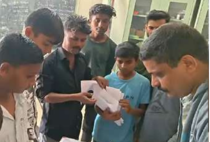
શકે તો તેનું નામ મતદાર યાદીમાંથી કપાઈ જવાની ભીતિ છે. આનાથી અનેક નાગરિકો તેમના મૂળભૂત લોકશાહી અધિકાર, એટલે કે મતાધિકારથી વંચિત થવાની આશંકા અનુભવી રહ્યા છે. ગામમાં "દસ્તાવેજો છે, ઈરાદો પણ છે, પણ સમય નથી" તેવો રોષભર્યો સૂર સંભળાઈ રહ્યો છે.