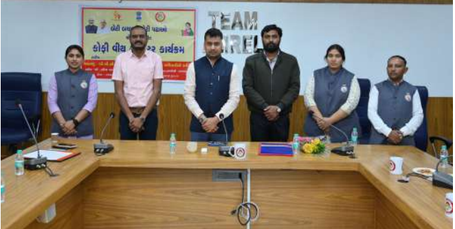
સરકારની વિવિધ લોક કલ્યાણલક્ષી અને મહિલાલક્ષી યોજનાઓ વિષયક માહિતી આપવામાં આવી હતી. ઉલ્લેખનીય છે કે, સમગ્ર કાર્યક્રમ જિલ્લા મહિલા અને બાળ અધિકારીશ્રીની કચેરી દ્વારા યોજાયો હતો.