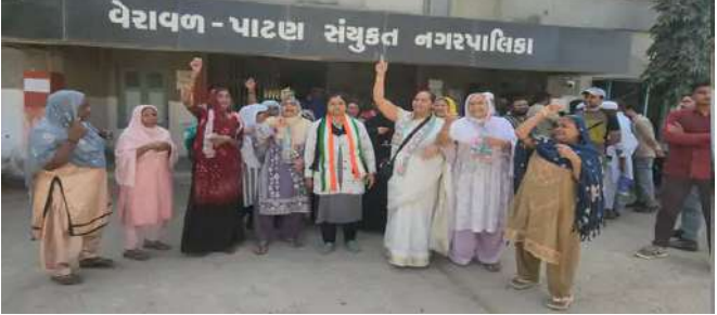
ઉલ્લેખનીય છે કે વેરાવળ શહેરમાં છેલ્લા કેટલાક સમયથી નાગરિક સુવિધાઓને લઈને અસંતોષનો માહોલ છે. આજે થયેલ કોંગ્રેસનું આ વિરોધ પ્રદર્શન એ સ્પષ્ટ સંકેત આપે છે કે જો તંત્ર દ્વારા તાત્કાલિક પગલાં લેવામાં નહીં આવે, તો આગામી દિવસોમાં આંદોલન વધુ ઉગ્ર બની શકે છે.

ગીર સોમનાથ:વેરાવળ શહેરમાં લાંબા સમયથી ચાલી રહેલી નાગરિક સમસ્યાઓ સામે આજે અસંતોષ જોવા મળ્યો હતો. વેરાવળ નગરપાલિકા ખાતે કોંગ્રેસ દ્વારા ઉગ્ર વિરોધ પ્રદર્શન કરવામાં આવ્યું. શહેરના બિસ્માર રોડ-રસ્તા, ગંદકી, ડ્રેનેજ, પીવાના પાણી અને અન્ય પ્રાથમિક સુવિધાઓના અભાવને લઈને કોંગ્રેસના કાર્યકરો સાથે મોટી સંખ્યામાં નાગરિકોએ વિરોધ નોંધાવ્યો હતો. આ વિરોધ પ્રદર્શનનું નેતૃત્વ ધારાસભ્ય વિમલ ચુડાસમાએ કર્યું હતું. તેમની આગેવાનીમાં કોંગ્રેસના કાર્યકરો અને નાગરિકોએ રેલી કાઢી નગરપાલિકા કચેરી સુધી પહોંચી ઉગ્ર સૂઝોચ્ચાર કર્યા હતા. નગરપાલિકા કચેરી આસપાસ થોડા સમય માટે ભારે ગહમાગહમીનો માહોલ સર્જાયો હતો. વિરોધ પ્રદર્શન દરમિયાન કોંગ્રેસ દ્વારા ૬૦૦થી વધુ નાગરિક ફરિયાદોના નગરપાલિકા માટે સંઘર્ષ કરવો પડી રહ્યો છે. ઉલ્લેખનીય છે કે વેરાવળ શહેરમાં છેલ્લા કેટલાક સમયથી નાગરિક સુવિધાઓને લઈને અસંતોષનો માહોલ છે. આજે થયેલ કોંગ્રેસનું આ વિરોધ પ્રદર્શન એ સ્પષ્ટ સંકેત આપે છે કે જો તંત્ર દ્વારા તાત્કાલિક પગલાં લેવામાં નહીં આવે, તો આગામી દિવસોમાં આંદોલન વધુ ઉગ્ર બની શકે છે. તેમણે સ્પષ્ટ ચીમકી આપી હતી કે જો નગરપાલિકા દ્વારા વહેલી તકે તમામ પ્રશ્નોનું યોગ્ય નિરાકરણ નહીં લાવવામાં આવે, તો આ મુદ્દો આગામી સમયમાં વિધાનસભાના ચુડાસમાએ જણાવ્યું કે, વેરાવળના નાગરિકો નિયમિત રીતે ટેક્સ ભરે છે, છતાં તેમને મૂળભૂત સુવિધાઓ માટે સંઘર્ષ કરવો પડી રહ્યો છે. વેરાવળ શહેરમાં છેલ્લા કેટલાક સમયથી નાગરિક સુવિધાઓને લઈને અસંતોષનો માહોલ છે. આજે થયેલ કોંગ્રેસનું આ વિરોધ પ્રદર્શન એ સ્પષ્ટ સંકેત આપે છે કે જો તંત્ર દ્વારા તાત્કાલિક પગલાં લેવામાં નહીં આવે, તો આગામી દિવસોમાં આંદોલન વધુ ઉગ્ર બની શકે છે.