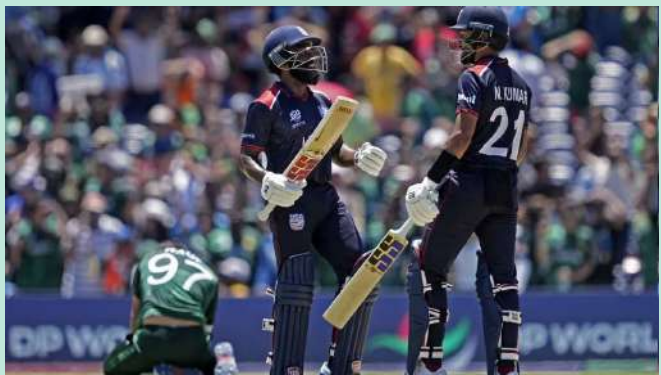
આઈસીસી દ્વારા એરોન જોન્સના સસ્પેન્શન અંગે જાણ કરાયેલા એક નિવેદનમાં કહેવામાં આવ્યું હતું કે તેમના પર મેચ ફિક્સિંગ અને ભ્રષ્ટાચારના પાંચ ગંભીર આરોપો મૂકવામાં આવ્યા છે. આમાંથી ત્રણ આરોપો ૨૦૨૩-૨૪માં રમાયેલી બાબારીસ સ્થિત બીઆઈએમ ૧૦

નવીદિલ્હી, ભારત અને શ્રીલંકા દ્વારા સંયુક્ત રીતે આયોજિત ટી ૨૦ વર્લ્ડ કપ ૭ ફેબ્રુઆરીથી શરૂ થવાનો છે, જેમાં યુએસએ ક્રિકેટ ટીમ સહિત ૨૦ ટીમો ભાગ લેશે. ૨૦૨૪ ના ટી ૨૦ વર્લ્ડ કપમાં, યુએસએ ટીમે સુપર આઠમાં પહોંચીને મેગા-ઈવેન્ટમાં સીધો સ્થાન મેળવ્યો હતો, જ્યાં એરોન જોન્સે બેટથી મહત્વપૂર્ણ ભૂમિકા ભજવી હતી. દરમિયાન, આગામી મેગા-ઈવેન્ટ પહેલા યુએસએને મોટો ઝટકો લાગ્યો છે કારણ કે જોન્સ પર મેચ ફિક્સિંગ અને ભ્રષ્ટાચારના ગંભીર આરોપો મૂકવામાં આવ્યા છે. આ આરોપો બાદ, આઈસીસીએ જોન્સને તાત્કાલિક અસરથી સસ્પેન્ડ કરવાનો નિર્ણય લીધો છે.