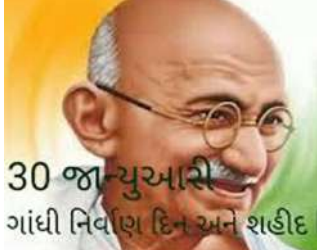
30 જાન્યુઆરી ગાંધી નિર્વાણ દિન અને શહીદ ગાંધીજીની દીર્ઘ દ્રષ્ટિ અને ભાવિ સંકેતથી સોમનાથ મંદિર નિર્માણકાર્ય સુયોગ્ય રીતે પરિપૂર્ણ થયું હતું. જો કે સરદાર કે ગાંધીજી આ નૂતન મંદિરને જોઈ શક્યા ન હોત. ગાંધીજીના વેરાવળ સોમનાથ ખાતેના સંસ્મરણો અનેક છે. ગાંધીજી રાષ્ટ્રપિતા ન હતા એ વખતે વડિયા દરબાર અને વાળા બાવા તેમજ સુમરીબાઈના કેસ અંગે