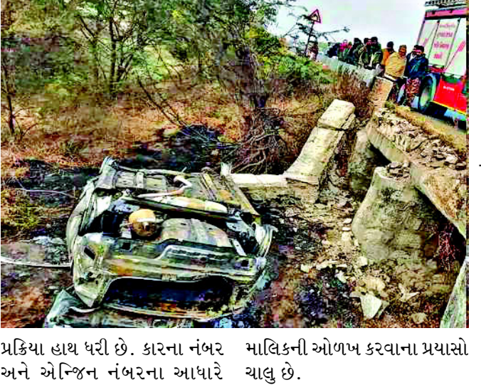
પ્રક્રિયા હાથ ધરી છે. કારના નંબર માલિકની ઓળખ કરવાના પ્રયાસો અને એન્જિન નંબરના આધારે ચાલુ છે.

સવાર મુસાફરોને બારણું ખોલવાની પણ તક મળી ન હતી. વહેલી સવારે સર્જાયેલા આ અકસ્માત પાછળ અનેક કારણોની ચર્ચા થઈ રહી છે. વહેલી સવારે ઘાઈવે પર ધવાયેલા ગાઠ ધુમ્મસને કારણે વિઝિબિલિટી ઓછી હોઈ શકે છે. ચાલકને ઊંધનું ઝેંકું આવી જતાં કાર પુલ નીચે ઉતરી ગઈ હોવાની પણ શક્યતા છે. હાલમાં પોલીસે અકસ્માત સ્થળે પંચનામું કરી મૃતકોની ઓળખ વિધિ માટેની