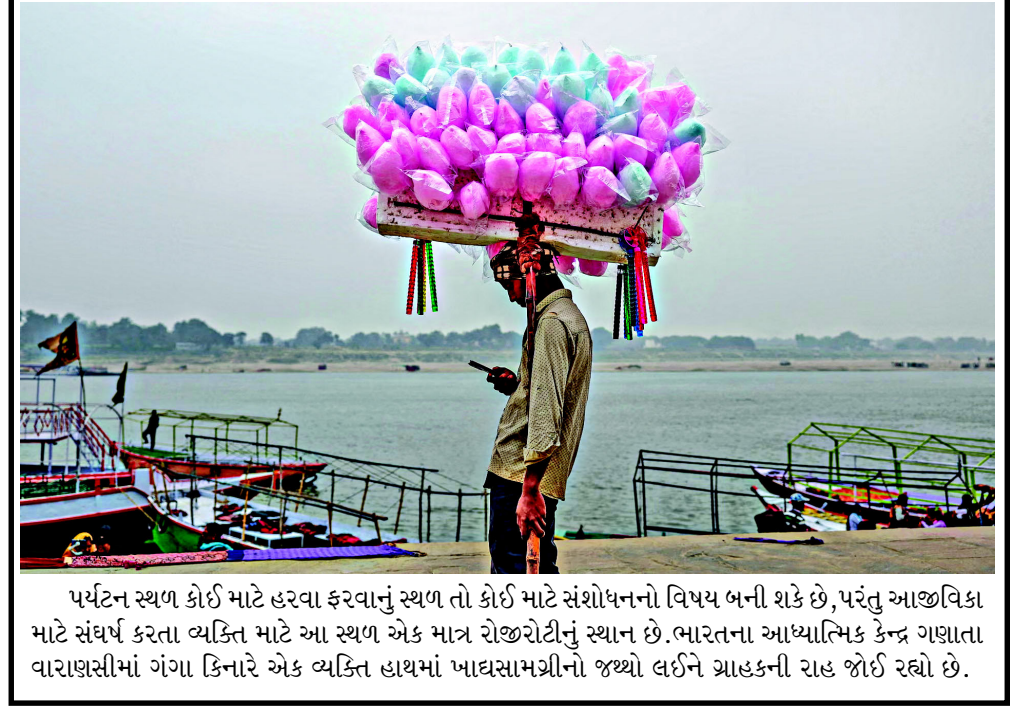
પર્યટન સ્થળ કોઈ માટે હરવા ફરવાનું સ્થળ તો કોઈ માટે સંશોધનનો વિષય બની શકે છે, પરંતુ આજીવિકા માટે સંઘર્ષ કરતા વ્યક્તિ માટે આ સ્થળ એક માત્ર રોજીટોનું સ્થાન છે. ભારતના આધ્યાત્મિક કેન્દ્ર ગણાતા વારાણસીમાં ગંગા કિનારે એક વ્યક્તિ હાથમાં ખાદ્યસામગ્રીનો જથ્થો લઈને ગ્રાહકની રાહ જોઈ રહ્યો છે.

ઘાઈજેક કરી બોમ્બથી ઈડાવી દેવાની ધમકી મળતા ઈન્ડિગોની ફ્લાઈટનું અમદાવાદમાં ઈમરજન્સી લેન્ડિંગ કુવૈતથી દિલ્હી જતી ઈન્ડિગોની ફ્લાઈટમાં ટિશ્યુ પેપર પર ધમકીભર્યું લખાણ મળતા ફ્લાઈટ અમદાવાદ ડાયવર્ટ કરાઈ