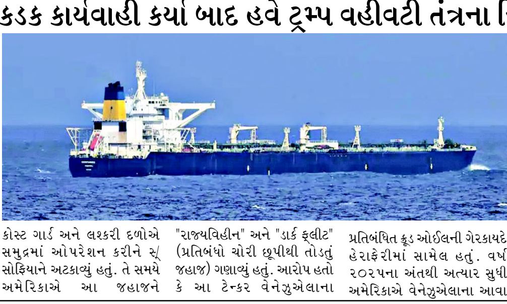
કોસ્ટ ગાર્ડ અને લશ્કરી દળોએ સમુદ્રમાં ઓપરેશન કરીને સ્ સોફિયાને અટકાવ્યું હતું. તે સમયે અમેરિકાએ આ જહાજને 'રાજ્યવિહીન' અને 'ડાર્ક ફ્લીટ' (પ્રતિબંધો ચોરી છૂપીથી તોડતું જહાજ) ગણાવ્યું હતું. આરોપ હતો કે આ ટેન્કર વેનેઝુએલાના પ્રતિબંધિત કૂડ ઓઈલની ગેરકાયદે હેરાફેરીમાં સામેલ હતું. વર્ષ ૨૦૨૫ના અંતથી અત્યાર સુધી અમેરિકાએ વેનેઝુએલાના આવા

વોશિંગ્ટન - અમેરિકાના પ્રમુખ ડોનાલ્ડ ટ્રમ્પના વહીવટીતંત્રે એક અત્યંત આશ્ચર્યજનક નિર્ણય લેતા વેનેઝુએલાનું જમ કરેલું કૂડ ઓઈલનું ટેન્કર પરત કરવાનો આદેશ આપ્યો છે. પનામાના ધ્વજ ધરાવતા સ્ સોફિયા (સૂ જીરેક) નામના આ ટેન્કરને મુક્ત કરવાના નિર્ણયથી આખી દુનિયા ચોંકી ઊઠી છે, કારણ કે ટ્રમ્પ પ્રશાસન સામાન્ય રીતે પ્રતિબંધોના મામલે અત્યંત કડક વલણ માટે જાણીતું છે. અહેવાલો અનુસાર, સાતમી જાન્યુઆરી ૨૦૨૬ના રોજ યુએસ