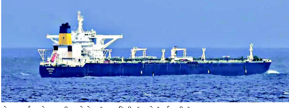
કોસ્ટ ગાર્ડ અને લશ્કરી દળોએ સમુદ્રમાં ઓપરેશન કરીને સ્ સોફિયાને અટકાવ્યું હતું. તે સમયે અમેરિકાએ આ જહાજને "રાજયવિહીન" અને "ડાર્ક ફ્લીટ" (પ્રતિબંધો ચોરી છૂપીથી તોડતું જહાજ) ગણાવ્યું હતું. આરોપ હતો કે આ ટેન્કર વેનેઝુએલાના અમેરિકાએ વેનેઝુએલાના આવા

વોશિંગ્ટન અમેરિકાના પ્રમુખ ડોનાલ્ડ ટ્રમ્પના વહીવટીતંત્રે એક અત્યંત આશ્ચર્યજનક નિર્ણય લેતા વેનેઝુએલાનું જમ કરેલું કૂડ ઓઈલનું ટેન્કર પરત કરવાનો આદેશ આપ્યો છે. પનામાના ધ્વજ ધરાવતા સ્ સોફિયા (સૂ જીરેક) નામના આ ટેન્કરને મુક્ત કરવાના નિર્ણયથી આખી દુનિયા ચોંકી ઉઠી છે, કારણ કે ટ્રમ્પ પ્રશાસન સામાન્ય રીતે પ્રતિબંધોના મામલે અત્યંત કડક વલણ માટે જાણીતું છે. અહેવાલો અનુસાર, સાતમી જાન્યુઆરી ૨૦૨૬ના રોજ યુએસ