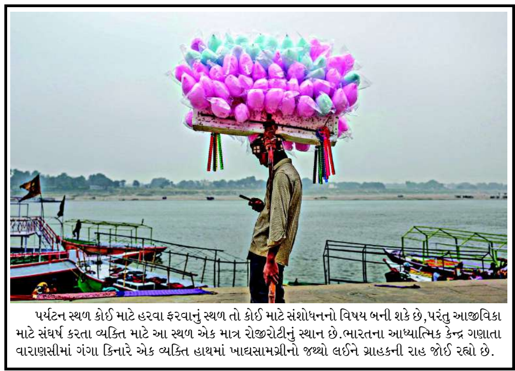
પર્યટન સ્થળ કોઈ માટે હરવા ફરવાનું સ્થળ તો કોઈ માટે સંશોધનનો વિષય બની શકે છે, પરંતુ આજીવિકા માટે સંઘર્ષ કરતા વ્યક્તિ માટે આ સ્થળ એક માત્ર રોજગીરીનું સ્થાન છે. ભારતના આધ્યાત્મિક કેન્દ્ર ગણાતા વારાણસીમાં ગંગા કિનારે એક વ્યક્તિ હાથમાં ખાવસામગ્રીનો જથ્થો લઈને ગ્રાહકની રાહ જોઈ રહ્યો છે.