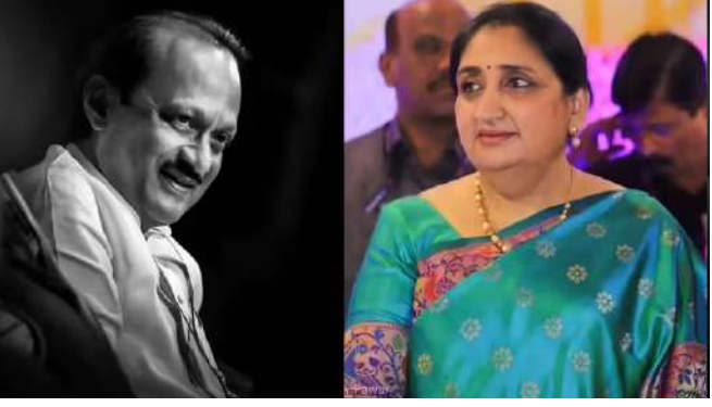
સુનેત્રા પવાર સ્નાતક છે. તેણીએ ઓરંગાબાદના ડો. બાબાસાહેબ આંબેડકર મરાઠવાડા યુનિવર્સિટીમાંથી બી.કોમ પૂર્ણ કર્યું. તેણીએ ૧૯૮૩ માં ત્યાં પોતાનો અભ્યાસ પૂર્ણ કર્યો.

મુંબઈ, મહારાષ્ટ્રના સ્વર્ગસ્થ નાયબ મુખ્યમંત્રી અજિત પવારની પાર્ટીએ તેમના ઉત્તરાધિકારી તરીકે તેમની પત્ની સુનેત્રા પવારને નિયુક્ત કર્યા છે. દ્વંજના કાર્યકારી પ્રમુખ પ્રફુલ્લ પટેલ અને પાર્ટીના દિગ્ગજ નેતા છગન ભુજબળના જણાવ્યા અનુસાર, સુનેત્રા પવારને નાયબ મુખ્યમંત્રી તરીકે નિયુક્ત કરવાનો પ્રસ્તાવ ભાજપને સુપરત કરવામાં આવશે. સુનેત્રા પવાર હાલમાં રાજ્યસભાના સાંસદ છે. જો તે ડેપ્યુટી સીએમ બનશે, તો તે અજિત પવારની ભારામતી બેઠક પરથી ચૂંટણી લડશે અને ધારાસભ્ય બનશે.