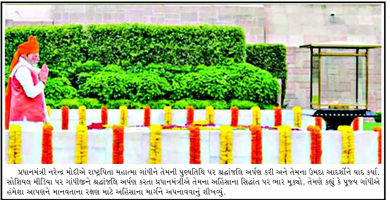
પ્રધાનમંત્રી નરેન્દ્ર મોદીએ રાષ્ટ્રપિતા મહાત્મા ગાંધીને તેમની પુણ્યતિથિ પર શ્રદ્ધાંજલિ અર્પણ કરી અને તેમના ઉમદા આદર્શોને યાદ કર્યાં. સોશિયલ મીડિયા પર ગાંધીજીને શ્રદ્ધાંજલિ અર્પણ કરતા પ્રધાનમંત્રીએ તેમના અહિંસાના સિદ્ધાંત પર ભાર મૂક્યો. તેમણે કહ્યું કે પૂજ્ય ગાંધીએ હંમેશા આપણને માનવતાના રક્ષણ માટે અહિંસાના માર્ગને અપનાવવાનું શીખવ્યું.

હાલમાં પોલીસે અકસ્માત સ્થળે પંચનામું કરી મૃતકોની ઓળખ વિધિ માટેની પ્રક્રિયા હાથ ધરી છે. કારના નંબર અને એન્જિન નંબરના આધારે માલિકની ઓળખ કરવાના પ્રયાસો ચાલુ છે. આ ઘટનાને પગલે ગોંડલ પંથકમાં અરેરાટી વ્યાપી ગઈ છે.