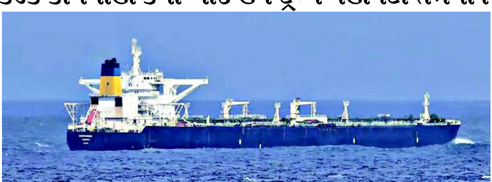
કોસ્ટ ગાર્ડ અને લશ્કરી દળોએ સમુદ્રમાં ઓપરેશન કરીને સ્ સોફિયાને અટકાવ્યું હતું. તે સમયે અમેરિકાએ આ જહાજને "રાજ્યવિહીન" અને "ડાર્ક ફ્લીટ" (પ્રતિબંધો ચોરી છૂપીથી તોડતું જહાજ) ગણાવ્યું હતું. આરોપ હતો કે આ ટેન્કર વેનેઝુએલાના પ્રતિબંધિત કૂડ ઓઈલની ગેરકાયદે હેરાફેરીમાં સામેલ હતું. વર્ષ ૨૦૨૫ના અંતથી અત્યાર સુધી અમેરિકાએ વેનેઝુએલાના આવા

વોશિંગ્ટન અમેરિકાના પ્રમુખ ડોનાલ્ડ ટ્રમ્પના વહીવટીતંત્રે એક અત્યંત આશ્ચર્યજનક નિર્ણય લેતા વેનેઝુએલાનું જમ કરેલું કૂડ ઓઈલનું ટેન્કર પરત કરવાનો આદેશ આપ્યો છે. પનામાના ઘ્વજ ધરાવતા સ્ સોફિયા (સૂ જીરેક) નામના આ ટેન્કરને મુક્ત કરવાના નિર્ણયથી આખી દુનિયા ચોકી ઉઠી છે, કારણ કે ટ્રમ્પ પ્રશાસન સામાન્ય રીતે પ્રતિબંધોના મામલે અત્યંત કડક વલણ માટે જાણીતું છે. અહેવાલો અનુસાર, સાતમી જાન્યુઆરી ૨૦૨૬ના રોજ યુએસ