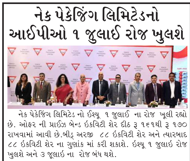
નેક પેકેજિંગ લિમિટેડ નો ઈચ્યૂ ૧ જુલાઈ ના રોજ ખુલી રહ્યો છે. ઓફર ની પ્રાઈઝ બેન્ડ ઈકવિટી શેર દીઠ રૂ ૧૬૧થી રૂ ૧૭૦ રાખવામાં આવી છે. બીડ અરજી ૮૮ ઈકવિટી શેર અને ત્યારબાદ ૮૮ ઈકવિટી શેર ના ગુણક માં કરી શકાશે. ઈચ્યૂ ૧ જુલાઈ રોજ ખુલશે અને ૩ જુલાઈ ના રોજ બંધ થશે.

આયોજન કર્યું હતું. આ રેલીમાં પ્રતિનિધિઓએ ઉત્સાહપૂર્વક ભાગ લીધો હતો, ડ્રગ મુક્ત સમાજના અને વિવિધ રાજ્યોના નિર્માણનો સંદેશ ફેલાવ્યો હતો. નેક પેકેજિંગ લિમિટેડનો આઈપીઓ ૧ જુલાઈ રોજ ખુલશે