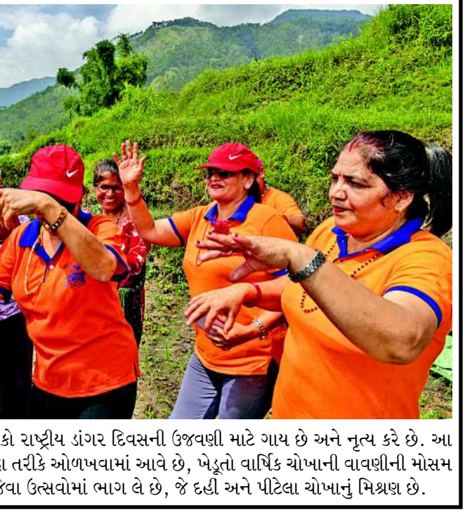
નેપાળના કાઠમંડુના ટોપામાં લોકો રાષ્ટ્રીય ડાંગર દિવસની ઉજવણી માટે ગાય છે અને નૃત્ય કરે છે. આ દિવસે, જેને સ્થાનિક રીતે અસર પાંદરા તરીકે ઓળખવામાં આવે છે, ખેડૂતો વાર્ષિક ચોખાની વાવણીની મોસમ શરૂ કરે છે અને દહીં ચિઉરા ખાવા જેવા ઉત્સવોમાં ભાગ લે છે, જે દહીં અને પીટલા ચોખાનું મિશ્રણ છે.

કરવાના હવાલિયાં મારી રહ્યું છે, જે જોતાં ભારતની આ વ્યૂહાત્મક ચાલ ખૂબ જ મહત્વપૂર્ણ બની રહેશે. હાથે ના ગ્રે લિસ્ટમાં સામેલ દેશો પર આંતરરાષ્ટ્રીય સ્તરે ખાસ અને કડક દેખરેખ રાખવામાં આવે છે. આવા દેશોએ મની લોન્ડરિંગ અને આતંકવાદી ફંડિંગ રોકવા માટે નિર્ધારિત સમયમર્યાદામાં સુધારા કરવા પડે છે. જો કોઈ દેશ આ નિયમોનું પાલન ન કરે, તો તેના પર વૈશ્વિક આર્થિક પ્રતિબંધો અને આંતરરાષ્ટ્રીય સ્તરેથી મળતી લોન અટકી જવાનું મોટું જોખમ ઊભું થાય છે, જેનાથી પાકિસ્તાનની કંઠાળ આર્થિક સ્થિતિ વધુ બગડી શકે છે.