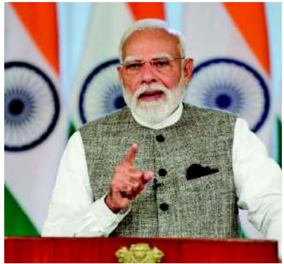
પણ સાથે મળીને કામ કરશે. મોદીની મુલાકાત દરમિયાન, ભારતે સેશેલ્સને એક ઝડપી પેટ્રોલ જહાજ ભેટમાં આપ્યું. આ ઉપરાંત, ૧૦ યુટિલિટી વાહનો અને લેસર રેડિયલ ક્લાસ બોટના પાંચ સેટ પણ સેશેલ્સ સંરક્ષણ દળને સોંપવામાં આવ્યા હતા. સેશેલ્સ કોસ્ટ ગાર્ડ માટે પીએસ

બંને દેશો ભવિષ્યના ક્ષેત્રોમાં પણ સાથે મળીને કામ કરશે, વડાપ્રધાન મોદીની સેશેલ્સની ત્રણ દિવસની મુલાકાત ઘણી રીતે ઐતિહાસિક હતી નવીદિલ્હી, વડાપ્રધાન નરેન્દ્ર મોદીએ તેમની ત્રણ દિવસીય સેશેલ્સ મુલાકાતના છેલ્લા દિવસે ભારતીય સમુદાયના સભ્યો સાથે મુલાકાત કરી, બંને દેશો વચ્ચેના સાંસ્કૃતિક અને ઐતિહાસિક સંબંધોને મજબૂત બનાવ્યા. પીએમ મોદીએ રાજધાની વિક્ટોરિયામાં ભારતીય ડાયસ્પોરા સાથે વાતચીત કરી, તેમની સાથે ફોટોગ્રાફ્સ પડાવ્યા અને ભારતીય સમુદાયના યોગદાનની પ્રશંસા કરી. તેમણે અરુલ મિહુ નવશક્તિ વિનાયક ઘરો અને દુકાનો બંધી ગઈ હતી. હલ્દિયા-પાંસકુરા રેલ સેવાઓ પણ ખોરવાઈ ગઈ છે. પાઈપલાઈનમાં આગ લાગવાનું કારણ હજુ સુધી જાણી શકાયું નથી. અકસ્માતનું કારણ તપાસ હેઠળ છે. આરોગ્ય, ઉર્જા અને વાદળી અર્થતંત્ર સહિત ૧૯ મુખ્ય ક્ષેત્રોમાં સહયોગને નવી ગતિ મળી. વડાપ્રધાન નરેન્દ્ર મોદીની મુલાકાત ભારતની હિંદ મહાસાગર નીતિ અને વૈશ્વિક રાજદ્વારી માટે અત્યંત મહત્વપૂર્ણ માનવામાં આવે છે. મુલાકાત દરમિયાન, બંને દેશોએ અનેક મહત્વપૂર્ણ કરારો પર હસ્તાક્ષર કર્યાં. આમાં સેશેલ્સમાં યુપીઆઈ-આધારિત ડિજિટલ યુકવણી પ્રણાલી લાગુ કરવી, જન ઔષધિ યોજનાનો વિસ્તાર કરવો અને આબોહવા પરિવર્તન, ગ્રીન હાઈડ્રોજન, વાદળી અર્થતંત્ર અને ઉર્જા ક્ષેત્ર સામે લડવામાં સહયોગ વધારવા માટે સંમતિ દર્શાવવામાં આવી છે. વડા પ્રધાન મોદીએ સોશિયલ મીડિયા પ્લેટફોર્મ એક્સ પર જણાવ્યું હતું કે સેશેલ્સની મુલાકાતના સકારાત્મક પરિણામો આવ્યા છે અને બંને દેશો ભવિષ્યના ક્ષેત્રોમાં