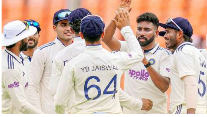
હારનો સામનો કરવો પડ્યો છે, જેના કારણે તે આઠમા સ્થાને છે. બીજી તરફ, શ્રીલંકાને વર્તમાન ઉંચકમાં પ્રથમ હારનો સામનો કરવો પડ્યો. ટીમે અત્યાર સુધીમાં ત્રણ ટેસ્ટ રમી છે, જેમાં એક જીત, એક ડ્રો અને એક હારનો સમાવેશ થાય છે. આ કારમી હાર પછી, તેના પોઈન્ટ ટકાવારી ઘટીને ૪૪.૪૪ થઈ ગઈ, અને તે ત્રીજા સ્થાનેથી છઠ્ઠા સ્થાને સરકી ગઈ. શ્રીલંકાના પતનથી ભારતને સૌથી વધુ ફાયદો થયો છે. ભારતીય ટીમ હવે ૪૮.૧૫ ના પીસીટી સાથે પાંચમા સ્થાને પહોંચી ગઈ છે. જોકે, ફાઇનલની દોડમાં પોતાનું સ્થાન

નવીદિલ્હી, વર્લ્ડ ટેસ્ટ ચેમ્પિયનશિપ (ડબ્લ્યુટીસી ૨૦૨૫-૨૭) પોઈન્ટ ટેબલમાં નોંધપાત્ર ફેરફાર જોવા મળ્યો છે. વેસ્ટ ઈન્ડિઝ પ્રથમ ટેસ્ટમાં શ્રીલંકાને એક મોટા દાવ અને ૨૧૭ રનથી હરાવીને માત્ર પોતાની પ્રથમ જીત નોંધાવી નથી, પરંતુ ટીમ ઈન્ડિયાને પણ એક નોંધપાત્ર ફાયદો કરાવ્યો છે. વેસ્ટ ઈન્ડિઝની જીતથી ટીમ ઈન્ડિયા એક સ્થાન ઉપર આવી ગઈ છે. દરમિયાન, પ્રથમ ટેસ્ટમાં કારમી હાર બાદ શ્રીલંકા પોઈન્ટ ટેબલમાં નોંધપાત્ર રીતે નીચે આવી ગયું છે.