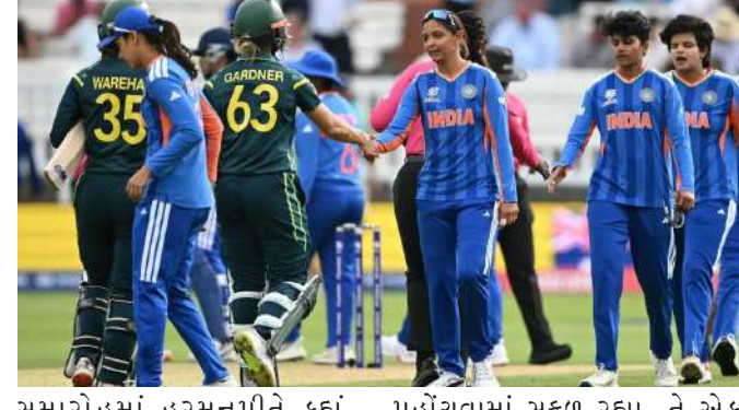
સમારોહમાં હરમનપ્રીતે કહ્યું, "દિવસના અંતે, અમારો સ્કોર સારો હતો. જ્યારે હું બેટિંગ કરી રહી હતી, ત્યારે મને લાગ્યું કે અમે થોડા ઓછા છીએ, પરંતુ છેલ્લી કેટલીક ઓવરોમાં ઝડપથી સ્કોર કરીને, અમે સારા સ્કોર સુધી પહોંચવામાં સફળ રહ્યા. તે એક સારી મેચ હતી, પરંતુ કમનસીબે, અમે જીતી શક્યા નહીં. કેચ છોડવાથી અમને ખૂબ જ નુકસાન થયું, પરંતુ મને હજુ પણ લાગે છે કે અમે આજ મેચમાં હતા." ટુર્નામેન્ટ દરમિયાન ટીમ

મુંબઈ, ટીમ ઈન્ડિયાને આઈસીસી મહિલા ટી ૨૦ વર્લ્ડ કપ ૨૦૨૬ ના તેમના અંતિમ ગ્રુપ સ્ટેજ મેચમાં ઓસ્ટ્રેલિયા સામે ૬ વિકેટથી હારનો સામનો કરવો પડ્યો હતો. આ સાથે, ભારતીય ટીમ ટી ૨૦ વર્લ્ડ કપ ૨૦૨૬ માંથી બહાર થઈ ગઈ છે. ટીમ ઈન્ડિયાની કેપ્ટન હરમનપ્રીત કૌર આ હારથી સમજ શકાય તેવી રીતે નાપુશ હતી. મેચ પછી, તેણે સમજાવ્યું કે ટીમ ઈન્ડિયા ઓસ્ટ્રેલિયા સામે કેમ હારી ગઈ. તેણીએ આ વર્લ્ડ કપમાં ટીમ ઈન્ડિયાના પ્રદર્શન અંગે પણ ચર્ચા કરી. મેચ પછીના પ્રેસન્ટેશન