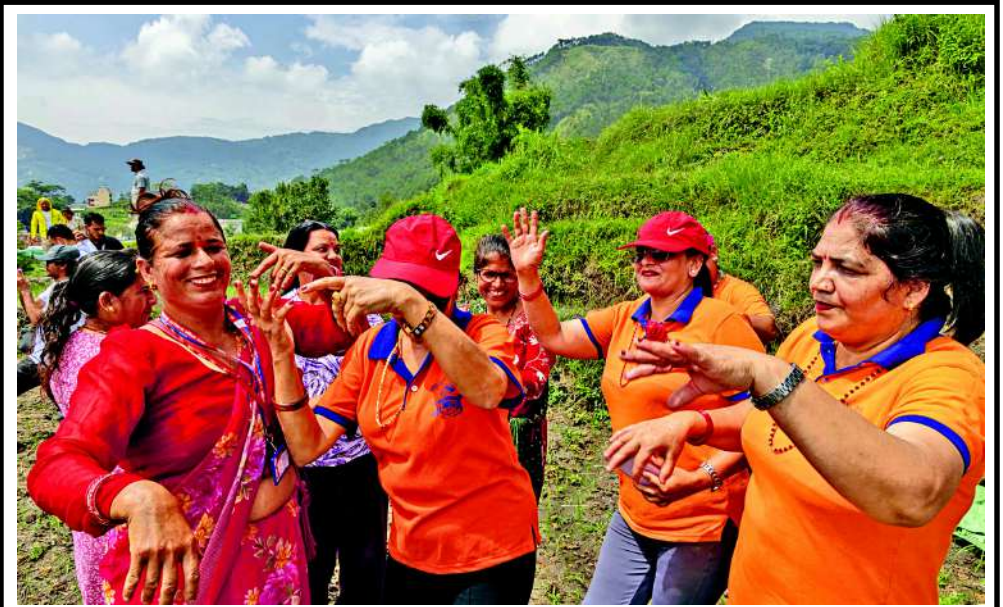
નેપાળના કાઠમંડુના ટોપામાં લોકો રાષ્ટ્રીય ડાંગર દિવસની ઉજવણી માટે ગાય છે અને નૃત્ય કરે છે. આ દિવસે, જેને સ્થાનિક રીતે અસર પાંદરા તરીકે ઓળખવામાં આવે છે, ખેડૂતો વાર્ષિક ચોખાની વાવણીની મોસમ શરૂ કરે છે અને દહીં ચિઉરા ખાવા જેવા ઉત્સવોમાં ભાગ લે છે, જે દહીં અને પીટલા ચોખાનું મિશ્રણ છે.

કરવાના હવાલિયાં મારી રહ્યું છે, જે જોતાં ભારતની આ વ્યૂહાત્મક ચાલ ખૂબ જ મહત્વપૂર્ણ બની રહેશે. હૃદય ના ગ્રે લિસ્ટમાં સામેલ દેશો પર આંતરરાષ્ટ્રીય સ્તરે ખાસ અને કડક દેખરેખ રાખવામાં આવે છે. આવા દેશોએ મની લોન્ડરિંગ અને આતંકવાદી ફંડિંગ રોકવા માટે નિર્ધારિત સમયમર્યાદામાં સુધારા કરવા પડે છે. જો કોઈ દેશ આ નિયમોનું પાલન ન કરે, તો તેના પર વૈશ્વિક આર્થિક પ્રતિબંધો અને આંતરરાષ્ટ્રીય સ્તરેથી મળતી લોન અટકી જવાનું મોટું જોખમ ઊભું થાય છે, જેનાથી પાકિસ્તાનની કંઠાળ આર્થિક સ્થિતિ વધુ બગડી શકે છે.