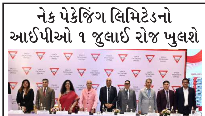
નેક પેકેજિંગ લિમિટેડ નો ઈચ્યૂ ૧ જુલાઈ ના રોજ ખુલી રહ્યો છે. ઓફર ની પ્રાઈઝ બેન્ડ ઈકવિટી શેર દ્રીટ રૂ ૧૬૧થી રૂ ૧૭૦ રાખવામાં આવી છે. બીડ અરજી ૮૮ ઈકવિટી શેર અને ત્યારબાદ ૮૮ ઈકવિટી શેર ના ગુણક માં કરી શકાશે. ઈચ્યૂ ૧ જુલાઈ રોજ ખુલશે અને ૧ જુલાઈ ના રોજ બંધ થશે.

આયોજન કર્યું હતું. આ રેલીમાં પ્રતિનિધિઓએ ઉત્સાહપૂર્વક ભાગ લીધો હતો, ડ્રગ મુક્ત સમાજના અને વિવિધ રાજ્યોના નિર્માણનો સંદેશ ફેલાવ્યો હતો. નેક પેકેજિંગ લિમિટેડનો આઈપીઓ ૧ જુલાઈ રોજ ખુલશે