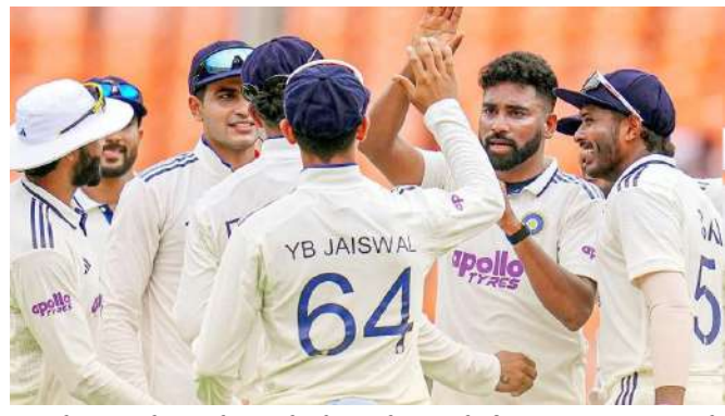
હારનો સામનો કરવો પડ્યો છે, જેના કારણે તે આઠમા સ્થાને છે. બીજી તરફ, શ્રીલંકાને વર્તમાન ઉગ્ર ચક્રમાં પ્રથમ હારનો સામનો કરવો પડ્યો. ટીમે અત્યાર સુધીમાં ત્રણ ટેસ્ટ રમી છે, જેમાં એક જીત, એક ડ્રો અને એક હારનો સમાવેશ થાય છે. આ કારમી હાર પછી, તેના પોઈન્ટ ટકાવારી ઘટીને ૪૪.૪૪ થઈ ગઈ, અને તે ત્રીજા સ્થાનેથી છઠ્ઠા સ્થાને સરકી ગઈ. શ્રીલંકાના પતનથી ભારતને સૌથી વધુ ફાયદો થયો છે. ભારતીય ટીમ હવે ૪૮.૧૫ ના પીસીટી સાથે પાંચમા સ્થાને પહોંચી ગઈ છે. જોકે, ફાઇનલની દોડમાં પોતાનું સ્થાન

મેચમાં યજમાન વેસ્ટ ઈન્ડિઝે દરેક વિભાગમાં શાનદાર પ્રદર્શન કર્યું. પ્રથમ ઈનિંગમાં ૩૧૮ રનની લીડ મેળવ્યા બાદ, કેરેબિયન બોલરોએ શ્રીલંકાને બીજા ઈનિંગમાં માત્ર ૧૦૧ રનમાં ઓલઆઉટ કરી દીધું, મેચ એક ઈનિંગ અને ૨૧૭ રનથી જીતી લીધી. અનુભવી ઝડપી બોલર કેમાર રોચે વેસ્ટ ઈન્ડિઝની જીતમાં મુખ્ય ભૂમિકા ભજવી હતી. તેણે બીજા ઈનિંગમાં ૧૧ ઓવરમાં ૫૧ રન આપીને ચાર વિકેટ લીધી, જ્યારે જેડન સીલ્સે ત્રણ બેટ્સમેનોને આઉટ કરીને વિજય પર મહોર લગાવી. ઉગ્ર ૨૦૨૫-૨૭ ચક્રમાં વેસ્ટ ઈન્ડિઝની આ પહેલી જીત છે. ટીમે અત્યાર સુધીમાં નવ મેચ રમી છે, જેમાં એક જીત, એક ડ્રો અને એક હારનો સમાવેશ થાય છે. આ કારમી હાર પછી,