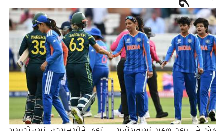
સમારોહમાં હરમનપ્રીતે કહ્યું, "દિવસના અંતે, અમારો સ્કોર સારો હતો. જ્યારે હું બેટિંગ કરી રહી હતી, ત્યારે મને લાગ્યું કે અમે થોડા ઓછા છીએ, પરંતુ છેલ્લી કેટલીક ઓવરોમાં ઝડપથી સ્કોર કરીને, અમે સારા સ્કોર સુધી પહોંચવામાં સફળ રહ્યા. તે એક સારી મેચ હતી, પરંતુ કમનસીબે, અમે જીતી શક્યા નહીં. કેચ છોડવાથી અમને ખૂબ જ નુકસાન થયું, પરંતુ મને હજુ પણ લાગે છે કે અમે આજ મેચમાં હતા." ટુર્નામેન્ટ દરમિયાન ટીમ

મુંબઈ, ટીમ ઈન્ડિયાને આઈસીસી મહિલા ટી ૨૦ વર્લ્ડ કપ ૨૦૨૬ ના તેમના અંતિમ ગ્રુપ સ્ટેજ મેચમાં ઓસ્ટ્રેલિયા સામે ૬ વિકેટથી હારનો સામનો કરવો પડ્યો હતો. આ સાથે, ભારતીય ટીમ ટી ૨૦ વર્લ્ડ કપ ૨૦૨૬ માંથી બહાર થઈ ગઈ છે. ટીમ ઈન્ડિયાની કેપ્ટન હરમનપ્રીત કૌર આ હારથી સમજ શકાય તેવી રીતે નાપુશ હતી. મેચ પછી, તેણે સમજાવ્યું કે ટીમ ઈન્ડિયા ઓસ્ટ્રેલિયા સામે કેમ હારી ગઈ. તેણીએ આ વર્લ્ડ કપમાં ટીમ ઈન્ડિયાના પ્રદર્શન અંગે પણ ચર્ચા કરી. મેચ પછીના પ્રેસન્ટેશન