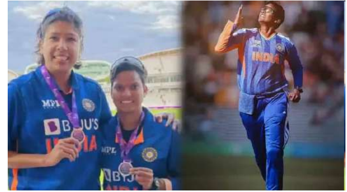
૫૧ વનડેમાં ૧૭૦ અને ટી ૨૦ માં ૧૧૪ વિકેટ લીધી છે. ઓસ્ટ્રેલિયાની ટિગ્ગજ ઓલરાઉન્ડર એલિસ પેરી આંતરરાષ્ટ્રીય ક્રિકેટમાં સૌથી વધુ વિકેટ લેનાર બોલરોમાં ત્રીજા ક્રમે છે. એલિસ પેરીએ ૩૬૨ મેચોમાં કુલ ૩૩૬ વિકેટ લીધી છે. આમાં ૩૮ ટેસ્ટ વિકેટ, ૧૬૬ વનડે વિકેટ અને ૧૩૨ ટી ૨૦ વિકેટનો સમાવેશ થાય છે. ઘણા વર્ષોથી, ભારતની ટિગ્ગજ ઝડપી બોલર સુલન ગોસ્વામી મહિલા આંતરરાષ્ટ્રીય ક્રિકેટમાં સૌથી વધુ વિકેટનો વિશ્વ રેકોર્ડ ધરાવે છે. સુલને ૨૮૪ મેચોમાં ૩૫૫ વિકેટ લીધી હતી. તેણીએ ટેસ્ટમાં ૪૪, વનડેમાં ૨૫૫ અને ટી ૨૦માં ૫૬ વિકેટ લઈને આ સિદ્ધિ હાંસલ કરી હતી.

મુંબઈ, આંતરરાષ્ટ્રીય ક્રિકેટમાં ઘણી મહિલા બોલરો છે, પરંતુ ત્રણેય ફોર્મેટમાં કુલ ૩૫૦ થી વધુ વિકેટ લેવામાં સફળ રહી છે. રસપ્રદ વાત એ છે કે, બંને ભારતીય બોલર છે. ઈંગ્લેન્ડની કેથરિન સાયવર-બ્રન્ટ આંતરરાષ્ટ્રીય ક્રિકેટમાં સૌથી વધુ વિકેટ લેનાર બોલરોમાં ચોથા ક્રમે છે. કેથરિનએ ૨૬૭ આંતરરાષ્ટ્રીય મેચોમાં કુલ ૩૩૫ વિકેટ લીધી છે. તેણીએ ટેસ્ટમાં ૫૧ વનડેમાં ૧૭૦ અને ટી ૨૦ માં ૧૧૪ વિકેટ લીધી છે. ઈંગ્લેન્ડની કેથરિન સાયવર-બ્રન્ટ આંતરરાષ્ટ્રીય ક્રિકેટમાં સૌથી વધુ વિકેટ લેનાર બોલરોમાં ચોથા ક્રમે છે. કેથરિનએ ૨૬૭ આંતરરાષ્ટ્રીય મેચોમાં કુલ ૩૩૫ વિકેટ લીધી છે. તેણીએ ટેસ્ટમાં