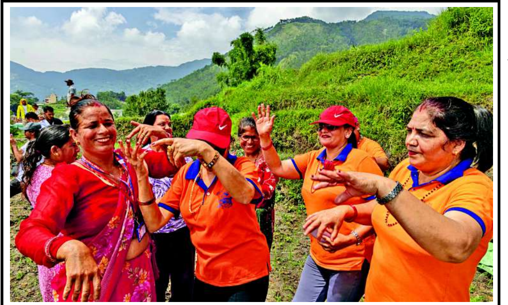
નેપાળના કાઠમંડુના ટોપામાં લોકો રાષ્ટ્રીય ડાંગર દિવસની ઉજવણી માટે ગાય છે અને નૃત્ય કરે છે. આ દિવસે, જેને સ્થાનિક રીતે અસર પાંદરા તરીકે ઓળખવામાં આવે છે, ખેડૂતો વાર્ષિક ચોખાની વાવણીની મોસમ શરૂ કરે છે અને દહીં ચિઉરા ખાવા જેવા ઉત્સવોમાં ભાગ લે છે, જે દહીં અને પીટલા ચોખાનું મિશ્રણ છે.

હૃદયના ના ગ્રે લિસ્ટમાં સામેલ દેશો પર આંતરરાષ્ટ્રીય સ્તરે ખાસ અને કડક દેખરેખ રાખવામાં આવે છે. આવા દેશોએ મની લોન્ડરિંગ અને આતંકવાદી ફંડિંગ રોકવા માટે નિર્ધારિત સમયમર્યાદામાં સુધારા કરવા પડે છે. જો કોઈ દેશ આ નિયમોનું પાલન ન કરે, તો તેના પર વૈશ્વિક આર્થિક પ્રતિબંધો અને આંતરરાષ્ટ્રીય સ્તરેથી મળતી લોન અટકી જવાનું મોટું જોખમ ઊભું થાય છે, જેનાથી પાકિસ્તાનની કંઠાળ આર્થિક સ્થિતિ વધુ બગડી શકે છે.