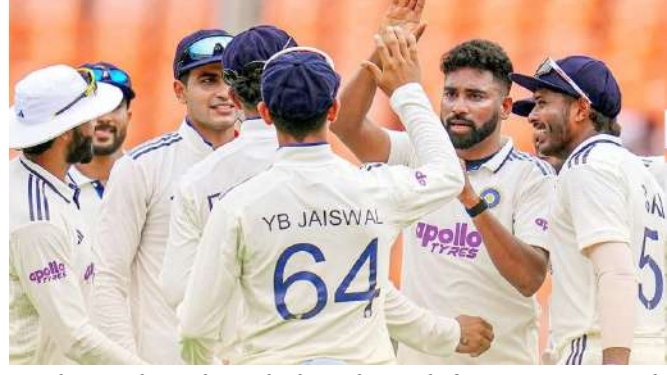
હારનો સામનો કરવો પડ્યો છે, જેના કારણે તે આઠમા સ્થાને છે. બીજી તરફ, શ્રીલંકાને વર્તમાન ઉચ્ચ ચક્રમાં પ્રથમ હારનો સામનો કરવો પડ્યો. ટીમે અત્યાર સુધીમાં ત્રણ ટેસ્ટ રમી છે, જેમાં એક જીત, એક ડ્રો અને એક હારનો સમાવેશ થાય છે. આ કારમી હાર પછી, તેના પોઈન્ટ ટકાવારી ઘટીને ૪૪.૪૪ થઈ ગઈ, અને તે ત્રીજા સ્થાનેથી છઠ્ઠા સ્થાને સરકી ગઈ. શ્રીલંકાના પતનથી ભારતને સૌથી વધુ ફાયદો થયો છે. ભારતીય ટીમ હવે ૪૮.૧૫ ના પીસીટી સાથે પાંચમા સ્થાને પહોંચી ગઈ છે. જોકે, ફાઇનલની દોડમાં પોતાનું સ્થાન

મેચમાં યજમાન વેસ્ટ ઈન્ડિઝે દરેક વિભાગમાં શાનદાર પ્રદર્શન કર્યું. પ્રથમ ઈનિંગમાં ૩૧૮ રનની લીડ મેળવ્યા બાદ, કેરેબિયન બોલરોએ શ્રીલંકાને બીજા ઈનિંગમાં માત્ર ૧૦૧ રનમાં ઓલઆઉટ કરી દીધું, મેચ એક ઈનિંગ અને ૨૧૭ રનથી જીતી લીધી. અનુભવી ઝડપી બોલર કેમાર રોચે વેસ્ટ ઈન્ડિઝની જીતમાં મુખ્ય ભૂમિકા ભજવી હતી. તેણે બીજા ઈનિંગમાં ૧૧ ઓવરમાં ૫૧ રન આપીને ચાર વિકેટ લીધી, જ્યારે જેડન સીલ્સે ત્રણ બેટ્સમેનોને આઉટ કરીને વિજય પર મહોર લગાવી. ઉચ્ચ ૨૦૨૫-૨૭ ચક્રમાં વેસ્ટ ઈન્ડિઝની આ પહેલી જીત છે. ટીમે અત્યાર સુધીમાં નવ મેચ રમી છે, જેમાં એક જીત, એક ડ્રો અને એક હારનો સમાવેશ થાય છે. આ કારમી હાર પછી,