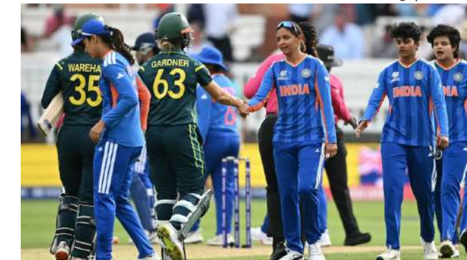
સમારોહમાં હરમનપ્રીતે કહ્યું, "દિવસના અંતે, અમારો સ્કોર સારો હતો. જ્યારે હું બેટિંગ કરી રહી હતી, ત્યારે મને લાગ્યું કે અમે થોડા ઓછા છીએ, પરંતુ છેલ્લી કેટલીક ઓવરોમાં ઝડપથી સ્કોર કરીને, અમે સારા સ્કોર સુધી પહોંચવામાં સફળ રહ્યા. તે એક સારી મેચ હતી, પરંતુ કમનસીબે, અમે જીતી શક્યા નહીં. કેચ છોડવાથી અમને ખૂબ જ નુકસાન થયું, પરંતુ મને હજુ પણ લાગે છે કે અમે આજ મેચમાં હતા." ટુર્નામેન્ટ દરમિયાન ટીમ

મુંબઈ, ટીમ ઈન્ડિયાને આઈસીસી મહિલા ટી ૨૦ વર્લ્ડ કપ ૨૦૨૬ ના તેમના અંતિમ ગ્રુપ સ્ટેજ મેચમાં ઓસ્ટ્રેલિયા સામે ૬ વિકેટથી હારનો સામનો કરવો પડ્યો હતો. આ સાથે, ભારતીય ટીમ ટી ૨૦ વર્લ્ડ કપ ૨૦૨૬ માંથી બહાર થઈ ગઈ છે. ટીમ ઈન્ડિયાની કેપ્ટન હરમનપ્રીત કૌર આ હારથી સમજ શકાય તેવી રીતે નાપુશ હતી. મેચ પછી, તેણે સમજાવ્યું કે ટીમ ઈન્ડિયા ઓસ્ટ્રેલિયા સામે કેમ હારી ગઈ. તેણીએ આ વર્લ્ડ કપમાં ટીમ ઈન્ડિયાના પ્રદર્શન અંગે પણ ચર્ચા કરી. મેચ પછીના પ્રેસન્ટેશન