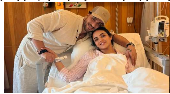
અભિનેતા અલી ગોનીએ હોસ્પિટલમાં જાસ્મિન સાથે તેમને દર્શાવતા ઘણા ફોટા શેર કર્યા. એક ફોટામાં, તે હોસ્પિટલના પલંગ પર પડેલા જાસ્મિનને ગળે લગાવતો જોવા મળે છે, જ્યારે બીજા ફોટામાં, અભિનેત્રી સ્થિતિ જોઈને તેના ચાહકો ચિંતિત છે.

મુંબઈ, જાસ્મીન ભસીનને દુબઈની યાત્રા દરમિયાન હોસ્પિટલમાં દાખલ કરવામાં આવ્યા ત્યારે તેના જન્મદિવસની ઉજવણી અચાનક બદલાઈ ગઈ. તેના બોયફ્રેન્ડ, અભિનેતા અલી ગોનીએ સોશિયલ મીડિયા પર સમાચાર શેર કર્યા, તેણીને જન્મદિવસની શુભેચ્છા પાઠવી. શુભેચ્છાઓ મોકલવામાં આવી અને જાહેરાત કરવામાં આવી કે આ દંપતી હોસ્પિટલમાં તેમની રજાઓ માળી રહ્યું છે. અલીએ સોશિયલ મીડિયા પર અભિનેત્રી સાથે હોસ્પિટલના જાસ્મિન સાથેના કેટલાક ફોટા શેર કર્યા. સ્વાસ્થ્ય અપડેટ્સ પણ આપ્યા. જાસ્મિન ભસીનની સ્થિતિ જોઈને તેના ચાહકો ચિંતિત છે.