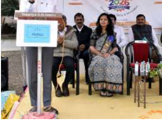
જણાવ્યું હતું કે, વડાપ્રધાનશ્રી નરેન્દ્રભાઈ મોદીના આહ્વાનના પગલે દેશભરમાં 'સ્કિલ ઈન્ડિયા' મિશન અંતર્ગત યુવાનોને રોજગારલક્ષી કૌશલ્ય આપવામાં આવી રહ્યું છે. આઈ.ટી.આઈ. જેવી સંસ્થાઓ યુવાનોને આત્મનિર્ભર બનાવવામાં મહત્વની ભૂમિકા ભજવી રહી છે. તાલીમાર્થીઓ ઉદ્યોગોની જરૂરિયાત મુજબ કૌશલ્ય મેળવીને સ્વરોજગાર કે રોજગારની તકો મેળવી શકે તે દિશામાં રાજ્ય સરકાર સતત પ્રયત્નશીલ છે. તેમણે યુવાનોને પ્રેરણા પુરી

અમરેલી: કાયદો તથા ઊર્જા રાજ્યમંત્રીશ્રી કૌશિકભાઈ વેકરીયાના અધ્યક્ષ સ્થાને અમરેલીની સરકારી ઔદ્યોગિક તાલીમ સંસ્થા ખાતે સ્કિલ એકસ્પોનું ભવ્ય આયોજન કરવામાં આવ્યું હતું. આ એકસ્પોનો ઉદ્દેશ આઈ.ટી.આઈ.ના ૨૨ તાલીમાર્થીઓમાં ઉદ્યોગોની જરૂરિયાત અનુસાર કૌશલ્ય વિકાસને પ્રોત્સાહન આપવાનો રહ્યો હતો. અમરેલી ITI ખાતે યોજાયેલા આ સ્કિલ એકસ્પોમાં સંસ્થાના જુદા જુદા ૨૨ ટ્રેડના વિદ્યાર્થીઓ દ્વારા ૮૦થી વધુ વર્કિંગ મોડલ તૈયાર કરી પ્રદર્શિત કરવામાં આવ્યા હતા. તાલીમાર્થીઓએ પોતાની ટેકનિકલ કુશળતા, નવીન વિચારો અને વ્યવહારુ જ્ઞાનનો સુંદર પરિચય આપ્યો હતો, જેને ઉપસ્થિત મહેમાનો અને પ્રાધ્યાપકોએ વખાણ્યો હતો. આ પ્રસંગે રાજ્યમંત્રીશ્રીએ