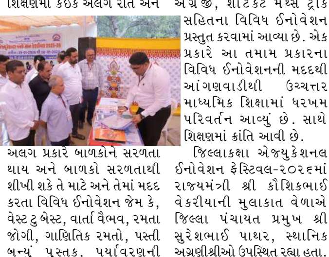
જાળવણી, પ્રવૃત્તિથી પ્રગતિ, ઈઝી અંગ્રેજી, શોર્ટકટ મેથ્સ ટ્રીક સહિતના વિવિધ ઈનોવેશન પ્રસ્તુત કરવામાં આવ્યા છે. એક પ્રકારે આ તમામ પ્રકારના વિવિધ ઈનોવેશનની મદદથી આંગણવાડીથી ઉચ્ચતર માધ્યમિક શિક્ષામાં ધરબમ પરિવર્તન આવ્યું છે. સાથે શિક્ષણમાં ક્રાંતિ આવી છે. એજ્યુકેશનલ ઈનોવેશન ફેસ્ટિવલ-૨૦૨૬માં રાજ્યમંત્રી શ્રી કૌશિકભાઈ વેકરીયાની મુલાકાત વેળાએ જિલ્લા પંચાયત પ્રમુખ શ્રી સુરેશભાઈ પાથર, સ્થાનિક અગ્રણીશ્રીઓ ઉપસ્થિત રહ્યા હતા.

અમરેલી: અમરેલી ખાતે ઉર્જા રાજ્યમંત્રી શ્રી કૌશિકભાઈ વેકરીયાએ જિલ્લા શિક્ષણ અને તાલીમ ભવન ખાતે આયોજિત જિલ્લાકક્ષા એજ્યુકેશનલ ઈનોવેશન ફેસ્ટિવલ-૨૦૨૬માં મુલાકાત લીધી હતી. ઉલ્લેખનીય છે કે, એજ્યુકેશનલ ઈનોવેશન ફેસ્ટિવલમાં જિલ્લાના ઉત્કૃષ્ટ અને શ્રેષ્ઠ શિક્ષકોએ પોતાના વિવિધ યુનિક ઈનોવેશનને પ્રદર્શિત કર્યા હતા. આ ઈનોવેશનનું મદદથી આંગણવાડીથી ઉચ્ચતર માધ્યમિક શાળામાં લેનિંગ સરળ બન્યું છે.