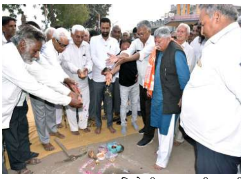
અમરેલીના જાળીયા-કેરાળા-હડાલા રોડ પર સ્ટ્રક્ચર નિર્માણ કામગીરીનું પણ ખાતમુહૂર્ત કરવામાં આવ્યું હતું.

અમરેલી: અમરેલીના જાળીયા અને રાંઢીયા મુકામે ઉર્જા રાજ્યમંત્રી શ્રી કૌશિકભાઈ વેકરીયાના હસ્તે વિવિધ વિકાસકાર્યોનું ખાતમુહૂર્ત કરવામાં આવ્યું હતું. જાળીયા મુકામે અંદાજે રૂ. ૨ કરોડથી વધુના ખર્ચે સુવિધાપથ (સી.સી.રોડ) બનશે, રૂ. ૨૫ લાખના ખર્ચે ગ્રામ પંચાયતનું નવું ભવન આકાર પામશે. અંદાજિત રૂ. ૬.૫ કરોડના ખર્ચે જાળીયા-કેરાળા-હડાલા રોડ પર સ્ટ્રક્ચર નિર્માણ કામગીરીનું પણ ખાતમુહૂર્ત કરવામાં આવ્યું હતું. જાળીયા મુકામે વિવિધ વિકાસકાર્યોનું ખાતમુહૂર્ત કરવામાં