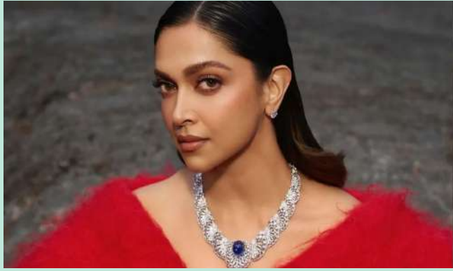
AA22xA6 દીપિકા પાદુકોણ અને અલુ અર્જુન પહેલી વખત ઓન-સ્ક્રીન જોડી જમાવતા જોવા મળશે

મુંબઈ, અટલીની આગામી તેલુગુ સાયન્સ ફિક્શન ફિલ્મમાં અલુ અર્જુન સાથે દીપિકા પાદુકોણ પહેલીવાર મોટા પડદા પર જોવા મળશે. ત્યારે ફિલ્મમેકર અટલીએ ફરી એકવાર દીપિકા પાદુકોણ પ્રત્યે પોતાનો આદર વ્યક્ત કર્યો છે. અલુ અર્જુન સાથેની તેની મહાવાકાંક્ષી તેલુગુ પેન-ઈન્ડિયા ફિલ્મ AA22xA6માં દીપિકા જોડાઈ હોવાનું જાહેર થયા બાદ અટલીએ જણાવ્યું કે દીપિકા પાદુકોણ તેના માટે ડેબીયુ ચાર્મી સમાન છે. અગાઉ અટલીએ દીપિકા અને શાહરુખ સાથે જવાન ફિલ્મમાં કામ કર્યું હતું. આ ફિલ્મની સફળતા બાદ ફરી દીપિકા સાથે કામ કરતા અટલીએ