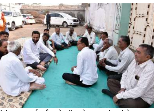
રાંઢીયા મુકામે વિવિધ વિકાસકાર્યોનું ખાતમુહૂર્ત કરવામાં આવ્યું હતું.