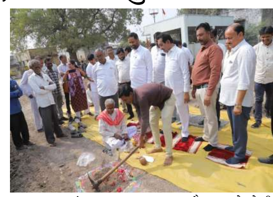
તમામ ગામમાં શાળાના નવા ભવન તૈયાર થશે જેની કામગીરી પ્રગતિત છે. માર્ગ મકાન વિભાગ રાજ્ય અને પંચાયત હસ્તકના તમામ રોડના કામ ચોમાસા પહેલા પૂર્ણ કરવામાં આવે તેવી નેમ છે. અમરેલી વિધાનસભા મતવિસ્તારની તમામ આંગણવાડીને મોડેલ આંગણવાડી બનાવવા માટે આયોજન કરવામાં આવી રહ્યું છે. વિકાસકાર્યોની વણગારમાં રાજ્ય સરકાર ઉદાર હાથે અમરેલીને વિકાસકાર્યોની ભેટ આપી રહી છે. કૃષિકારોને સંબોધતા મંત્રીશ્રીએ ઉમેર્યું કે, અમરેલી વિધાનસભા મતવિસ્તારના ખેડૂતોને રાજ્ય સરકારના બે

અમરેલી: ગુજરાત રાજ્યના મુખ્યમંત્રીશ્રી ભૂપેન્દ્રભાઈ પટેલની ગરિમામય વચ્ચુંવલ ઉપસ્થિતિમાં અમરેલી જિલ્લાની કુલ ૧૯૪ ગ્રામ પંચાયતોના નવા મકાનના નિર્માણ માટે ઈ-ખાતમુહૂર્ત કાર્યક્રમ યોજાયો હતો. આ પ્રસંગે અમરેલી જિલ્લાના સહાયવદર ખાતે ઊર્જા અને કાયદો રાજ્ય મંત્રીશ્રી કૌશિકભાઈ વેકરીયાના અધ્યક્ષ સ્થાને કાર્યક્રમ યોજાયો હતો. કાર્યક્રમને સંબોધતા રાજ્ય મંત્રીશ્રી કૌશિકભાઈ વેકરીયાએ જણાવ્યું હતું કે, રાજ્ય સરકાર દ્વારા મુખ્યમંત્રીશ્રી ભૂપેન્દ્રભાઈ પટેલ તેમજ નાયબ મુખ્યમંત્રીશ્રી હર્ષભાઈ સંઘવીના નેતૃત્વમાં ગ્રામ્ય વિસ્તારના સર્વોચ્ચ વિકાસ માટે સતત પ્રયત્નો કરવામાં આવી રહ્યા છે. ગ્રામ પંચાયત મકાનોના નિર્માણથી ગ્રામ સ્વરાજને વધુ મજબૂતી મળશે તેમજ ગ્રામ્ય નાગરિકોને સરકારી સેવાઓ એક જ સ્થળે સરળતાથી ઉપલબ્ધ બનશે. રાજ્ય મંત્રીશ્રીએ વધુમાં જણાવ્યું હતું કે, રૂ. ૪૮ કરોડથી વધુના ખર્ચે અમરેલી જિલ્લાની ૧૯૪ ગ્રામ પંચાયતોને આધુનિક સુવિધાઓથી સજ્જ નવા મકાનો ઉપલબ્ધ બનશે, જે ગ્રામ પંચાયતોની કાર્યક્ષમતામાં વધારો કરશે અને ગ્રામ્ય વહીવટને વધુ પારદર્શક બનાવશે. આગામી સમયમાં અમરેલી વિધાનસભા મતવિસ્તારના