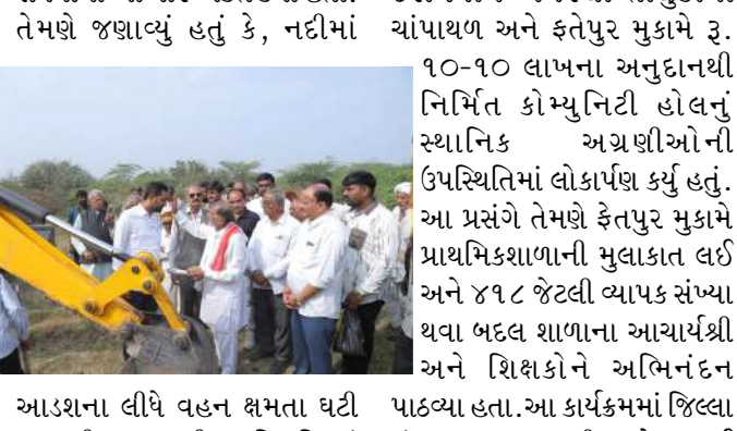
ગાંડાબાવળ સહિતની આડશની સફાઈ કરવામાં આવશે. આ પ્રસંગે નદીના પટમાં રાજ્યમંત્રીશ્રીના હસ્તે કામગીરીનો શુભારંભ કરવામાં આવ્યો હતો. સ્થાનિક અગ્રણીશ્રીઓની ઉપસ્થિતિમાં રાજ્યમંત્રીશ્રીએ ખેડૂતોના વર્ષો જૂના પ્રશ્નનું નિરાકરણ આપતા શુભકામનાઓ પાઠવી મુખ્યમંત્રીશ્રી ભૂપેન્દ્રભાઈ પટેલ નાયબ મુખ્યમંત્રીશ્રી હર્ષભાઈ