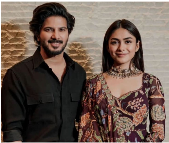
મૃણાલ ઠાકુર અને દુલકિર સલમાનની એક તસવીર વાયરલ થઈ છે. તેના પરથી બને ફરી સાથે કામ કરશે તેવી અટકળ થઈ રહી છે. વાયરલ