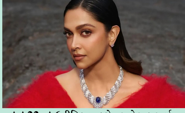
AA22xA6 દીપિકા પાદુકોણ અને અલુ અર્જુન પહેલી વખત ઓન-સ્ક્રીન જોડી જમાવતા જોવા મળશે

મુંબઈ, અટલીની આગામી તેલુગુ સાયન્સ ફિક્શન ફિલ્મમાં અલુ અર્જુન સાથે દીપિકા પાદુકોણ પહેલીવાર મોટા પડદા પર જોવા મળશે. ત્યારે ફિલ્મમેકર અટલીએ ફરી એકવાર દીપિકા પાદુકોણ પ્રત્યે પોતાનો આદર વ્યક્ત કર્યો છે. અલુ અર્જુન સાથેની તેની મહાત્વાકાંક્ષી તેલુગુ પેન-ઈન્ડિયા ફિલ્મ AA22xA6માં દીપિકા જોડાઈ હોવાનું જાહેર થયા બાદ અટલીએ જણાવ્યું કે દીપિકા પાદુકોણ તેના માટે ટેલકી ચાર્મી સમાન છે. અગાઉ અટલીએ દીપિકા અને શાહરુખ સાથે જવાન ફિલ્મમાં કામ કર્યું હતું. આ ફિલ્મની સફળતા બાદ ફરી દીપિકા સાથે કામ કરતા અટલીએ