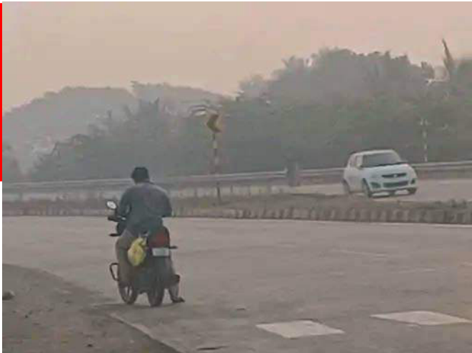
પલ્ટો આવ્યો છે એવકાશમાં વાદળો છવાઈ જવા સાથે ઠંડીનું પ્રમાણ ઘટી જવા પામ્યો છે અને વાતાવરણ પૂંધળું બન્યું છે, સાથે ભેજના

ભાવનગર, તા. ૩૧ ભાવનગરમાં સતત બીજા દિવસે વાદળછાયા વાતાવરણ જોવા મળ્યું હતું, વાદળછાયા વાતાવરણ વચ્ચે શહેરમાં ગાઢ ધુમ્મસ જોવા મળ્યું હતું, જેના કારણે વાહનચાલકો અને રાહદારીઓને મુશ્કેલીનો સામનો કરવો પડ્યો હતો, આજે ૧ ડીગ્રીનો વધારો થતાં ઠંડીનું પ્રમાણ ઘટ્યું હતું, ભાવનગર શહેરમાં સવારથી જ વાદળછાયા વાતાવરણ જોવા મળ્યું હતું અને ગાઢ ધુમ્મસ જોવા મળ્યું હતું, ધુમ્મસ એટલું ગાઢ હતું કે નજીકના અંતરેથી પણ કોઈ પણ વસ્તુ દેખાતી ન હતી, શહેર અને જિલ્લા બંને દિવસથી વાતાવરણમાં પલ્ટો આવ્યો છે એવકાશમાં વાદળો છવાઈ જવા સાથે ઠંડીનું પ્રમાણ ઘટી જવા પામ્યો છે અને વાતાવરણ પૂંધળું બન્યું છે, સાથે ભેજના