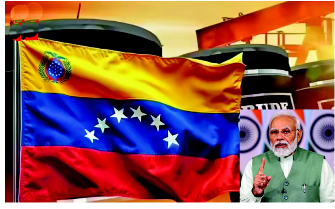
તેલનો સૌથી મોટો ખરીદદાર બનેલ ભારત હવે પોતાના આયાત સ્ત્રોતોમાં ફેરફાર કરી રહ્યું છે. જાન્યુઆરીમાં રશિયા પાસેથી તેલની આયાત જે ૧૨ લાખ બેરલ પ્રતિ દિવસ હતી, તે ફેબ્રુઆરીમાં ઘટીને ૧૦ લાખ

અમેરિકાએ ભારતને વેનેઝુએલા પાસેથી કૂડ ઓઈલ ખરીદવાની મંજૂરી આપવાના સંકેતો આપ્યા છે. ડોનાલ્ડ ટ્રમ્પ હવે વટીવટીતંત્રના આ પહેલ પાછળનો મુખ્ય હેતુ રશિયા પરની નિબંધતા ઘટાડવાનો અને યુકેન યુદ્ધ માટે રશિયાને મળતા ભંડોળને રોકવાનો છે. અમેરિકાએ રશિયાને તેલ પર લાદેલા ભારે ટેરિફને કારણે ભારત હવે રશિયા પાસેથી તેલની આયાતમાં મોટો ઘટાડો કરવા જઈ રહ્યું છે. જો ભારત અમેરિકાની વાત માને તો તેનો સીધો ફાયદો ટેરિફ ડીલ પર થઈ શકે છે. યુકેન યુદ્ધ બાદ રશિયાને તેલનો સૌથી મોટો ખરીદદાર બનેલ ભારત હવે પોતાના આયાત સ્ત્રોતોમાં ફેરફાર કરી રહ્યું છે. જાન્યુઆરીમાં રશિયા પાસેથી તેલની આયાત જે ૧૨ લાખ બેરલ પ્રતિ દિવસ હતી, તે ફેબ્રુઆરીમાં ઘટીને ૧૦ લાખ