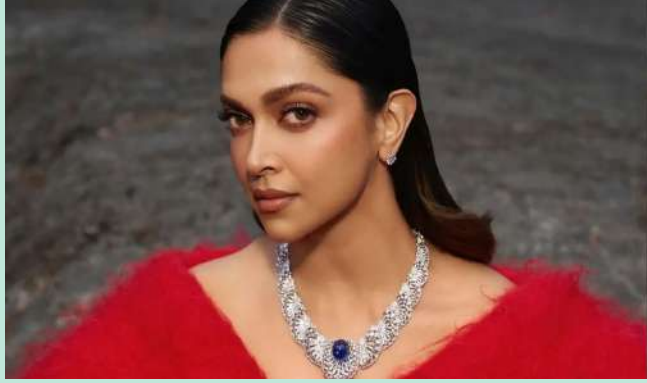
AA22xA6 દીપિકા પાદુકોણ અને અલુ અર્જુન પહેલી વખત ઓન-સ્ક્રીન જોડી જમાવતા જોવા મળશે

મુંબઈ, અટલીની આગામી તેલુગુ સાયન્સ ફિક્શન ફિલ્મમાં અલુ અર્જુન સાથે દીપિકા પાદુકોણ પહેલીવાર મોટા પડદા પર જોવા મળશે. ત્યારે ફિલ્મમેકર અટલીએ ફરી એકવાર દીપિકા પાદુકોણ પ્રત્યે પોતાનો આદર વ્યક્ત કર્યો છે. અલુ અર્જુન સાથેની તેની મહાત્વાકાંક્ષી તેલુગુ પેન-ઈન્ડિયા ફિલ્મ AA22xA6માં દીપિકા જોડાઈ હોવાનું જાહેર થયા બાદ અટલીએ જણાવ્યું કે દીપિકા પાદુકોણ તેના માટે ડેબીયુ ચાર્મી સમાન છે. અગાઉ અટલીએ દીપિકા અને શાહરુખ સાથે જવાન ફિલ્મમાં કામ કર્યું હતું. આ ફિલ્મની સફળતા બાદ ફરી દીપિકા સાથે કામ કરતા અટલીએ