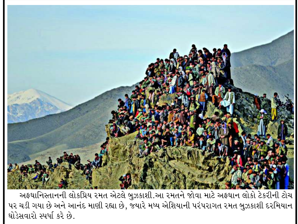
અફઘાનિસ્તાનની લોકપ્રિય રમત એટલે બુઝકાશી. આ રમતને જોવા માટે અફઘાન લોકો ટેકરીની ટોચ પર ચઢી ગયા છે અને આનંદ માણી રહ્યા છે, જ્યારે મધ્ય એશિયાની પરંપરાગત રમત બુઝકાશી દરમિયાન ઘોડેસવારો સ્પર્ધા કરે છે.

ઓઈલ કોર્પોરેશન જેવી રિફાઈનરીઓ વેનેઝુએલાના હાઈ-સલ્ફર કૂડને પ્રોસેસ કરવા સક્ષમ છે. ભારતના પેટ્રોલિયમ અને કુદરતી ગેસ પ્રાણ હરદીપ સિંહ પુરીએ પણ તેલ સ્ત્રોતોમાં વિવિધતા લાવવાના સંકેત આપ્યા છે. તેમણે જણાવ્યું હતું કે ભારત મધ્ય પૂર્વ, આફ્રિકા અને દક્ષિણ અમેરિકાના દેશો પાસેથી ખરીદી વધારી રહ્યું છે. રશિયા પાસેથી આયાત બે વર્ષના સૌથી નીચલા સ્તરે પહોંચી ગઈ છે. આ વ્યૂહાત્મક પગલું માત્ર ભારતની ઊર્જા સુરક્ષા માટે જ નહીં, પરંતુ અમેરિકા સાથેના વ્યાપારિક સંબંધોને મજબૂત કરવા માટે પણ અત્યંત મહત્વનું સાબિત થશે.