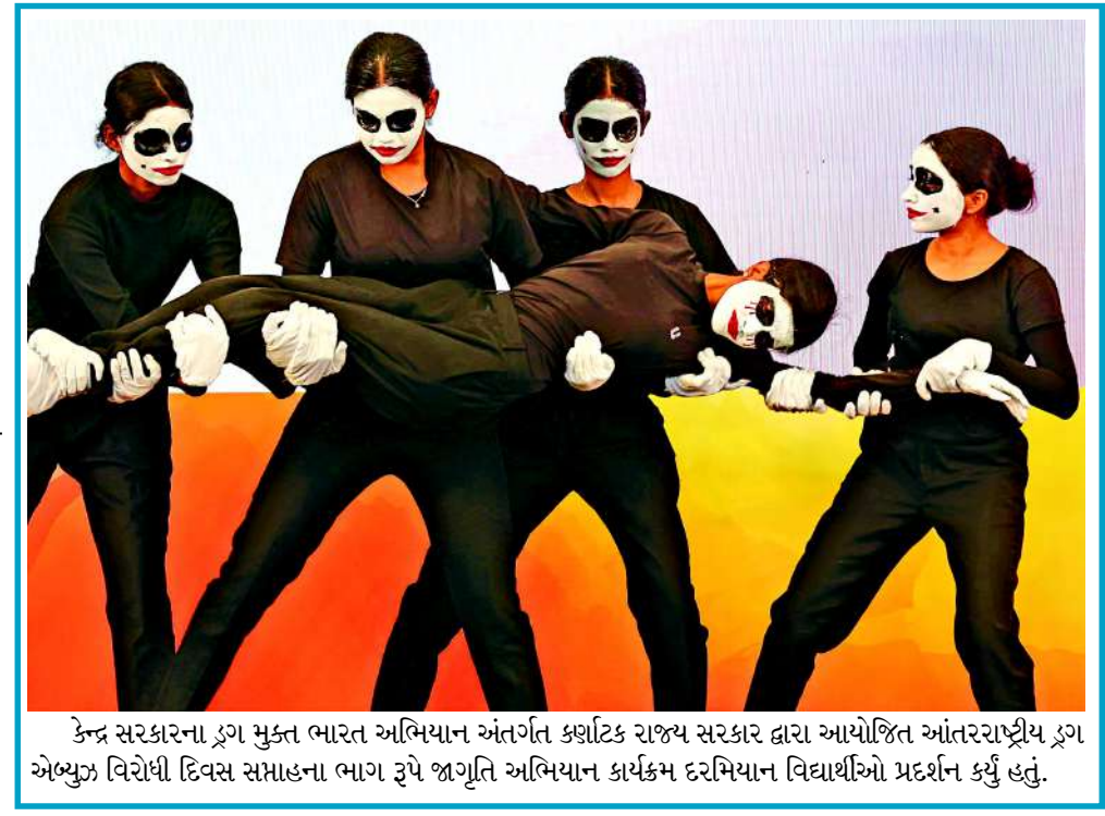
કેન્દ્ર સરકારના ડ્રગ મુક્ત ભારત અભિયાન અંતર્ગત કર્ણાટક રાજ્ય સરકાર દ્વારા આયોજિત આંતરરાષ્ટ્રીય ડ્રગ એભ્યુજ વિરોધી દિવસ સમાહના ભાગ રૂપે જાગૃતિ અભિયાન કાર્યક્રમ દરમિયાન વિદ્યાર્થીઓ પ્રદર્શન કર્યું હતું.

મિડલ ઈસ્ટમાં ચાલી રહેલી તણાવભરી સ્થિતિને કારણે છેલ્લા કેટલાક સમયથી કોમર્શિયલ ગેસ સિલિન્ડરના ભાવમાં સતત વધારો થઈ રહ્યો હતો. વર્ષ ૨૦૨૬માં આ પહેલીવાર બન્યું છે જ્યારે તેલ કંપનીઓએ કોમર્શિયલ સિલિન્ડરના ભાવ ઘટાડ્યા હોય.