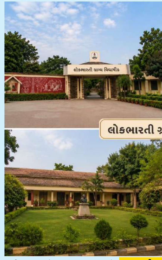
લોકભારતી ગ્રામ્ય વિદ્યાપીઠ

કાર્ય, શ્રમ અને સામાજિક જીવનને આપવામાં આવે છે. વિદ્યાર્થીઓ ખેતી, પશુપાલન, બાગાયત, ગ્રામઉદ્યોગ, હસ્તકલા અને વિવિધ ઉત્પાદક પ્રવૃત્તિઓમાં સક્રિય ભાગ લે છે. આ પ્રવૃત્તિઓ દ્વારા તેઓ શ્રમનું ગૌરવ સમજતા બને છે અને જીવન માટે જરૂરી વ્યવહાર કૌશલ્ય પ્રાપ્ત કરે છે. શિક્ષણપ્રક્રિયામાં ચર્ચા, સંવાદ, પ્રયોગ, ક્ષેત્રઅભ્યાસ, સર્વેક્ષણ, સમૂહકાર્ય અને ગ્રામસંપર્ક જેવા ઉપાયોનો વ્યાપક ઉપયોગ થાય છે. પરિણામે વિદ્યાર્થીઓમાં સ્વતંત્ર વિચારશક્તિ, નેતૃત્વ, સંશોધનવૃત્તિ અને સમસ્યા ઉકેલવાની ક્ષમતાનો વિકાસ થાય છે. અહીં શિક્ષક અને વિદ્યાર્થી વચ્ચે માત્ર ઔપચારિક સંબંધ નથી, પરંતુ પરિવાર જેવી આત્મીયતા જોવા મળે છે. આ વાતાવરણ વિદ્યાર્થીઓના વ્યક્તિત્વ વિકાસમાં મહત્વપૂર્ણ ભૂમિકા ભજવે છે. ગ્રામસેવાની જીવનદંષ્ટિ: લોકભારતીનું શિક્ષણ ગામડાંઓ સાથે જીવંત સંબંધ જાળવે છે. વિદ્યાર્થીઓ વિવિધ ગામોમાં જઈને સ્વચ્છતા અભિયાન, વૃક્ષારોપણ, જળસંચય, આરોગ્ય જાગૃતિ, પ્રૌઢ શિક્ષણ, મહિલા સશક્તિકરણ અને કૃષિ માર્ગદર્શન જેવી