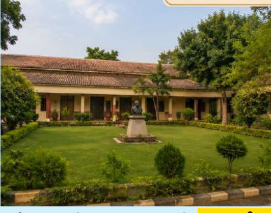
લોકભારતી ગ્રામ્ય વિદ્યાપીઠ

સ્થાપનાની પ્રેરણાદાયી ગાથા: ભારતને સ્વતંત્રતા પ્રાપ્ત થયા પછી સ્પષ્ટ થયું કે દેશનો સાચો વિકાસ ગામોના સર્વોચ્ચ વિકાસ વિના શક્ય નથી. આ વિચારધારાને હૃદયંગમ કરીને શિક્ષણવિદ્ નાનાભાઈ ભટ્ટએ ગ્રામજીવનને કેન્દ્રમાં રાખીને નવી શિક્ષણવ્યવસ્થાનું સ્વપ્ન જોયું. તે સ્વપ્નને સાકાર સ્વરૂપ આપવા માટે ઈ.સ. ૧૯૫૩માં ભાવનગર જિલ્લાના સણોસરા ગામે લોકભારતી ગ્રામ્ય વિદ્યાપીઠની સ્થાપના કરવામાં આવી. નાનાભાઈ ભટ્ટનો વિશ્વાસ હતો કે શિક્ષણનું સાચું ધ્યેય માત્ર નોકરી મેળવવાનું નથી, પરંતુ સમાજને યોગ્ય દિશા આપતા જવાબદાર નાગરિકોનું ધર્તર કરવાનું છે. આ સંસ્થા પર મહાત્મા ગાંધીની 'નઈ તાલીમ'ની વિચારધારાનો ઊંડો પ્રભાવ જોવા મળે છે. શિક્ષણ સાથે શ્રમ, સ્વાવલંબન, ગ્રામસેવા અને માનવમૂલ્યોનું સંવર્ધન લોકભારતીના પાયાના સિદ્ધાંતો બન્યા.