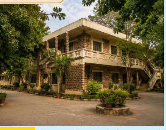
લોકભારતી ગ્રામ્ય વિદ્યાપીઠ

ગ્રામસેવાની જીવનદર્શિ: લોકભારતીનું શિક્ષણ ગામડાંઓ સાથે જીવંત સંબંધ જાળવે છે. વિદ્યાર્થીઓ વિવિધ ગામોમાં જઈને સ્વચ્છતા અભિયાન, વૃક્ષારોપણ, જળસંચય, આરોગ્ય જાગૃતિ, પ્રૌઢ શિક્ષણ, મહિલા સશક્તિકરણ અને કૃષિ માર્ગદર્શન જેવી