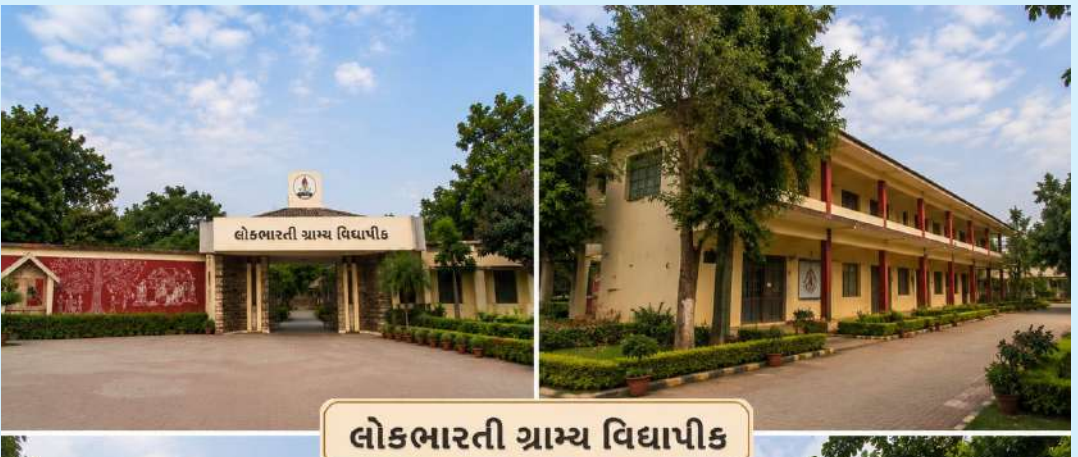
લોકભારતી ગ્રામ્ય વિદ્યાપીઠ

ભારતના શિક્ષણ ઇતિહાસમાં કેટલીક એવી સંસ્થાઓ છે, જેણે માત્ર પાઠ્યપુસ્તક આધારિત જ્ઞાન પૂરું પાડ્યું નથી, પરંતુ જીવન જીવવાની કળા, સમાજસેવાની ભાવના અને રાષ્ટ્રનિર્માણના સંસ્કારોનું સિંચન કર્યું છે. એવી અગ્રણી સંસ્થાઓમાં લોકભારતી ગ્રામ્ય વિદ્યાપીઠનું નામ અગ્રપંક્તિમાં આવે છે. આ સંસ્થા માત્ર એક વિદ્યાપીઠ નથી, પરંતુ ગ્રામજીવનને કેન્દ્રસ્થાને રાખીને વિકસેલી એક જીવંત જીવનશાળા છે. અહીં શિક્ષણ અને શ્રમ, જ્ઞાન અને સંસ્કાર, વિજ્ઞાન અને માનવતા, તેમજ પરંપરા અને આધુનિકતાનો સુમેળ જોવા મળે છે. લોકભારતીએ વર્ષો સુધી ગ્રામભારતના વિકાસ માટે અસંખ્ય યુવાનોને ધર્યા છે અને શિક્ષણને સમાજપરિવર્તનનું અસરકારક સાધન બનાવ્યું છે.