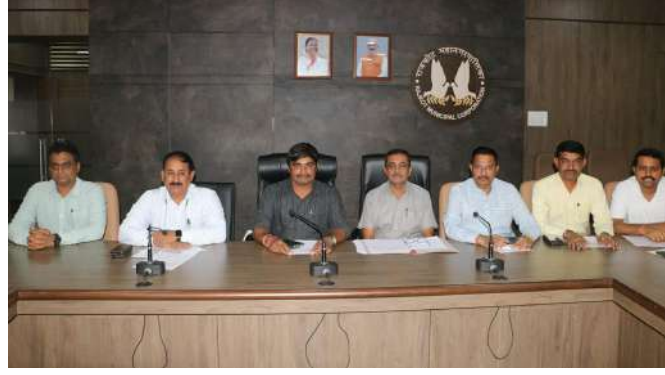
રાજકોટ મહાનગરપાલિકાની સ્ટેન્ડિંગ કમિટીની બેઠક યોજાઈ હતી જેમાં જંગલેશ્વર ડીમોલિશન