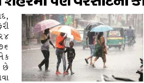
જોવા મળી છે. સુવરકુંડલામાં સારો વરસાદ નોંધાતા કૃષિ પ્રવૃત્તિઓને ગતિ મળી શકે તેવી આશા વ્યક્ત થઈ રહી છે. વલસાડ અને સુરત શહેરમાં પણ વરસાદના કારણે વાતાવરણમાં ઠંડકનો અનુભવ થયો હતો.

અમદાવાદ, ગુજરાતમાં ચોમાસાની ગતિવિધિ ફરી તેજ બનતી જોવા મળી રહી છે. છેલ્લા ૨૪ કલાક દરમિયાન રાજ્યના કુલ ૭૬ તાલુકામાં વરસાદ નોંધાતા અનેક વિસ્તારોમાં વાતાવરણમાં ઠંડક પ્રસરી છે અને ખેડૂતોમાં પણ રાહતનો માહોલ જોવા મળ્યો છે. ખાસ કરીને દક્ષિણ ગુજરાતના વિસ્તારોમાં વરસાદનું પ્રમાણ વધુ નોંધાયું છે.