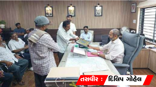
આરોગ્ય કેન્દ્ર સ્મશાન ભૂમિ સહિતની આ મૂળભુત નાગરીક સુવિધાઓ આપવા માટે અગાઉ લોધીકા મામલતદાર સહિત તંત્રવાહકોને અનેક વખત રજૂઆત કરવામાં આવેલ પરંતુ હજુ સુધી કોઈપણ જાતના પગલા તંત્રવાહકો દ્વારા લેવામાં આવેલ નથી. ભારતના બંધારણની ભાવના અનુસાર દરેક નાગરીકને સમાનતા, જીવન, અને ગૌરવ પૂર્ણ જીવનનો અધિકાર પ્રાપ્ત થયો છે. સ્થાનિક સ્વરાજની સંસ્થાઓ અને વહીવટી તંત્રની ફરજ છે કે દરેક નાગરીકને મૂળભુત સુવિધાઓ ઉપલબ્ધ કરાવવામાં આવે પરંતુ આ વિસ્તાર તરફ તંત્રવાહકો દ્વારા દુર્લક્ષ સેવાતુ હોય

આ વિસ્તારના હજુ સુધી પાયાની સુવિધાઓ મળી શકી નથી. આ વિસ્તારની ઉપરોક્ત પાંચેય સોસાયટીઓના આંતરીક અને મુખ્ય રસ્તાઓને પાકા બનાવવામાં આવે, કચરા ગંદકીના નિકાલની કામચલાવી વ્યવસ્થા કરવામાં આવે, મુખ્ય માર્ગો અને જાહેર સ્થળો પર સ્ટ્રીટ લાઈટ લગાવવામાં આવે બાળકના શિક્ષણ માટે આંગણવાડી કેન્દ્ર અને આરોગ્ય કેન્દ્ર ઉપલબ્ધ કરાવવામાં આવે, અને સ્મશાન ભૂમિ માટે તત્કાલ જમીન ફાળવવામાં આવે તે અંગે નાગરીકોને મૂળભુત સુવિધાઓ ઉપલબ્ધ કરાવવામાં આવે પરંતુ આ વિસ્તાર તરફ તંત્રવાહકો દ્વારા દુર્લક્ષ સેવાતુ હોય