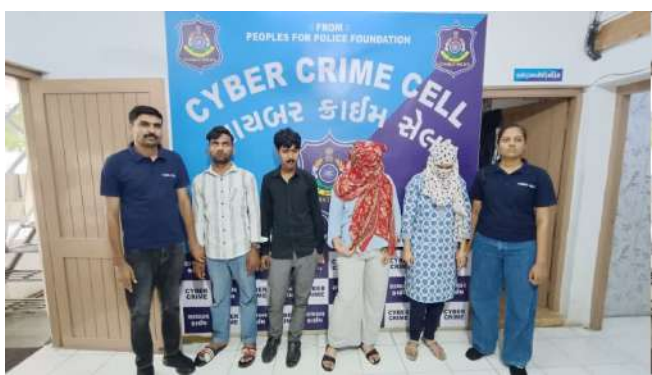
ટેલીકોલર્સ સાથે કોલ સેન્ટર આવ્યું છે, જ્યાંથી મહિલાઓને ચલાવવામાં આવતું હોવાનું સામે

સુરત, સુરતથી સાયબર ફોડનો એક ચોંકાવનારો અને ચેતવણીજનક કિસ્સો સામે આવ્યો છે. વાસ્તવમાં સુરત સાયબર પોલીસે ઓનલાઇન છેતરપિંડીના એક મોટા કથિત નેટવર્કનો પર્દાફાશ કર્યો છે, જેમાં વજન ઘટાડવાની દવાના નામે દેશભરના લોકો સાથે કરોડો રૂપિયાની ઠગાઈ કરવામાં આવતી હોવાનો આરોપ છે. પ્રાથમિક તપાસ મુજબ આ કેસમાં અંદાજે ૧.૭૭ કરોડની છેતરપિંડીનો મુદ્દો સામે આવ્યો છે, જ્યારે લાંબા સમયથી ચાલતી પ્રવૃત્તિઓને ધ્યાનમાં લેતા વધુ મોટી રકમના વ્યવહારની પણ તપાસ થઈ રહી છે.