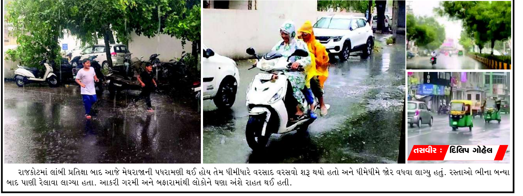
રાજકોટમાં લાંબી પ્રતિભા બાદ આજે મેઘરાજીની પધરામણ થઈ હોય તેમ ધીમીધારે વરસાદ વરસવો શરૂ થયો હતો અને ધીમેધીમે ખેર વધવા લાગ્યું હતું. રસ્તાઓ ભીના બન્યા બાદ પાણી રેલાવા લાગ્યા હતા. આકરી ગરમી અને બકારામાંથી લોકોને ઘણા અંશે રાહત થઈ હતી.