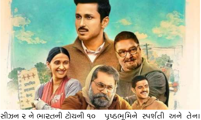
શોની શરૂઆતમાં, રામે લગ્નમાં બેવફાઈનો ખ્યાલ કરતા કહ્યું હતું કે પ્રેમમાં કંઈ પણ વૃદ્ધી જવાનું કારણ નથી. ગ્રામ ચિકિત્સાલે ૨ ઓટીટી શેલ્ફ પર ધમાલ મચાવી, ૩.૫ મિલિયન વ્યૂઝ સાથે ટોચના ૧૦ માં સ્થાન મેળવ્યું