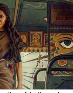
સામિત કર્યું કે પ્રતિભા અને સખત મહેનત સફળતાની ચાવી છે. દક્ષિણ અભિનેત્રી સામંથા રૂથ પ્રભુએ અસંખ્ય મોટી ફિલ્મો અને ભૂમિકાઓ દ્વારા પોતાના માટે એક વિશિષ્ટ સ્થાન બનાવ્યું છે. હવે, "મા ઇન્ટી બંગારામ" એ એક નવો રેકોર્ડ બનાવ્યો છે. ૧૯ જૂનના રોજ રિલીઝ થયા પછી, "મા ઇન્ટી બંગારામ" એ વિશ્વભરમાં ૮૩ કરોડ અને

નંદિની રેડ્ડીની ફિલ્મ 'મા ઇન્ટી બંગારામ' રિલીઝ થયા પછી જ જબરદસ્ત ચર્ચામાં છે. સામન્યા રૂથ પ્રભુના અભિનયથી દર્શકોના દિલ જીતી લીધા. અગાઉ, અનુષ્કા શેટ્ટીની ૨૦૦૯ ની મહિલા-નિર્દેશિત ફિલ્મ "અરંધતી" તેલુગુ સિનેમા માટે એક માપદંડ હતી. એક સમયે જ્યારે ફિલ્મોમાં ઠીરોનું વર્તસ્વ હતું, ત્યારે આ અભિનેત્રીઓએ