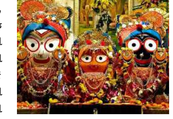
કારીગરો અને મિકેનિક્સ આ કાર્ય પર કામ કરી રહ્યા છે. સદીઓ જૂની પરંપરા અને ધાર્મિક ગૌરવ જાળવવા માટે રથને તેના પરંપરાગત સ્વરૂપમાં તૈયાર કરવામાં આવી રહ્યો છે.

રંચી, રંચીના ધુરવામાં ઐતિહાસિક ભગવાન જગન્નાથપુર રથયાત્રા ઉત્સવની તૈયારીઓ અંતિમ તબક્કામાં પહોંચી ગઈ છે. ૧૬ જુલાઈથી શરૂ થનારા આ ભવ્ય ધાર્મિક કાર્યક્રમ માટે મંદિર સંકુલ અને મેળા વિસ્તારમાં યુદ્ધના ધોરણે તૈયારીઓ ચાલી રહી છે. વહીવટ અને આયોજન સમિતિ ફરી એકવાર ભક્તો માટે સલામત અને સુવ્યવસ્થિત કાર્યક્રમ સુનિશ્ચિત કરવા માટે કામ કરી રહી છે. ભગવાન જગન્નાથ, ભગવાન બલભદ્ર અને દેવી સુભદ્રાને લઈ જનારા રથનું સમારકામ અને સુશોભનનું કામ ઝડપથી ચાલી રહ્યું છે. ઓડિશા અને પશ્ચિમ બંગાળના અનુભવી