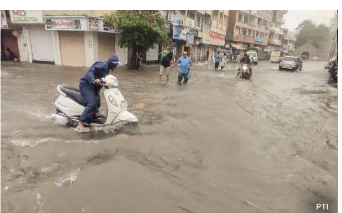
૮ વાગ્યા સુધીના બે કલાકમાં વીજળીના કડાકા-ભડાકા સાથે ૧ ઈંચથી વધુ ધોધમાર વરસાદ વરસી જતાં રસ્તાઓ પર પાણી ફરી વળ્યા હતા અને વહેલી સવારથી જ લોકજીવન તેમજ અવરજવર નહિવત્ થઈ ગઈ છે. આ ઉપરાંત, કોડીનાર તાલુકામાં પણ સવારે ૬થી ૮ વાગ્યા દરમિયાન માત્ર બે કલાકમાં દોઢ ઈંચ જેટલો વ્યાપક વરસાદ નોંધાયો છે, જેના પગલે સમગ્ર પંથકના વાતાવરણમાં ભારે ઠંડક પ્રસરી ગઈ છે. આજે વહેલી સવારથી જ ગીર સોમનાથ જિલ્લામાં મેઘરાજાએ જમાવટ કરી છે. સુત્રાપાડામાં સ્થિતિ વધુ ગંભીર

દક્ષિણ ગુજરાતના જિલ્લાઓમાં સાર્વજનિક અને ધોધમાર વરસાદ વરસી રહ્યો છે. છેલ્લા ૨૪ કલાકમાં સૌથી વધુ વરસાદ સુરતના પલસાણામાં ૮ ઈંચ (૭.૯૮ ઈંચ) નોંધાયો છે. આ ઉપરાંત બારડોલીમાં ૮ ઈંચ, વલસાડના ઉમરગામમાં ૮ ઈંચ, મહુવામાં પોણા ૮ ઈંચ અને વાપીમાં ૭.૫ ઈંચ જેટલો વરસાદ ખાબકતા અને કિસ્તારોમાં પાણી ભરાઈ ગયા છે. આજે વહેલી સવારથી ગીર સોમનાથ જિલ્લામાં મેઘરાજાએ ધમાકેદાર બેટિંગ શરૂ કરી, જેમાં ખાસ કરીને સુત્રાપાડા, ઉના અને કોડીનારમાં મુશળધાર વરસાદ નોંધાયો છે. સૌથી વધુ સુત્રાપાડામાં છેલ્લા ૨૪ કલાકમાં ૫ ઈંચ વરસાદ પડી ચુક્યો છે, જેમાંથી સવારે ૪થી ૭ વાગ્યા સુધીના માત્ર ૩ કલાકમાં જ ૪ ઈંચ અને સવારે ૬થી ૮ના બે કલાકમાં ૨ ઈંચથી વધુ વરસાદ ખાબકતા ખેતરો બેટમાં ફેરવાયા છે. ઉના શહેરમાં પણ સવારે ૬થી