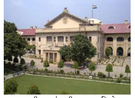
રક્ષણ આપી શકાતું નથી. પ્રથમ દ્રષ્ટિએ, આ કેસ સગીર પર ઈરાદાપૂર્વક અને આયોજિત સામૂહિક બળાત્કાર હોવાનું જણાય છે, જેની સંપૂર્ણ તપાસ જરૂરી છે.