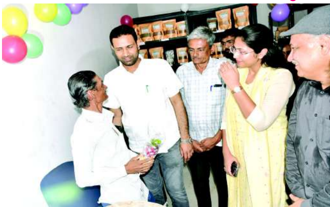
વેચાણ કેન્દ્ર દરરોજ સવારે ૮:૦૦ થી ૧૧:૦૦ કલાક તથા સાંજે ૪:૦૦ થી ૮:૦૦ કલાક દરમિયાન કાર્યરત રહેશે

અમરેલી: પ્રાકૃતિક કૃષિ અભિયાનને વધુ વેગ આપવા તેમજ અમરેલી જિલ્લાના નાગરિકોને શુદ્ધ, સાત્વિક અને સંપૂર્ણ ઝેરમુક્ત કૃષિ ઉત્પાદનો સરળતાથી ઉપલબ્ધ થાય અને પ્રાકૃતિક ખેતી કરતા ખેડૂતોને તેમના ઉત્પાદનો માટે યોગ્ય બજાર મળે તેવા શુભ હેતુથી અમરેલી શહેરમાં 'પ્રાકૃતિક કૃષિ ઉત્પાદિત વસ્તુઓના વેચાણ કેન્દ્ર'નો પ્રારંભ ઊર્જા અને કાયદો રાજ્યમંત્રીશ્રી કૌશિકભાઈ વેકરીયાના હસ્તે કરવામાં આવ્યો હતો. ગુજરાત પ્રાકૃતિક કૃષિ વિકાસ બોર્ડ, અમરેલી નગરપાલિકા અને છમ્મ કાર્મર પ્રોડ્યુસર કંપનીના સંયુક્ત ઉપક્રમે શરૂ કરવામાં આવેલા વેચાણ કેન્દ્રનો અમરેલી ખાતે નાગનાથ મહાદેવ મંદિરની બાજુમાં આવેલા નવા બસ સ્ટેન્ડ ખાતે પ્રારંભ થયો છે.