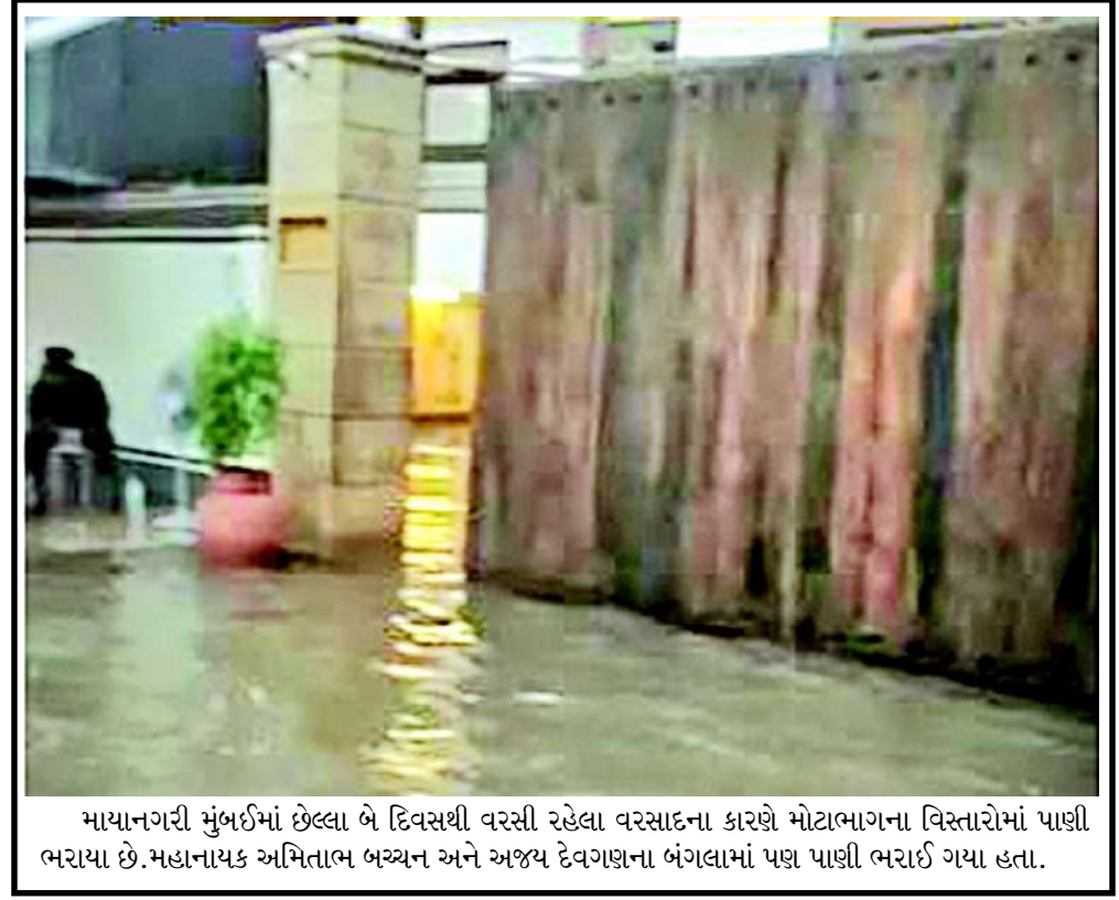
માયાનગરી મુંબઈમાં છેલ્લા બે દિવસથી વરસી રહેલા વરસાદના કારણે મોટાભાગના વિસ્તારોમાં પાણી ભરાયા છે. મહાનાયક અમિતાભ બચ્ચન અને અજય દેવગણના બંગલામાં પણ પાણી ભરાઈ ગયા હતા.

સંગ્રામનો એક ભાગ છે. બલુચ સંગઠનોની માંગ છે કે બલુચિસ્તાનને પાકિસ્તાનથી મુક્તિ અથવા વધુ સ્વાયત્તતા મળે અને પ્રાંતના ગેસ, તેલ અને ખનિજ જેવા કુદરતી સંસાધનો પર ત્યાંના સ્થાનિક બલુચ લોકોનો અધિકાર રહે. ઉલ્લેખનીય છે કે, બલુચ લિબરેશન આર્મીને પાકિસ્તાન ઉપરાંત અમેરિકા અને યુકે જેવા અનેક દેશોએ આતંકવાદી સંગઠન જાહેર કરેલું છે. આ સંગઠન ભૂતકાળમાં પણ પાકિસ્તાની આર્મીના હેડક્વાર્ટર્સ, અર્ધલશ્કરી દળોની ચોકીઓ, સરકારી ઈન્ફ્રાસ્ટ્રક્ચર અને ખાસ કરીને ચીની એન્જિનિયરો પર અનેક મોટા આત્મઘાતી હુમલા કરી ચૂક્યું છે. હાલમાં આ ભયાનક હુમલા બાદ પાકિસ્તાની સેનાએ આખા ગ્વાદર અને જીવાની વિસ્તારને કોર્ડન કરીને મોટું સર્ચ ઓપરેશન શરૂ કર્યું છે.