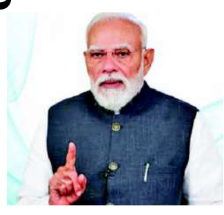
૨૮,૮૪૦ કરોડની ફાળવણી સાથે આ યોજનાનો ઉદ્દેશ્ય એવિએશન-આધારિત વિકાસના આગામી તબક્કાને વેગ આપવાનો છે. તે વ્યાપક અને ટકાઉ કનેક્ટિવિટી સુનિશ્ચિત કરવા માટે રચાયેલા બહુવિધ વ્યૂહાત્મક ઘટકો પર ધ્યાન કેન્દ્રિત કરે છે. સમગ્ર દેશમાં એવિએશન ઈન્ફ્રાસ્ટ્રક્ચરનો