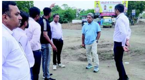
સમયમર્યાદામાં પૂર્ણ થાય તે માટે વિવિધ વિભાગો વચ્ચે સંકલન જાળવવા અને સોંપાયેલી કામગીરીનો નિયમિત મોનિટરિંગ કરવા પર ભાર મૂકવામાં આવ્યો હતો, જેથી શ્રદ્ધાળુઓને કોઈ અસુવિધા ન થાય. આ સ્થળ મુલાકાત દરમિયાન ભાવનગર મહાનગરપાલિકાના વિવિધ વિભાગના ઉચ્ચ અધિકારીઓ હાજર રહ્યા હતા.

ભાવનગર, તા. ૪ આગામી અષાઢી બીજની રથયાત્રાના ભવ્ય આયોજનના ભાગરૂપે મ્યુનિસિપલ કમિશનર દ્વારા રથયાત્રાના સમગ્ર રૂટ તેમજ બાલા હનુમાન ચોક ખાતે સ્થળ મુલાકાત લેવામાં આવી હતી. આ નિરીક્ષણ દરમિયાન તેમણે માર્ગ વ્યવસ્થા, સ્વચ્છતા, સ્ટ્રીટ લાઈટ, ડ્રેનેજ, બેરિકેડિંગ, ટ્રાફિક અને પીવાના પાણી જેવી આવશ્યક સુવિધાઓની ગીણવટભરી સમીક્ષા કરી હતી. રથયાત્રાના રૂટને સંપૂર્ણ અવરોધમુક્ત રાખવા અને શ્રદ્ધાળુઓની અવરજવર સરળતાથી થઈ શકે તે માટે જાહેર રસ્તાઓ પર નડતરરૂપ ગેરકાયદેસર દબાણોને તાત્કાલિક હટાવવા કમિશનરે સંબંધિત વિભાગોને કડક સૂચના આપી હતી. કોર્પોરેશન હસ્તકની તમામ કામગીરી