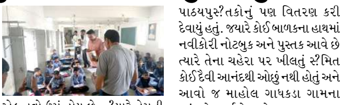
એક નવો ઉમ્મ હોય છે, તેવારે તેમની આ આશાને પાંખો આપવા આશાપુરા નારાયણ દેવી મંદિર ટ્રસ્ટે ઉદાર હાથેવહાલ વરસાઈયું છે. ટ્રસ્ટ દ્વારા ગામના અંદાજે ૯૨૦ જેટલા તેજસ્વી અને જરૂરિયાતમંદ વિદ્યાર્થીઓને વહાલપૂર્વક નોટબુકોનું વિતરણ કરવામાં આવ્યું હતું. એટલું જ નહીં, આ ગરીબ અને મધ્યમવર્ગીય પરિવારોના બાળકોના સવભા પૃથ્વી મોંઘા ભણતરનો બોજ હળવો કરવામાટે હાજરમાં જ ૫૦૦૦ જેટલા

અમરેલી, કહેવાય છે કે જે હાથ સેવામાં જોડાય છે તે ઈશ્વરની સૌથી નજીક હોય છે. આવા જ એક હૃદયસ્પર્શી અને માનવતાની મહેક ફેલાવતો સેવાયજ્ઞ સાવરકુંડલા તાલુકાના ઐતિહાસિક અને પવિત્ર ગાદકડા ગામે આશાપુરા નારાયણ દેવી મંદિર ટ્રસ્ટ દ્વારા આકાર પામ્યો છે. અંતરિયા ગ્રામીણ વિસ્તારનું કોઈ બાળક આર્થિક સંકટામ્લને કારણે શિક્ષણના અધિકારથી વંચિત ન રહી જાય અને તેના હાથમાં રહેલી કલમ ક્યારેય અટકે નહીં, તેવા પરમ કલ્યાણકારી આશય સાથે મંદિર ટ્રસ્ટ દ્વારા દીકરા-દીકરીઓને શૈક્ષણિક સામગ્રીનું અણમોલ પ્રદાન કરવામાં આવ્યું હતું. નવા શૈક્ષણિક વર્ષના પ્રારંભે જ્યારે માસુમ બાળકોના ચહેરા પર ભણવાનો