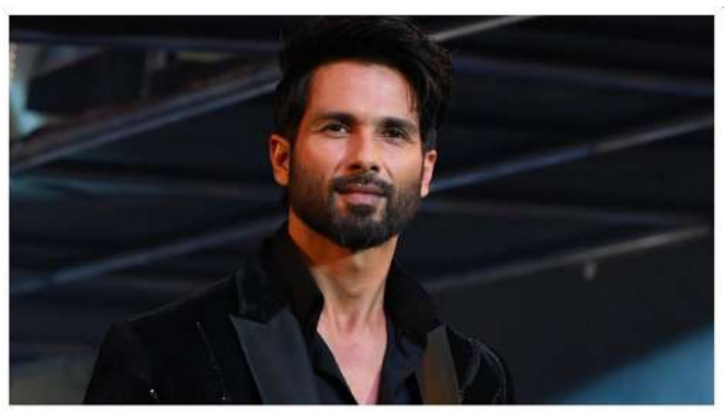
આટલી ખરાબ હવા ગુણવત્તામાં શૂટિંગ કરવા માંગતો નથી. ત્યારબાદ પ્રોડક્શન ટીમે તેમના માટે પ-૬ એર પ્યુરિફાયરની વ્યવસ્થા કરી, બોકે શૂટિંગ સંપૂર્ણપણે બહાર હતું. શૂટિંગ ગુરુગ્રામના સાયબર સિટીમાં થયું હતું. તેમણે કહ્યું, "અમને

શાહિદ કપૂરે, કૃતિ સેનન અને રશ્મિકા મંદલા અભિનીત 'કોકટેલ ૨' તાજેતરમાં થિયેટરોમાં રિલીઝ થઈ હતી. ફિલ્મને વિવેચકો તરફથી મિશ્ર સમીક્ષાઓ મળી હતી, પરંતુ બોક્સ ઓફિસ પર સારું પ્રદર્શન કર્યું હતું. જ્યારે ફિલ્મનું શૂટિંગ ઇટાલી જેવા સુંદર સ્થળોએ થયું હતું, ત્યારે દિલ્હી-એનસીઆરમાં શૂટિંગ ખૂબ જ અલગ અને પડકારજનક અનુભવ હતો. એક શેડ્યૂલ દરમિયાન, ટીમને ખતરનાક સ્તરના પ્રદૂષણમાં