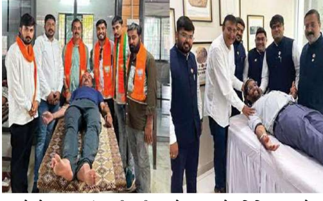
રાજકોટને આપવામાં આવી હતી. રાજકોટ મહાનગર ભાજપ યુવા મોરચા દ્વારા યોજાયેલા કેમ્પમાં ૧૫૦ લોકોએ ઉત્સાહભરે રક્તદાન કર્યું હતું, જેમાંથી ૬૦

રાજકોટ સિવિલ હોસ્પિટલ તથા AIIMS રાજકોટના લાભાથે શ્રીમદ રાજચંદ્ર ફાઉન્ડેશનના સહયોગથી શહેરમાં ત્રણ અલગ-અલગ સંસ્થાઓ દ્વારા વિશાળ રતરે રક્તદાન કેમ્પનું આયોજન કરવામાં આવ્યું હતું. રાજકોટ મહાનગર ભાજપ યુવા મોરચા, ઇન્સ્ટિટ્યુટ ઓફ ચાર્ટર્ડ એકાઉન્ટન્ટ્સ ઓફ ઈન્ડિયા ICAI રાજકોટ બ્રાન્ચ તથા રોટરી ક્લબ ઓફ રાજકોટના સંયુક્ત પ્રયાસોથી કુલ ૧૭૦ બોટલ રક્ત એકત્ર કરવામાં આવ્યું હતું. જેમાંથી ૧૫૦ બોટલ રાજકોટ સિવિલ બ્લડ બેન્ક અને ૪૮ બોટલ AIIMS