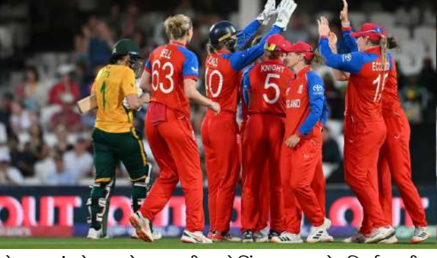
અજેય રહ્યું છે, અને બધાની નજર તેના પર છે કે શું તેઓ ફાઇનલમાં આ સિલસિલાને જાળવી શકશે કે નહીં. દક્ષિણ આફ્રિકાની મહિલા ટીમ સામે ટોચ હારીને પ્રથમ બેટિંગ કરવાનો નિર્ણય લીધા પછી, ઇંગ્લેન્ડની શરૂઆત ખૂબ જ ખરાબ રહી, તેણે ૨૩ રનમાં ત્રણ વિકેટ ગુમાવી દીધી. ત્યારબાદ ઇંગ્લેન્ડની કેપ્ટન નેટ સ્કવાયર બ્રન્ટ અને હીયર

આઈસીસી મહિલા ટી ૨૦ વર્લ્ડ કપ ૨૦૨૬ ની બીજી સેમિફાઇનલ લંડનના કેનિંગટન ઓવલ સ્ટેડિયમ ખાતે ચર્ચમાન ઇંગ્લેન્ડ અને દક્ષિણ આફ્રિકા વચ્ચે રમાઈ હતી. ઇંગ્લેન્ડની મહિલા ટીમે ૫ વુલ્વાર્થના રોજ ૪૦ રનના માર્ગિનથી મેચ જીતીને ફાઇનલમાં પોતાનું સ્થાન નિશ્ચિત કર્યું. ઇંગ્લેન્ડની મહિલા ટીમે ઇતિહાસમાં પાંચમી વખત ૨૦ વર્લ્ડ કપમાં પોતાનું સ્થાન નિશ્ચિત કર્યું છે. હવે તેઓ ફાઇનલમાં ઓસ્ટ્રેલિયન મહિલા ટીમ, જે ટુનમિન્ટની સૌથી સફળ ટીમ છે, સામે ટકરાશે. અત્યાર સુધી, ઇંગ્લેન્ડ ટી ૨૦ વર્લ્ડ કપમાં