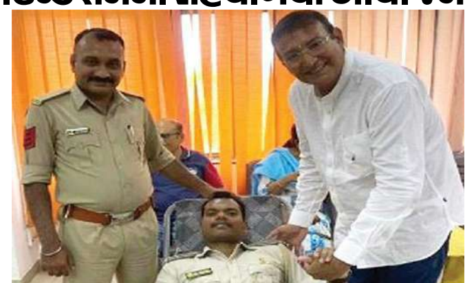
રક્તદાન કેમ્પમાં ૩૮ લોકોએ રક્તદાન કરી માનવતા મહેકાવી રક્તદાન કેમ્પમાં સેન્ટ્રલ ગુડ્સ એન્ડ સર્વિસ ટેક્સ ભવન રાજકોટના કમિશનર વી.શિવકુમાર તથા આસીસ્ટન્ટ કમિશરે પણ રક્તદાન કર્યું હતું. આપના ધરે આવતા પ્રસંગોમાં જન્મદિવસ નિમિત્તે કે કોઈ વ્યક્તિના સ્મૃતિપદ દિવસ નિમિત્તે તથા અન્ય પ્રસંગોપાત

પ્રવર્તમાન ઉનાબાની ગરમીની સીઝનમાં રક્તની જરૂરીયાત ઉભી થયેલી છે, સિવિલ હોસ્પિટલના જરૂરીયાતમંદ દર્દીઓ માટે નિયુક્ત લોહી મળી રહે તે માટે પ્રયત્નશીલ બને તેવી વિનંતી છે. રક્તદાન કરી અમૃત્ય માનવ જીવોનો બચાવવા નિમિત્ત બનવા માટે અપીલ કરવામાં આવી છે. રાજકોટની સિવિલ હોસ્પિટલ ખાતે સમગ્ર સૌરાષ્ટ્રના દર્દીઓ નિયુક્ત સારવાર માટે આવે છે. હાલમાં સિવિલ હોસ્પિટલમાં તમામ પ્રકારના બ્લડ સુપની તાત્કાલિક જરૂરીયાત છે ત્યારે CGST ભવનનાં દર્દીઓના પ્રવેશ નિમિત્તે સેન્ટ્રલ ગુડ્સ એન્ડ સર્વિસ ટેક્સ ભવન રાજકોટના કમિશનર વી.શિવકુમાર તથા આસીસ્ટન્ટ કમિશરે પણ રક્તદાન કર્યું હતું. આપના ધરે આવતા પ્રસંગોમાં જન્મદિવસ નિમિત્તે કે કોઈ વ્યક્તિના સ્મૃતિપદ દિવસ નિમિત્તે તથા અન્ય પ્રસંગોપાત