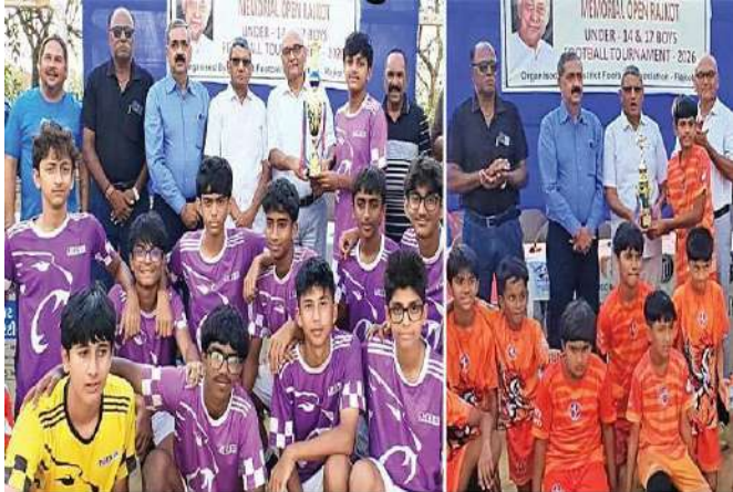
રાજકોટ કોમર્શિયલ કો-ઓપરેટિવ બેન્ક અને ડિસ્ટ્રિક્ટ ફૂટબોલ એસોસિએશનના સંયુક્ત આયોજનમાં ૨૭ ટીમોની જોરદાર ટક્કર. આપી ટ્રોફી પોતાના નામે કરી હતી. આમ માસ્ટર ડ્રેઝરને ૨-૦થી હરાવી ચેમ્પિયનશિપ જીતી હતી, જ્યારે અંદર-૧૭ કાર્ગિલમાં માસ્ટર ડ્રેઝરે જીતીને ૧-૦થી પરાજય

રાજકોટ કોમર્શિયલ કો-ઓપરેટિવ બેન્ક લિમિટેડ અને ડિસ્ટ્રિક્ટ ફૂટબોલ એસોસિએશન, રાજકોટના સંયુક્ત ઉપક્રમે આયોજિત 'શેઠ શ્રી જયંતિલાલ કુંડલિયા મેમોરિયલ કપ-૨૦૨૬' ફૂટબોલ ટુર્નામેન્ટનો ઉત્સાહભરે અને ભવ્ય સમાપન થયો હતો. રેલવે લોકો કોલોની સ્થિત આધુનિક સુવિધાઓથી સજ્જ ફૂટબોલ ગ્રાઉન્ડ ખાતે યોજાયેલી આ ટુર્નામેન્ટમાં અંદર-૧૪ અને અંદર-૧૭ વિભાગની કુલ ૨૭ ટીમોએ ઉત્સાહપૂર્વક ભાગ લીધો હતો. ટુર્નામેન્ટ દરમિયાન ખેલાડીઓએ ઉત્તમ રમતીકોશ્ય, ટીમ્સ્ક અને રમત પ્રત્યેની પ્રતિબદ્ધતા દર્શાવી હતી. પ્રેક્ષકોની ભારે ઉપસ્થિતિ અને ઉત્સાહભરે પ્રોત્સાહન વચ્ચે રમાયેલી ગેમોએ સમગ્ર વાતાવરણને