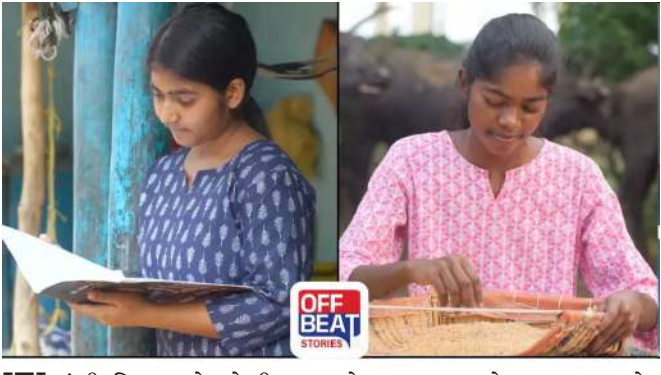
ITIમાંથી શિક્ષણ મેળવેલી આ દીકરીઓ આજે અદભૂત કામ કરી રહી છે. વડાપ્રધાનશ્રીએ જણાવ્યું કે, “એક સમય એવો હતો કે આપણા અહીં કોઈમાં ભણતું હોય તો માતા-પિતાને તેનો ઉલ્લેખ કરવામાં પણ શરમ આવતી હતી. પરંતુ હવે સમય બદલાઈ ગયો છે. ભલે તેમનું શિક્ષણ ITIમાં થયું હોય, પરંતુ તેમના સપનાઓ અસાધારણ છે. આ દીકરીઓમાંથી ઘણી એવી છે કે જેમના પરિવારમાં કોઈએ ક્યારેય પાસપોર્ટ પણ નહોતો બનાવ્યો, પાસપોર્ટ જોયો પણ ન હતો. વિદેશ જવાની વાત તો દૂર, ઘણી દીકરીઓએ તો દિલ્હી કે મુંબઈ પણ જોયાં નહોતાં. પરંતુ આજે એ જ દીકરીઓ તાલીમ માટે મલેશિયા ગઈ, વિશ્વની

અમદાવાદ, ૦૪ જુલાઈ ૨૦૨૬ના રોજ વડાપ્રધાન શ્રી નરેન્દ્ર મોદીના હસ્તે સાણંદમાં ઝૂં સેમિનાઈજીયું સુવિધા અંતર્ગત ચીપ્સના વ્યવસાયિક ઉત્પાદનનો શુભારંભ કરાવવામાં આવ્યો છે. આ પ્રસંગે ભારતના સેમિકન્ડક્ટર મિશનની સફળતામાં દેશની દીકરીઓના યોગદાન અંગે વડાપ્રધાનશ્રીએ કહ્યું હતું કે, “અહીં કામ કરતી બહેનો-દીકરીઓ, ઝારખંડ, છત્તીસગઢ, મધ્યપ્રદેશ સહિતના રાજ્યોના ટ્રાઈબલ બેલ્ટમાંથી અહીં આવી છે. આ દીકરીઓએ જ્યારે મને કેન્ટરી બતાવી, ત્યારે ખૂબ જ ઉત્સાહ અને આત્મવિશ્વાસ સાથે દરેક પ્રક્રિયા વિશે વિગતવાર સમજાવ્યું. સામાન્ય પરિવારોમાં ઉછરેલી, સામાન્ય શાળાઓમાં ભણેલી અને