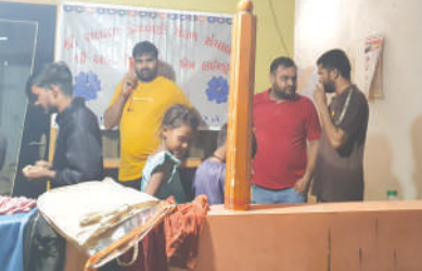
સ્થળે સ્થળાંતર કરવામાં આવ્યું છે. સ્થળાંતરની સમગ્ર કામગીરી તંત્ર દ્વારા વરસાદની સ્થિતિ પર સતત નજર રાખવામાં આવી રહી છે અને જરૂરી હોય ત્યાં તાત્કાલિક કાર્યવાહી કરવામાં આવી રહી છે. જિલ્લા તંત્ર દ્વારા નાગરિકોને અપીલ કરવામાં આવે છે કે, ભારે વરસાદ દરમિયાન નીચાણવાળા વિસ્તારોમાં જવાનું ટાળે, દરમિયાન લોકોની સલામતીને સર્વોચ્ચ પ્રાથમિકતા આપવામાં આવી હતી. હાલ ચલાલા નગરપાલિકા વિસ્તારમાં સ્થિતિ

અમરેલી: અમરેલી જિલ્લાના ચલાલા નગરપાલિકા વિસ્તારમાં ભારે વરસાદને કારણે નીચાણવાળા વિસ્તારોમાં પાણી ભરાઈ જતાં કેટલાક લોકો ફસાઈ ગયા હતા. પરિસ્થિતિની જાણ થતાં નગરપાલિકા તંત્ર દ્વારા તાત્કાલિક બચાવ અને સ્થળાંતરની કામગીરી હાથ ધરવામાં આવી હતી. સ્થાનિક વહીવટી તંત્ર તથા સંબંધિત વિભાગોની સંકલિત કામગીરીના પરિણામે અંદાજિત ૧૦૦ લોકોને સલામત