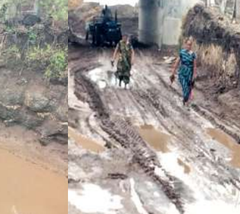
ખેડૂતોને વાવણી કરવામાં મુશ્કેલી પડી રહી છે.

ભરાઈ જતાં ખેડૂતો માટે પોતાના ખેતરો સુધી પહોંચવું મુશ્કેલ બન્યું છે. પરિણામે આશરે ૨૫૦૦ વિઘા વિસ્તારમાં વાવણીની કામગીરી પર સીધી અસર પડી રહી હોવાનું ખેડૂતો જણાવી રહ્યા છે.