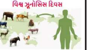
વિશ્વ ઝુનોસીસ દિવસ

દ જુલાઈ, “વર્લ્ડ ઝુનોસીસ ડે” ઝુનોસીસ બીમારી (ઝુનોસીસ ડીસીસ) જેમ કે ઈબોલા, એચઆઇવી, નેન્ફલુએન્સા અને વેસ્ટ નાઈલ વાયરસને નાબૂદ કરવા માટે સૌથી પહેલા રસીકરણ કરવામાં આવ્યું હતું. જે નિમિત્તે દર વર્ષે ૬ જુલાઈના રોજ “વર્લ્ડ ઝુનોસીસ ડે” મનાવવામાં આવે છે. ઝુનોસીસ એક સંક્રમક રોગ છે જે પ્રાણીઓમાંથી મનુષ્યોમાં ફેલાય છે. ઝુનોસીસ કે પેથોજન સ બેક્ટીરિયલ, વાયરલ અથવા પરજીવી હોઈ શકે છે. જે મનુષ્યનાં સૌથી સંપર્કમાં આવવાથી અથવા ભોજન, પાણી અને વાતાવરણનાં માધ્યમથી મનુષ્યોમાં ફેલાય છે.