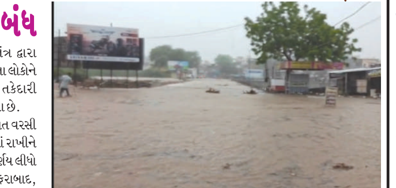
ધારી ગીરમાં બપોર બાદ પડેલા મુશળધાર વરસાદને કારણે શહેરના જોશીબાગ, ખડીયા અને હેમરાજિયા સહિતના નીચાણવાળા રહેણાંક વિસ્તારોમાં વરસાદી પાણી ઘૂસી ગયા હતા. અનેક મકાનોમાં પાણી

અમરેલી જિલ્લામાં મેઘરાજાએ તોફાની બેટિંગ કરતાં અનેક વિસ્તારોમાં ભારે વરસાદ નોંધાયો છે. ખાસ કરીને રાજુલા પંથકમાં અંદાજે ૧૨ ઈંચ વરસાદ વરસતાં ખેડૂતોની જીવાદોરી ગણાતો ધારેશ્વર ગામ નજીક આવેલ ધાતરવડી ડેમ-૧ ઓવરફ્લો થયો છે. ડેમમાં સતત પાણીની આવક વધતાં આખરે ડેમ છલકાઈ ગયો હતો. ધાતરવડી ડેમ-૧ રાજુલા અને જાફરાબાદ શહેર સહિત આસપાસના વિસ્તારોને પીવાનું પાણી પૂરું પાડે છે તેમજ ૧૩ ગામોના ખેડૂતોને સિંચાઈ માટે જીવનદાયી સાબિત થાય છે. ડેમ ઓવરફ્લો થતાં તંત્ર દ્વારા નીચાણવાળા વિસ્તારોમાં રહેતા લોકોને સાવચેત રહેવા અને જરૂરી તકેદારી રાખવા એલર્ટ કરવામાં આવ્યા છે. બીજી તરફ જિલ્લામાં સતત વરસી રહેલા ભારે વરસાદને ધ્યાનમાં રાખીને શિક્ષણ વિભાગે મહત્વનો નિર્ણય લીધો છે. સાવરકુંડલા, રાજુલા, જાફરાબાદ, ખાંભા અને ધારી તાલુકાની તમામ પ્રાથમિક તથા માધ્યમિક શાળાઓમાં આવતીકાલે શૈક્ષણિક કાર્ય બંધ રહેશે. જ્યારે જિલ્લાના અન્ય તાલુકાઓમાં રાત્રિ દરમિયાન વરસાદની સ્થિતિની સમીક્ષા કર્યા બાદ નિર્ણય લેવામાં આવશે.