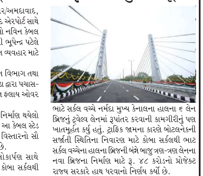
ભાટ સર્કલ વચ્ચે નર્મદા મુખ્ય કેનાલના હાલના ૬ લેન બ્રિજનું ટ્વેલ્વ લેનમાં રૂપાંતર કરવાની કામગીરીનું પણ ખાતમૂર્દત કર્યું હતું. ટ્રાફિક જામના કારણે બોટલનેકની સર્જાતી સ્થિતિના નિવારણ માટે કોબા સર્કલથી ભાટ સર્કલ વચ્ચેના હાલના બ્રિજની બંને બાજુ ત્રણ-ત્રણ લેનના નવા બ્રિજના નિર્માણ માટે રૂ. ૪૮ કરોડનો પ્રોજેક્ટ રાજ્ય સરકારે હાથ ધરવાનો નિર્ણય કર્યો છે.

ગાંધીનગર/અમદાવાદ, પાટનગર ગાંધીનગરને અમદાવાદ એરપોર્ટ સાથે જોડતા માર્ગ પર ભાટ ચાર રસ્તા પરનો નવિન કેબલ સ્ટેડ ફલાય ઓવર બ્રિજ મુખ્યમંત્રી શ્રી ભૂપેન્દ્ર પટેલે રવિવાર તા. ૦૫/૦૭/૨૦૨૬ થી વાહન વ્યવહાર માટે ખૂલ્યો મુક્યો છે. રાજ્ય સરકારના માર્ગ અને મકાન વિભાગ તથા મદાવાદ શહેરી વિકાસ સત્તામંડળ ઓગ્રા દ્વારા પચાસ-પચાસ ટકાની ભાગીદારીથી આ નવિન ફલાય ઓવર બ્રિજનું નિર્માણ કરવામાં આવ્યું છે. રૂ. ૧૭૫ કરોડના અંદાજીત ખર્ચે નિર્માણ થયેલો ૧.૪૮ કિલોમીટરની લંબાઈ ધરાવતો આ કેબલ સ્ટેડ ફલાય ઓવર બ્રિજ રાજ્યના શહેરી વિસ્તારનો સૌ પ્રથમ કેબલ સ્ટેડ ફલાય ઓવર બ્રિજ છે. મુખ્યમંત્રીશ્રીએ આ બ્રિજના લોકાર્પણ સાથે ગાંધીનગર-અમદાવાદ કોરિડોર પર કોબા સર્કલથી