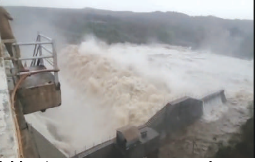
લોકોને નદીના પટમાં અવરજવર ન કરવા, ઢોરઢાંપર તથા કિમતી ચીજ વસ્તુઓને સુરક્ષિત સ્થળે ખસેડવા તેમજ સ્થાનિક તંત્રની સૂચનાઓનું પાલન કરવા અનુરોધ કરવામાં આવ્યો છે.

અમરેલી: અમરેલી જિલ્લાના ધારી તાલુકામાં આવેલી ખોડિયાર સિંચાઈ યોજના ગઈકાલે તા.૫ ના રોજ સાંજે ૬:૪૫ કલાકે તેની કુલ જળસંચય ક્ષમતાના ૯૬ ટકા સુધી ભરાઈ જવા પામેલ હતો. જળાશયમાં પાણીની સતત આવકને ધ્યાનમાં રાખીને સિંચાઈ વિભાગ દ્વારા ડેમના ૯ દરવાજા ૨.૪૩ મીટર ખોલવામાં આવ્યા છે, જેમાંથી પ્રતિ સેકન્ડ ૪૮,૦૫૦ ક્યુસેક પાણીનો પ્રવાહ આઉટ ફ્લો થઈ રહ્યો છે. સિંચાઈ વિભાગના જણાવ્યા અનુસાર, ચોમાસા દરમિયાન ઉપવાસમાંથી પાણીની સતત આવકને કારણે પરિસ્થિતિ પર સતત નજર રાખવામાં આવી રહી છે. નીચાણવાળા વિસ્તારોમાં રહેતા