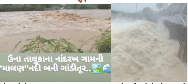
ઉના તાલુકાના નાંદરખ ગામની 'માલણ' નદી બની ગાંડીતૂર.

કેલેશ ભટ્ટ ઉના: ગીર સોમનાથ જિલ્લાના ઉના પંથકમાં ગત રાત્રિથી શરૂ થયેલા ૧૨ ઈંચથી વધુના અવિરત અને ધોધમાર વરસાદને કારણે સમગ્ર વિસ્તારમાં જળબંબાકારની ગંભીર પરિસ્થિતિ સર્જાઈ છે. ખાસ કરીને ગાંગડા અને સનખડા સહિતના ગ્રામ્ય વિસ્તારોમાં માલણ નદીએ ચૈદ્રસ્વરૂપ ધારણ કરતાં પૂરના પાણી રહેણાંક વિસ્તારોમાં ઘૂસી ગયા છે, જેને પગલે સ્થાનિક વહીવટી તંત્ર અને ફાયર વિભાગની ટીમો બચાવ કામગીરી માટે ખંડેરો તૈનાત થઈ ગઈ છે. આ આકાશી આકંઠે સ્થાનિક જનજીવનને સંપૂર્ણપણે અસ્તવ્યસ્ત કરી નાખ્યું છે. મોડી રાત્રે ગાંગડા ગામમાંથી પસાર થતી માલણ નદીમાં પૂર આવતા નદીનું સ્તર જોખમી રીતે વધી ગયું હતું, જેને કારણે સ્થાનિકોમાં ભારે ફફડાટ વ્યાપી ગયો હતો. નદીના ઘસમસતા પાણી નીચાણવાળા વિસ્તારોમાં ઘૂસી જતાં