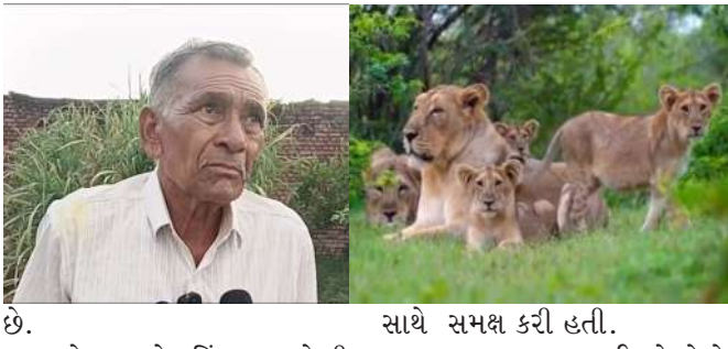
સાથે સમક્ષ કરી હતી.