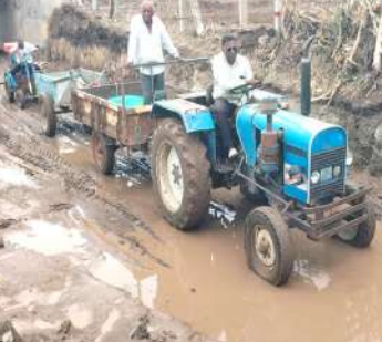
અમરેલીના શેડુભાર ગામમાં ખેડૂતોને વાવણી કરવામાં મુશ્કેલી પડી રહી છે.

કામમાં લગભગ ચાર હજાર વીઘા જેટલી ખેતીની જમીન આવેલી છે. અમુક જગ્યાએ સ્થાનિક લોકો દ્વારા પણ વૈકલ્પિક રીતે વ્યવસ્થા કરવામાં આવી છે. આમ છતાં ૨૫૦૦ વીઘા જમીનમાં ખેડૂતો જઈને વાવણી કરી શકતા નથી. અમરેલી તાલુકાના શેડુભાર ગામમાં બ્રોડગેજ રેલવે પ્રોજેક્ટ હેઠળ ચાલી રહેલી કામગીરીને કારણે ચોમાસાની ઋતુમાં ખેડૂતોને ભારે મુશ્કેલીઓનો સામનો કરવો પડી રહ્યો છે. ગામ વિસ્તારમાં આવેલા કુલ સાત રેલવે ફાટકો પૈકી વિવિધ સ્થળોએ કામ ચાલુ હોવાથી વરસાદી પાણી