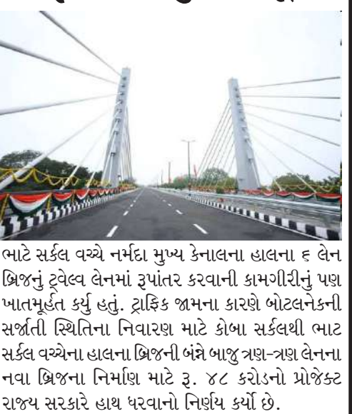
ભાટ સર્કલ વચ્ચે નર્મદા મુખ્ય કેનાલના હાલના ૬ લેન બ્રિજનું ટ્વેલ્વ લેનમાં રૂપાંતર કરવાની કામગીરીનું પણ ખાતમૂર્દત કર્યું હતું. ટ્રાફિક જામના કારણે બોટલનેકની સર્જાતી સ્થિતિના નિવારણ માટે કોબા સર્કલથી ભાટ સર્કલ વચ્ચેના હાલના બ્રિજની બંને બાજુ ત્રણ-ત્રણ લેનના નવા બ્રિજના નિર્માણ માટે રૂ. ૪૮ કરોડનો પ્રોજેક્ટ રાજ્ય સરકારે હાથ ધરવાનો નિર્ણય કર્યો છે.

ગાંધીનગર/અમદાવાદ, પાટનગર ગાંધીનગરને અમદાવાદ એરપોર્ટ સાથે જોડતા માર્ગ પર ભાટ ચાર રસ્તા પરનો નવિન કેબલ સ્ટેડ ફલાય ઓવર બ્રિજ મુખ્યમંત્રી શ્રી ભૂપેન્દ્ર પટેલે રવિવાર તા. ૦૫/૦૭/૨૦૨૬થી વાહન વ્યવહાર માટે ખૂલ્યો મુક્યો છે. રાજ્ય સરકારના માર્ગ અને મકાન વિભાગ તથા મદાવાદ શહેરી વિકાસ સત્તામંડળ ઓગ્રા દ્વારા પચાસ-પચાસ ટકાની ભાગીદારીથી આ નવિન ફલાય ઓવર બ્રિજનું નિર્માણ કરવામાં આવ્યું છે. રૂ. ૧૭૫ કરોડના અંદાજીત ખર્ચે નિર્માણ થયેલો ૧.૪૮ કિલોમીટરની લંબાઈ ધરાવતો આ કેબલ સ્ટેડ ફલાય ઓવર બ્રિજ રાજ્યના શહેરી વિસ્તારનો સૌ પ્રથમ કેબલ સ્ટેડ ફલાય ઓવર બ્રિજ છે. મુખ્યમંત્રીશ્રીએ આ બ્રિજના લોકાર્પણ સાથે ગાંધીનગર-અમદાવાદ કોરિડોર પર કોબા સર્કલથી