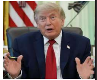
નેતા, મોજતબા ખામેનીએ જણાવ્યું હતું કે તેઓ સુરક્ષાના કારણોસર તેમના પિતા, ભૂતપૂર્વ સર્વોચ્ચ નેતાની અંતિમવિધિમાં હાજરી આપશે નહીં. ઈલાહીએ આ નિર્ણય માટે ઈઝરાયલી ધમકીઓ અને દેખરેખના જોખમોને જવાબદાર ગણાવ્યા હતા જે જાહેર હાજરીને ખતરનાક બનાવશે.

વતન મશહદમાં તેમના દફનવિધિનું આયોજન કરવામાં આવ્યું છે. ૨૮ ફેબ્રુઆરીના હુમલામાં માર્યા ગયેલા પરિવારના ઘણા સભ્યો સાથે તેમને દફનાવવામાં આવે તેવી અપેક્ષા છે, જેમાં તેમની નાની પૌત્રી ઝહરા મોહમ્મદી ગોલપાયગાની, તેમની પુત્રી, જમાઈ અને તેમના પુત્ર મોજતબા ખામેનીની પત્નીનો સમાવેશ થાય છે. મોજતબા તેમના પિતાના અંતિમ સંસ્કારમાં કેમ ગેરહાજર રહ્યા? ભારતમાં ઈરાનના વર્તમાન નેતાના પ્રતિનિધિ આયાતુલ્લાહ હકીમ ઈલાહીના જણાવ્યા અનુસાર, ઈરાનના સર્વોચ્ચ