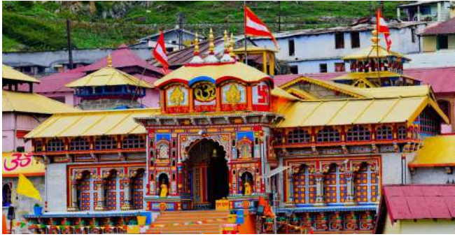
પહોંચી છે અને દોષિત ઠરેલા કોઈપણ વ્યક્તિ સામે કડક કાર્યવાહીની માંગ કરી છે. કોંગ્રેસ પાર્ટીએ શનિવારે બાગેશ્વરમાં બાગનાથ મંદિર સંકુલમાં મૌન વિરોધ પણ કર્યો હતો. પાર્ટીના કાર્યકરોએ રામ મંદિર અને બદ્રીનાથ ધામ બંનેમાં કથિત

ઉત્તરાખંડમાં પણ આ વિવાદે રાજકીય વળાંક લીધો છે. અયોધ્યામાં રામ મંદિરમાં પ્રસાદના સંચાલન સંબંધિત સમાન આરોપો લાગ્યા પછી તરત જ આ ઘટના સામે આવી છે, જેના કારણે વિરોધ પથો તરફથી ટીકા થઈ રહી છે. રાજ્ય કોંગ્રેસના પ્રમુખ ગણેશ ગોડિયાલે આરોપોને ગંભીર ગણાવ્યા છે અને મુખ્યમંત્રી પુષ્કર સિંહ ધામીના નેતૃત્વ હેઠળની રાજ્ય સરકાર પર બેદરકારીનો આરોપ લગાવ્યો છે. તેમણે કહ્યું કે આવા દાવાઓથી સનાતન ધર્મના અનુયાયીઓની ભાવનાઓને ઠેસ