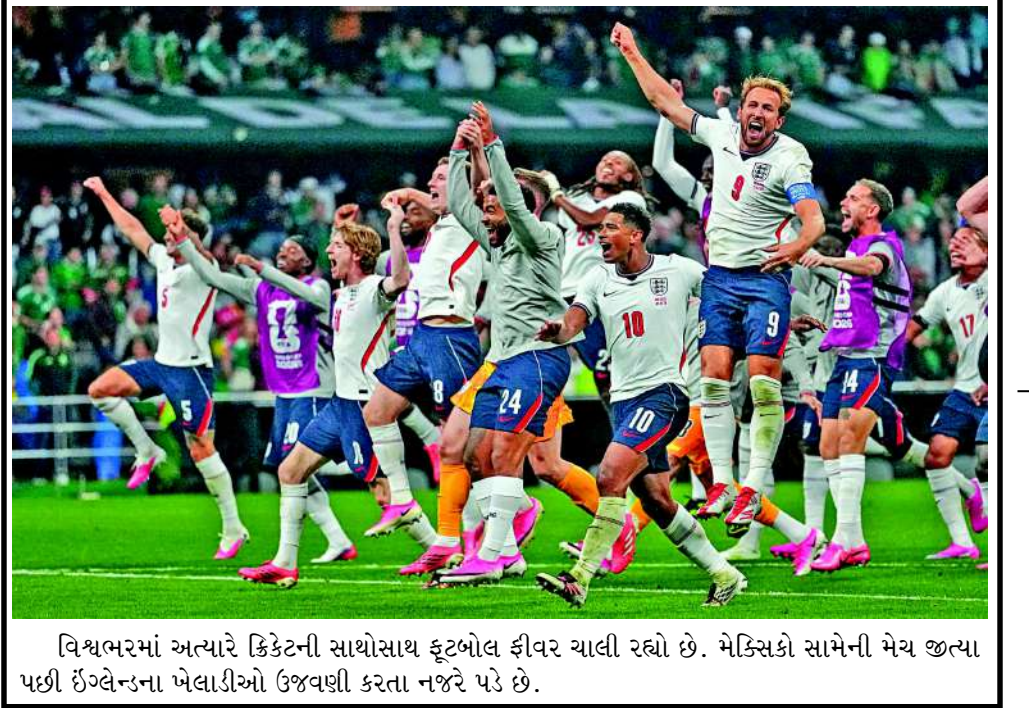
વિશ્વભરમાં અત્યારે ક્રિકેટની સાથેસાથ ફૂટબોલ ફીવર ચાલી રહ્યો છે. મેક્સિકો સામેની મેચ જત્યા પછી ઈંગ્લેન્ડના ખેલાડીઓ ઉજવણી કરતા નજરે પડે છે.

સારવાર ચાલી રહી છે. હોસ્પિટલ પ્રશાસને વધુમાં જણાવ્યું કે, ઘાયલોમાંથી ઘણા લોકોના શરીર પર ગોળીઓના નિશાન છે, જ્યારે કેટલાક અન્ય કેદીઓ ધારદાર હથિયારોના હુમલા, કપાવા અને ગંભીર ઈજાઓના કારણે પીડાઈ રહ્યા છે. હોસ્પિટલ તંત્ર ગંભીર રીતે ઘાયલ લોકોને બચાવવા માટે તમામ પ્રયાસો કરી રહ્યું છે. સ્થાનિક રહીશોના જણાવ્યા અનુસાર, સોમવારની સવારે પણ જેલની અંદરથી ગોળીબાર થવાના અવાજો સંભળાતા હતા. જેલની અંદર આ લોહિયાળ જંગના સમાચાર ફેલાતા જ જેલની સમગ્ર સુરક્ષા વ્યવસ્થા સંપૂર્ણપણે ખોરવાઈ ગઈ હતી.