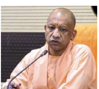
સ્થાનિક રહેવાસીઓ દ્વારા જલાલાબાદનું નામ બદલીને ભગવાન પરશુરામપુરી રાખવાની માંગણીને ધ્યાનમાં રાખીને, ૧૯ ઓગસ્ટ, ૨૦૨૫ ના રોજ જલાલાબાદ મ્યુનિસિપલ કોર્પોરેશન વિસ્તારની અંદર આવેલા જલાલાબાદ શહેર/શહેરનું નામ બદલીને પરશુરામપુરી કરવાના પ્રસ્તાવને કોઈ વાંધો ઉઠાવવામાં આવ્યો ન હતો.

સ્થળનું નામ ભગવાન પરશુરામના નામ પર રાખવાની માંગ કરી રહ્યા હતા, જેના પગલે સરકારે નામ બદલવાનો નિર્ણય લીધો છે. પરિણામે, શાહજહાંપુરમાં જલાલાબાદ હવે પરશુરામપુરી તરીકે ઓળખાશે. સરકારે જલાલાબાદનું નામ બદલવાની જાહેરાત કરતી એક પ્રેસ રિલીઝ બહાર પાડી. આ પ્રકાશન મુજબ, "શાહજહાંપુર જિલ્લામાં જલાલાબાદ મ્યુનિસિપલ કોર્પોરેશન વિસ્તારમાં આવેલું જલાલાબાદ શહેર ભગવાન પરશુરામના જન્મસ્થળ તરીકે પ્રખ્યાત છે. પૌરાણિક કથાઓ અને શાસ્ત્રોમાં તેનો ઉલ્લેખ મુખ્ય રીતે જોવા મળે છે. લોકપ્રતિનિધિઓ અને