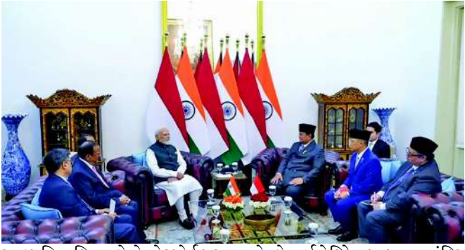
રાષ્ટ્રપતિ સુબિયાન્તોએ એરપોર્ટ પર તેમનું વ્યક્તિગત સ્વાગત કર્યું હતું. બંને નેતાઓ યોગ્યકાર્તામાં

પ્રધાનમંત્રી મોદી અને ઈન્ડોનેશિયાના રાષ્ટ્રપતિ વચ્ચે વ્યાપાર સહિતની બાબતો અંગે થઈ મંત્રણા : પીએમ મોદીનું ભવ્ય સ્વાગત કરાયું જકાર્તા ઈન્ડોનેશિયાની રાજધાની જકાર્તામાં પ્રધાનમંત્રી નરેન્દ્ર મોદીએ રાષ્ટ્રપતિ પ્રબોવો સુબિયાન્તો સાથે દ્વિપક્ષીય વાતચીત કરી. બંને નેતાઓએ ઉર્જા, વેપાર, સંરક્ષણ, દરિયાઈ સહયોગ, મહત્વપૂર્ણ ખનિજો, ખાદ્ય સુરક્ષા અને ડિજિટલ અર્થતંત્ર જેવા ક્ષેત્રોમાં વ્યાપક ભાગીદારીને નવી ગતિ આપવા અંગે ચર્ચા કરી. અગાઉ, પીએમ મોદીનું જકાર્તામાં ભવ્ય સ્વાગત કરવામાં આવ્યું હતું, અને