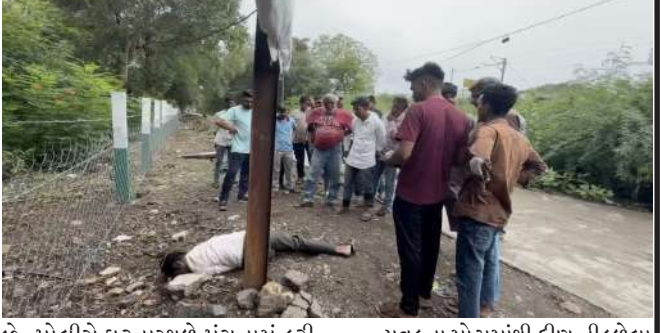
જેતપુર શહેરના નવાગઢ રેલવે સ્ટેશન રોડ પરથી અજાણ્યા યુવકનો મોઢામાંથી ફીણ નીકળેલા હોવાથી આ આકસ્મિક મૃત્યુ છે. આત્મહત્યા છે કે પછી અન્ય કોઈ બેદલ્ભર્યો બનાવ છે તે અંગે હાલ પંચકમાં તરેહ-તરેહની ચર્ચાઓ વહેતી થઈ છે. જોકે, જેતપુર સિટી પોલીસે જણાવ્યું છે કે યુવકના મોતનું ચોક્કસ અને સાચું કારણ પોસ્ટમોર્ટમ રિપોર્ટ આવ્યા બાદ જ સામે આવી શકશે. હાલમાં પોલીસે આ મામલે અકસ્મત મોતનો ગુનો નોંધીને સમગ્ર પ્રકરણની વધુ ઊંડી તપાસ હાથ ધરી છે.

જેતપુર: જેતપુર શહેરના નવાગઢ રેલવે સ્ટેશન રોડ પરથી અજાણ્યા વ્યક્તિનો સ્વસ્થમય સંજોગોમાં મૃતદેહ મળી આવતાં સમગ્ર પંચકમાં ચકચાર મચી ગઈ છે. પ્રાથમિક માહિતી અનુસાર, નવાગઢ રેલવે સ્ટેશન તરફ જવાના માર્ગ પર એક યુવકનો મૃતદેહ પડ્યો હોવાની જાણ સ્થાનિક લોકો દ્વારા પોલીસને કરવામાં આવી હતી. બનાવની ગંભીરતાને ધ્યાને લઈને જેતપુર સિટી પોલીસનો કાફલો તાબડતોબ ઘટનાસ્થળે દોડી ગયો હતો. પોલીસે સ્થળ પર પહોંચીને તપાસ કરતાં મોટકા મોઢામાંથી ફીણ નીકળેલા જોવા મળ્યા હતા, જેને પગલે મોત પાછળ કોઈ જેરી દવા અથવા અન્ય કોઈ કારણ જવાબદાર હોવાની આશંકા સેવાઈ રહી છે. પોલીસના જણાવ્યા અનુસાર, મૃત્યુ પામનાર કોઈ પ્રોથેક એન્ડ વધારી વ્યક્તિ નથી, પરંતુ એક અજાણ્ય યુવક હોવાથી આ આકસ્મિક મૃત્યુ છે. આત્મહત્યા છે કે પછી અન્ય કોઈ બેદલ્ભર્યો બનાવ છે તે અંગે હાલ પંચકમાં તરેહ-તરેહની ચર્ચાઓ વહેતી થઈ છે. જોકે, જેતપુર સિટી પોલીસે જણાવ્યું છે કે યુવકના મોતનું ચોક્કસ અને સાચું કારણ પોસ્ટમોર્ટમ રિપોર્ટ આવ્યા બાદ જ સામે આવી શકશે. હાલમાં પોલીસે આ મામલે અકસ્મત મોતનો ગુનો નોંધીને સમગ્ર પ્રકરણની વધુ ઊંડી તપાસ હાથ ધરી છે.