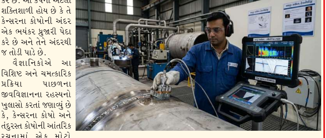
પીડારહિત અને લક્ષિત (ટાર્ગેટેડ) સારવાર પૂરી પાડે છે. જો આ પદ્ધતિ આગામી સમયમાં માનવ પરીક્ષણો (ક્લિનિકલ ટ્રાયલ્સ) સફળતાપૂર્વક પાસ કરી લેશે, તો ભવિષ્યમાં કેન્સરની સારવાર ખૂબ જ સરળ, સસ્તી અને કોઈપણ આડઅસર વિનાની બની જશે. અલ્ટ્રાસાઉન્ડ મશીનો પહેલેથી જ નાની-મોટી હોસ્પિટલોમાં ઉપલબ્ધ હોવાથી, આ ટેકનોલોજી સામાન્ય અને ગરીબ દર્દીઓ સુધી પણ સહેલાઈથી પહોંચાડી શકાશે. આમ, ભારતીય વૈજ્ઞાનિકોની આ અભૂતપૂર્વ સિદ્ધિ કેન્સર મુક્ત ભવિષ્ય તરફ એક મજબૂત અને નિષ્ણાયક કદમ સાબિત થશે. ઉપરોક્ત તંત્રીલેખ પ્રસિદ્ધ થયેલા મેડિકલ રિસર્ચ અને આધાર તૈયાર કરવામાં આવ્યો છે.

મજબૂત કવચ પ્રદાન કરે છે, જેથી અલ્ટ્રાસાઉન્ડના કંપનો સામે તેઓ પોતાના અસ્તિત્વને ટકાવી રાખે છે અને તેમને કોઈ આડઅસર થતી નથી. ભવિષ્યની દ્રષ્ટિએ આ નૂતન સંશોધન તબીબી જગતમાં એક ક્રાંતિકારી વળાંક સાબિત થઈ શકે તેમ છે. કીમોથેરાપીની સરખામણીમાં આ પદ્ધતિ તદ્દન