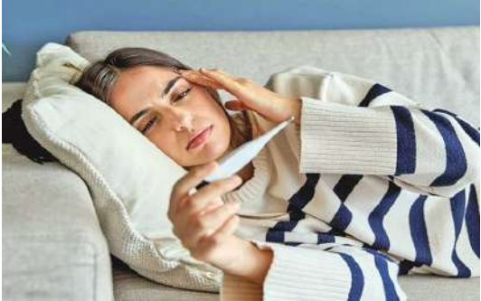
૮. નસકોરી ફૂટવી :- નસકોરી ફૂટે તો તાત્કાલિક ભીની માટી મુકવી. ફૂલવ્યા વિનાની ફટકડીનાં પાણીનાં ટીપાં નાકમાં નાખવા. અહીં તોલા પાણીમાં ૧/૧૬ તોલો ફટકડીનું પ્રમાણ રાખવું. ૯. ક્ષય :- ક્ષય રોગમાં પોષણ પૂરું પાડનારા બંધ થયેલા સ્રોતોને ખુલ્લા કરવા માટે દ્રાક્ષાસવ પછી અડધા કલાકે કલાકે બકરીનું દૂધ, બકરીનાં દૂધનું ઘી, ગળ્યા પદાર્થો, દાળ-ભાત, ભિચડી, શાક, થોડી રોટલી વગેરે ખોરાકમાં આપવા. દવામાં અરડુસીનાં પાંદડાનો તે તોલા રસ રોજ બે વાર આપવો. વધારે ઉધરસ હોય તો રસ રોજ ત્રણ વાર આપવો. અરડુસીથી દસ્ત પણ સાફ ઉતરે છે. ૧૦. અરુચિ :- અરુચિ રોગમાં દર્દીને ખાવાની ઇચ્છા જ મારી જાય છે. આવી અરુચિમાં રોજ હીમજ આપવી. રુચિ ઉત્પન્ન કરવા દવા તરીકે રોજ દિવસમાં ત્રણ વાર દરેક વખતે આદુ ઉપર થોડું સિંધાલૂણ ભભરાવી ચાવડાવવું.

ત્યારબાદ પહેલા કાળી દ્રાક્ષ અને સાકર સાથે સુંઠ, મરી અને પીપરનું ચૂર્ણ પાચન-ઓષધ તરીકે આપવું પણ સાથે ઉપવાસ કરાવવા. ઉપવાસ છૂટ્યા પછી હલકો ખોરાક ભૂખ પ્રમાણે આપવો અને હીમજ રોજ આપવી. ૫. કૃમિરોગ :- કૃમિરોગ માટે એક સચોટ ઉપાય બતાવું છું જેમાં કૃમિ જીવતા બહાર નીકળશે. મોટા બાળકોમાં ચણા જેટલો અને નાના બાળકોમાં અડધા ચણા જેટલો પુરસાની અજમો દિવસમાં બે-બે વાર આપવાથી જીવતા કૃમિ મળ વાટે શરીરમાંથી બહાર નીકળી જાય છે. ૬. પાંડુરોગ :- દરરોજ ૧ તોલો હીમજ આપવાથી રોજ અડધો શેર ગોમૂત્ર આપવાથી અને મધમાં ૧ તોલો ત્રિફળા દિવસમાં બે વાર આપવાથી પાંડુ મટે છે. ૭. કમળો (કામલા) :- આ રોગમાં દર્દીને પુષ્કળ હીમજ આપવી, પુષ્કળ ગોમૂત્ર આપવું તથા દૂધ, ભાત, કાળી વસ્તુઓ અને પિત્તશામક શેરડી વગેરે ઠંડી વસ્તુઓ આપવી. દૂધમાં ૫-૬ પીપર ઉકાળી દિવસમાં બે વાર દૂધ પીવું. પાશેર દૂધમાં પીપર નાખીને પાશેર પાણી નાખીને ઉકાળવું. પછી પાણી બળી જાય અને પાશેર દૂધ બાકી રહે એટલે ઉતારી લેવું અને હુંડુ પડયા પછી પીપર ચાવી અને ઉપર એ જ દૂધ પી જવું.