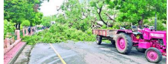
પ્લોટની કમ્પાઉન્ડ વોલ પણ આ ભાગમાં ભાંગી ગઈ હતી. આઈસીઆઈસીઆઈ બેંકવાળો પુરો રસ્તો આ ઝાડ આડું પડતા સવારથી મોડી સાંજ સુધી બંધ થઈ ગયો હતો. આ અંગેની જાણ થતા ગાર્ડન અધિકારી ઝાકાસણીયા તપાસમાં પહોંચ્યા હતા. તેમણે જણાવ્યું હતું કે, આ ઝાડના મુળ નબળા પડી ગયાનું અને પુષ્પ ઉડા ન હોવાથી મેદાનમાં માટી વચ્ચે ફેલાયાનું દેખાયું હતું. પાયામાંથી મુળ નબળા પડીને ઉખરડી જતા ઝાડ ધરાશાયી થયાનું પ્રાથમિક તપાસમાં