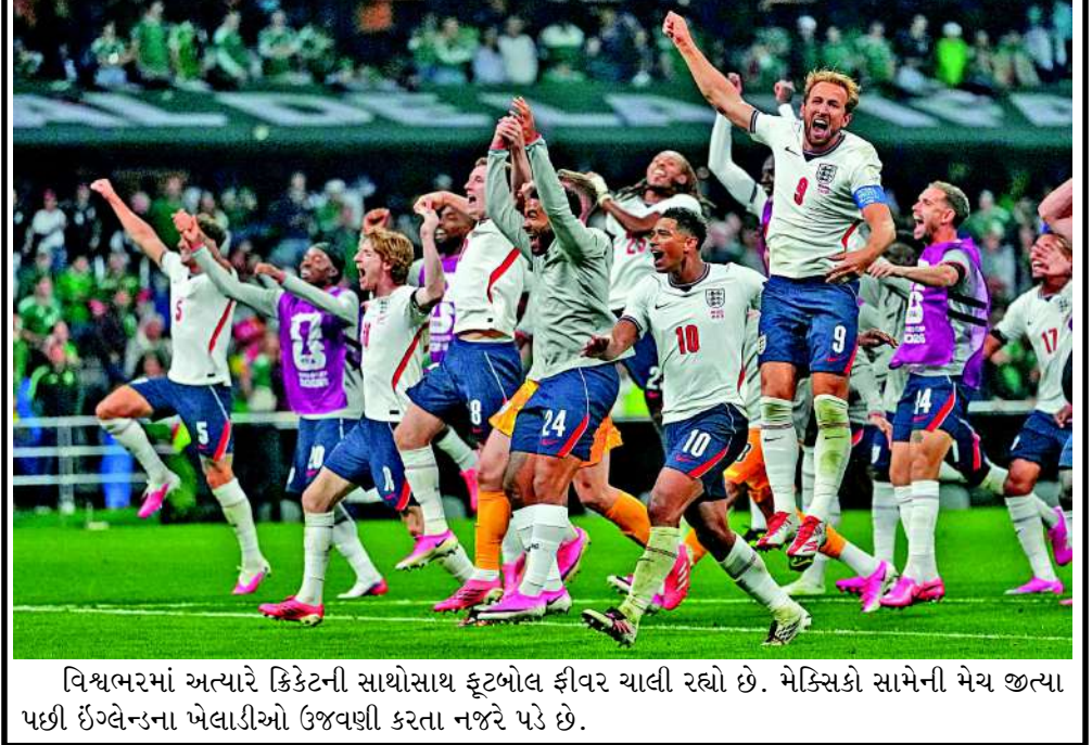
વિશ્વભરમાં અત્યારે ક્રિકેટની સાથોસાથ ફૂટબોલ ફીવર ચાલી રહ્યો છે. મેક્સિકો સામેની મેચ જીત્યા પછી ઈંગ્લેન્ડના ખેલાડીઓ ઉજવણી કરતા નજરે પડે છે.

નાણાકીય વર્ષ ૨૦૨૩ માં ૩૮.૮ બિલિયન યુએસ ડોલરથી ઘટીને નાણાકીય વર્ષ ૨૦૨૬ માં ૨૪.૮ બિલિયન થવાનો અંદાજ છે. ઈન્ડોનેશિયામાં ભારતના રાજદૂત સંદીપ ચક્રવર્તીએ જણાવ્યું હતું કે ભારત અને ઈન્ડોનેશિયા ઐતિહાસિક રીતે મૈત્રીપૂર્ણ સંબંધો ધરાવે છે, અને પીએમ મોદીની મુલાકાત સહકારના નવા અધ્યાયો ખોલશે, પછી ભલે તે ઉત્પાદન, વિજ્ઞાન અને ટેકનોલોજી, અવકાશ, પરમાણુ અથવા શૈક્ષણિક આદાનપ્રદાનમાં હોય. જ્યારે છેલ્લા ત્રણ નાણાકીય વર્ષોમાં દ્વિપક્ષીય વેપારમાં ઘટાડો થયો છે. એક અહેવાલ મુજબ, બંને દેશો વચ્ચેનો દ્વિપક્ષીય વેપાર ઉચ્ચપાયાલમાં છે, ત્યારે ભારત અને ઈન્ડોનેશિયા સાથે મળીને કામ કરવાથી વિશ્વને એક મજબૂત સંદેશ મળે છે. જકાર્તા પહોંચ્યા પછી, રાષ્ટ્રપતિ સુબિયાન્ટો એરપોર્ટ પર પીએમ મોદીનું સ્વાગત કરવા માટે તેમના ચાર મંત્રીઓ સાથે હતા. ઈન્ડોનેશિયન કલાકારોએ તેમના પરંપરાગત નૃત્ય પ્રદર્શનથી બધાને મંત્રમુગ્ધ કરી દીધા. એરપોર્ટ પર પીએમ મોદીને ગાર્ડ ઓફ ઓનર આપવામાં આવ્યું. હોટેલમાં પહોંચ્યા પછી, ભારતીય ડાયસ્પોરા દ્વારા તેમનું સ્વાગત કરવામાં આવ્યું. આ પ્રસંગે પરંપરાગત નૃત્ય અને સાંસ્કૃતિક પ્રદર્શન પણ રજૂ કરવામાં આવ્યા હતા.