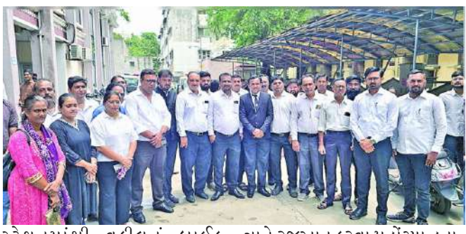
સ્ટેશનમાંથી વકીલનું બાઈક ડિટેઈન થયું હતું. જેમાં કોર્ટે મુદ્દામાલ છોડવા હુકમ કર્યો હતો. એડવોકેટ કણોતરના જણાવ્યા મુજબ તેઓ તેમના પત્ની સાથે ગાર્ડનમાં બેઠા હતા ત્યારે પોલીસ સ્ટાફ આવ્યો હતો અને ત્યાં બેઠેલા બીજા અન્ય યુવક યુવતીઓને જળવાતો ન હોય તેના કારણે બનતા હોવાનું જણાય છે.

જેથી મારી સાથે જેમ તેમ બોલવા લાગ્યા હતા. આ પછી યુવક યુવતીઓને પોલીસ સ્ટાફ પરેશાન કરતો હોય તેવા વીડિયો બનાવીને મેં સોશિયલ મીડિયા ઉપર મુક્યા હતા. દરમિયાન બે અજાણ્યા વ્યક્તિ આવ્યા હતા. પોતે પોલીસ હોવાનું જણાવતા હતા. દારૂ વેચ્યો છો તેમ કહી ઘરમાં ઘુસ્યા હતા. મેં વકીલ તરીકે મારી ઓળખ આપી વોરંટ માંગ્યું હતું. જોકે તેઓએ કોઈ વોરંટ આપ્યું નહોતું. અપશબ્દો બોલતા હતા. ઘરના કબાટમાંથી ૭૬૦૦૦ કાઢી લીધા હતા. મને પકડીને પોલીસ મથકે લઈ જઈ પટ્ટા વડે બેંકામ માર માર્યો હતો. મને દારૂ પીવડાવ્યો હતો અને મારા ઉપર દારૂનો ખોટો કેસ કર્યો હતો. આ અંગે બાર એસો. દ્વારા પગલાં લેવા રજુઆત થઈ છે.