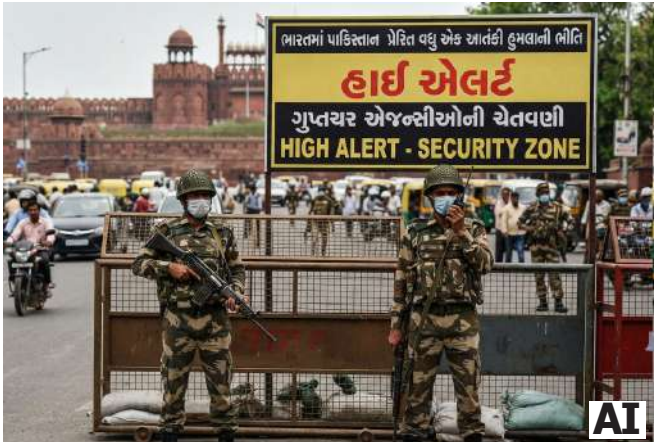
બુરહાન વાનીના નામે ખીણમાં વાતાવરણને ખલેલ પહોંચાડવાના પશ્ચંત્ર અંગે ગુપ્ત માહિતી ઇનપુટ કેન્દ્ર સરકાર સાથે શેર કરવામાં આવી છે. કાશ્મીરમાં સુરક્ષા એજન્સીઓને પણ આ અંગે જાણ કરવામાં આવી છે. આને ધ્યાનમાં રાખીને, સમગ્ર કાશ્મીર ખીણમાં સુરક્ષા વ્યવસ્થા કડક છે. સુરક્ષા એજન્સીના અધિકારીઓ કંઈક છે કે પાકિસ્તાન તરફથી કોઈપણ પ્રકારની નાપાક પ્રવૃત્તિઓને મંજૂરી આપવામાં આવશે નહીં. સુરક્ષા દળો અને ગુપ્ત માહિતી એજન્સીઓ સમગ્ર ખીણમાં સતર્ક રહે છે.

નવીદિલ્હી, હિંદુબુલ મુજાહિદીના ભૂતપૂર્વ આતંકવાદી બુરહાન વાનીની ૧૦મી પુણ્યતિથિ પર કરાચીમાં ટોચના આતંકવાદી નેતાઓની ગુપ્ત બેઠક યોજાઈ હતી. આ બેઠક ૫ જુલાઈના રોજ લશ્કર-એ-તૈયબાની રાજકીય પાંખ પાકિસ્તાન મરકઝી મુસ્લિમ લીગના મુખ્યાલયમાં થઈ હતી. આ બેઠકમાં જૈશ-એ-મોહમ્મદ અને હિંદુબુલ મુજાહિદી જેવા આતંકવાદી જૂથો સાથે જોડાયેલા ૧૪ અગ્રણી આતંકવાદીઓ, તેમજ આઈએસઆઈ સાથે જોડાયેલા લોકો હાજર રહ્યા હતા. બુરહાન વાનીની મૃત્યુદંડ પર ભારત વિરોધી હુમલો કરવાનો કાવતરું ઘડવામાં આવ્યું હતું. આ બેઠકમાં કાશ્મીર ખીણના ભાગોમાં મોટા હુમલા કરવા માટે યુવાનોને શસ્ત્રો પૂરા પાડવાનું જૂઠ્ઠાને કામ સોંપવામાં આવ્યું હતું. ગુપ્તચર સૂત્રો અનુસાર, ૫ જુલાઈના રોજ બપોરે ૧૨ વાગ્યે, લશ્કર-એ-તૈયબાના આતંકવાદીઓ, ઓલ પાર્ટી ઇસ્લિમ કોન્ફરન્સના કન્વીનર ગુલામ મોહમ્મદ સૈફી અને પાકિસ્તાન મરકઝી મુસ્લિમ લીગના ઉપપ્રમુખ મહેંદી ઈશાકની આગેવાની હેઠળ મળ્યા હતા. પાર્ટી મુખ્યાલયમાં લગભગ બે કલાક ચાલેલી બેઠકમાં, લશ્કર-એ-તૈયબાના આતંકવાદીઓ મોહમ્મદ તલહા સઈદ, સૈફુલ્લાહ કસુરી અને હાફિઝ અબ્દુલ રહીમ સહિત ૧૪ વ્યક્તિઓએ