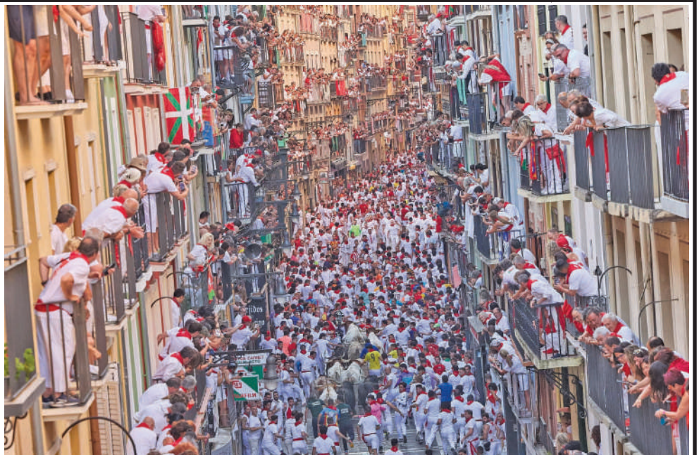
સ્પેનમાં લોકો સાન ફર્મિન ઉત્સવના પરંપરાગત એન્સીરો (બળદ દોડ) માં ભાગ લે છે. શહેરના આશ્રયદાતા સંતની યાદમાં દર વર્ષે ૬ થી ૧૪ જુલાઈ દરમિયાન બળદ દોડવાનો તહેવાર યોજાય છે. વિશ્વભરના મુલાકાતીઓ આ ઉત્સવમાં હાજરી આપે છે, અને ઘણા લોકો આ હાઈલાઈટ ઈવેન્ટમાં ભાગ લે છે, જેમાં તેઓ જૂના શહેરની સાંકડી શેરીઓમાંથી પસાર થતા માર્ગ પર બળદોને પાછળ છોડી દેવાનો પ્રયાસ કરે છે.

જણાવ્યું છે. નાગરિકોને માત્ર સત્તાવાર સરકારી માધ્યમો અને ન્યૂઝ ચેનલો દ્વારા જ આવી રહેલી માહિતી પર ભરોસો કરવા અને સુરક્ષા નિર્દેશોનું પાલન કરવામાં આવી છે. બીજી તરફ, આ યુદ્ધની અસર અન્ય ખાડી દેશો પર પણ જોવા મળી રહી છે. ઈરાને કુવૈતને નિશાન બનાવીને મોટો ગ્રેન અને મિસાઈલ હુમલો કર્યો છે, જેની પુષ્ટિ કુવૈતની સેના દ્વારા કરવામાં આવી છે. કુવૈતના સૈન્ય જનરલ સ્ટાફે જણાવ્યું કે દેશની એર ડિફેન્સ સિસ્ટમ અત્યારે સક્રિય છે અને દુશ્મન દેશ તરફથી આવી રહેલી મિસાઈલો તથા ગ્રેનને હવામાં જ તોડી પાડી રહી છે. સેનાએ લોકોને આકાશમાં થતા ઘડાકાઓથી ન ગભરાવા અને તુરંત જ સુરક્ષિત સ્થળોએ આશરો લેવા વિનંતી કરી છે.