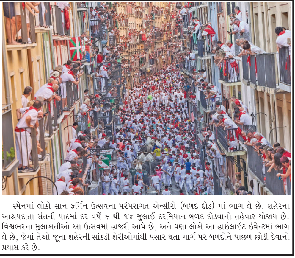
સ્પેનમાં લોકો સાન ફર્મિન ઉત્સવના પરંપરાગત એન્સીરો (બળદ દોડ) માં ભાગ લે છે. શહેરના આશ્રયદાતા સંતની યાદમાં દર વર્ષે ૬ થી ૧૪ જુલાઈ દરમિયાન બળદ દોડવાનો તહેવાર યોજાય છે. વિશ્વભરના મુલાકાતીઓ આ ઉત્સવમાં હાજરી આપે છે, અને ઘણા લોકો આ હાઈલાઈટ ઈવેન્ટમાં ભાગ લે છે, જેમાં તેઓ જૂના શહેરની સાંકડી શેરીઓમાંથી પસાર થતા માર્ગ પર બળદોને પાછળ છોડી દેવાનો પ્રયાસ કરે છે.

જણાવ્યું છે. નાગરિકોને માત્ર સત્તાવાર સરકારી માધ્યમો અને ન્યૂઝ ચેનલો દ્વારા જ આવી રહેલી માહિતી પર ભરોસો કરવા અને સુરક્ષા નિર્દેશોનું પાલન કરવા તાકીદ કરવામાં આવી છે. બીજી તરફ, આ યુદ્ધની અસર અન્ય ખાડી દેશો પર પણ જોવા મળી રહી છે. ઈરાને કુવૈતને નિશાન બનાવીને મોટો ગ્રેન અને મિસાઈલ હુમલો કર્યો છે, જેની પુષ્ટિ કુવૈતની સેના દ્વારા કરવામાં આવી છે. કુવૈતના સૈન્ય જનરલ સ્ટાફે જણાવ્યું કે દેશની એર ડિફેન્સ સિસ્ટમ અત્યારે સક્રિય છે અને દુશ્મન દેશ તરફથી આવી રહેલી મિસાઈલો તથા ગ્રેનને હવામાં જ તોડી પાડી રહી છે. સેનાએ લોકોને આકાશમાં થતા ઘડાકાઓથી ન ગભરાવા અને તુરંત જ સુરક્ષિત સ્થળોએ આશરો લેવા વિનંતી કરી છે.