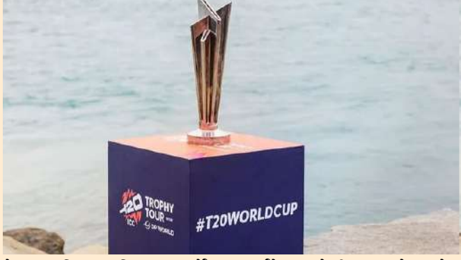
મેળવ્યું. દક્ષિણ આફ્રિકા, આયર્લેન્ડ અને પાકિસ્તાનના ખેલાડીઓને પણ આ એક્સઆઈમાં સ્થાન મળ્યું. મહિલા ટી ૨૦ વર્લ્ડ કપ ૨૦૨૬ માટે આઈસીસી ટીમ ઓફ ધ ટુર્નામેન્ટમાં ડેની વ્યાટ-હોજ, બેથ મુની, તાજમિન બિટ્સ, નેટ સાયવર-બ્રટ, ઓલ્ડા પ્રેન્ડરગાસ્ટ, મેરિઝાન કેપ, એલિસ પેરી, સોફી મોલિનેક્સ (કેપ્ટન), સોફી

નવીદિલ્હી, આઈસીસી મહિલા ટી ૨૦ વર્લ્ડ કપ ૨૦૨૬ ના સમાપન પછી, આઈસીસીએ ટુર્નામેન્ટની શ્રેષ્ઠ પ્લેઈંગ ઈલેવનની જાહેરાત કરી છે. આ ટીમમાં એવી ખેલાડીઓનો સમાવેશ થાય છે જેમણે સમગ્ર ટુર્નામેન્ટ દરમિયાન પોતાના પ્રદર્શનથી સૌથી વધુ પ્રભાવ પાડ્યો હતો. ચેમ્પિયન ઓસ્ટ્રેલિયા અને રનર્સ-અપ ઈંગ્લેન્ડની ખેલાડીઓએ આ ટીમ પર પ્રભુત્વ મેળવ્યું હતું. દરમિયાન, ભારતની યુવા સ્પિનરે પણ તેના ઉત્કૃષ્ટ પ્રદર્શનને કારણે આ પ્રતિષ્ઠિત ટીમમાં સ્થાન