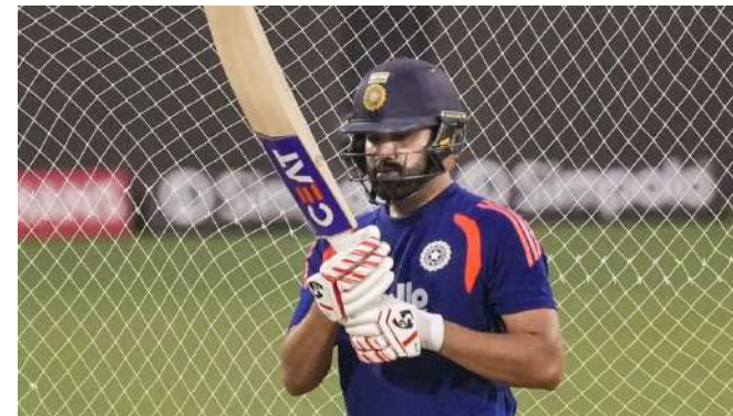
રોહિત શર્મા તાજેતરમાં નેટ્સમાં બેટિંગ કરતો જોવા મળ્યો હતો. તેણે ત્યાં ખૂબ જ પ્રેક્ટિસ કરી અને કેટલાક મોટા શોટ પણ માર્યા. ઈંગ્લેન્ડ પ્રવાસ પહેલાં રોહિતનો આ વીડિયો સોશિયલ મીડિયા પર વાયરલ થઈ રહ્યો છે. વીડિયોમાં, તે સ્ટ્રેટ ડ્રાઈવ અને કવર ડ્રાઈવ જેવા ઉત્તમ શોટ રમતા જોવા મળી રહ્યો છે. ચાહકોને આશા છે કે રોહિત ઈંગ્લેન્ડ સામેની મેચોમાં મોટી અને સારી ઈનિંગ્સ રમશે. અફઘાનિસ્તાન સામેની પાછલી વનડે શ્રેણીમાં તેનું પ્રદર્શન ખાસ

નવીદિલ્હી, ભારતીય ટીમ હાલમાં ઈંગ્લેન્ડના પ્રવાસે છે. બંને ટીમો વચ્ચે હાલમાં પાંચ મેચની ટી ૨૦ શ્રેણી ચાલી રહી છે. આ પછી, બંને ટીમો ત્રણ મેચની વનડે શ્રેણીમાં એકબીજાનો સામનો કરશે. આ શ્રેણીની પહેલી મેચ ૧૪ જુલાઈએ રમાશે. બીસીસીઆઈએ ઘણા દિવસો પહેલાં આ વનડે શ્રેણી માટે ટીમોની જાહેરાત કરી હતી. રોહિત અને વિરાટ આ શ્રેણી માટે ટીમ ઈન્ડિયાનો ભાગ છે. આ દરમિયાન, ટીમ ઈન્ડિયાના અનુભવી બેટ્સમેન રોહિત શર્માએ વનડે શ્રેણી માટે તૈયારીઓ શરૂ કરી દીધી છે.