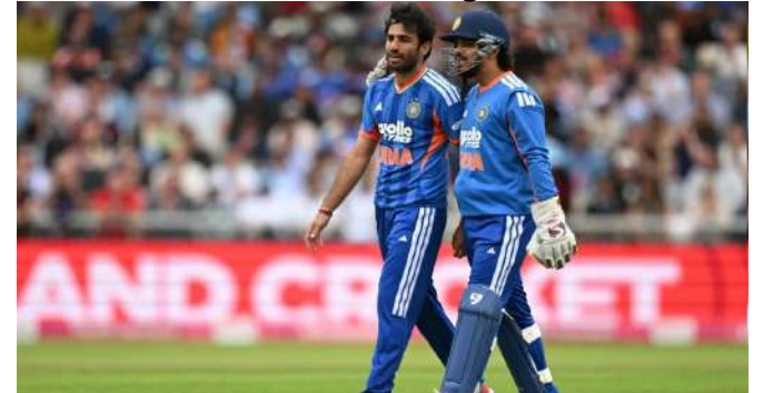
તેના અભિગમ અને બોલિંગ પહેલાં તેની શરીરની સ્થિતિ સાથે સંબંધિત છે. તેમણે કહ્યું કે તેમનું માનવું છે કે બેક-ફૂટ નો-બોલ તેના રન-અપ અને ભારને કારણે થાય છે. રવિ બિશ્રોઈનો રન-અપ વર્ષોથી બદલાતો રહ્યો છે. આઈપીએલ દરમિયાન પણ, તેનો રન-અપ અર્ધ-વર્તુળ જેવો દેખાતો હતો. આ રીતે તેની બોલિંગ પોઝિશન પર દોરે છે. કાર્તિકના મતે, રવિ બિશ્રોઈ પરંપરાગત લેગ સ્પિનર નથી, પરંતુ મુખ્યત્વે ગુગલી બોલર છે. આ જ કારણ છે કે તેની બોલિંગ એક્શન થોડી અલગ દેખાય છે. તેમણે સમજાવ્યું કે લેગ સ્પિનર તરીકે, બોલ છોડતી વખતે તમારો હાથ તમારા કાનથી થોડો દૂર હોવો જોઈએ જેથી તેને વધુ સ્પિન મળે.

નવીદિલ્હી, ઈંગ્લેન્ડ સામેની બીજી ટી ૨૦માં રવિ બિશ્રોઈના વારંવાર બેક-ફૂટ નો-બોલથી ભારતને નોંધપાત્ર નુકસાન થયું. ભૂતપૂર્વ ભારતીય સ્પિનર મુરલી કાર્તિકે હવે એક જ ઓવરમાં ૨૯ રન આપીને બિશ્રોઈની સમસ્યાનું ટેકનિકલ વિશ્લેષણ પૂરું પાડ્યું છે. કાર્તિક માને છે કે સમસ્યા બિશ્રોઈની બોલિંગ એક્શનમાં નથી, પરંતુ તેના બદલાયેલા રન-અપમાં છે. તેમણે કહ્યું કે જો બિશ્રોઈ તેના જૂના, ટૂંકા સી-આકારના રન-અપમાં પાછો ફરે છે, તો તે તેની બોલિંગ એક્શન બદલવા વિના આ સમસ્યાને દૂર કરી શકે છે. ભૂતપૂર્વ ભારતીય ડાબોડી સ્પિનર મુરલી કાર્તિકે પીટીઆઈને જણાવ્યું હતું કે રવિ બિશ્રોઈના બેક-ફૂટ નો-બોલની સમસ્યા કીડા પરના