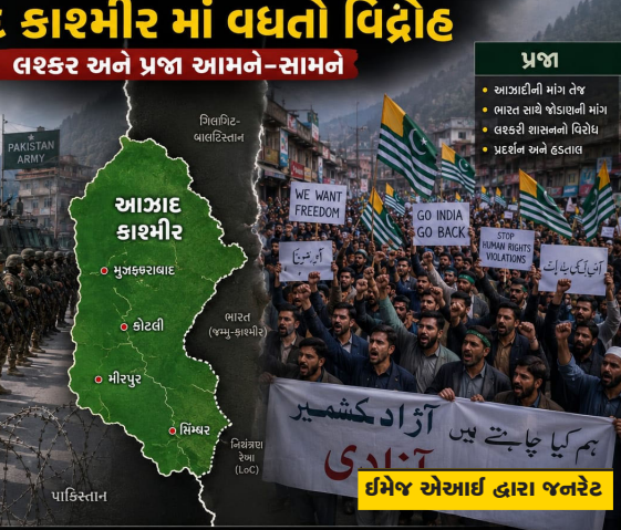
આઝાદ કાશ્મીર માં પ્રજાનો વિદ્રોહ દિવસે ને દિવસે ઉગી રહી છે. લશ્કરે દમન સામે હવે જતના એકવર ઘરો પોતાના દેશ અને આઝાદીની લડાઈ લડી રહી છે.

પીઓકેની હાલની અશાંતિ પાકિસ્તાન માટે માત્ર આંતરિક પડકાર નથી, પરંતુ તે તેના શાસન મોડેલ અંગે પણ પ્રશ્નો ઊભા કરે છે. જો લોકોની મૂળભૂત સમસ્યાઓનું સમયસર નિરાકરણ નહીં આવે તો અસંતોષ વધુ ઊંડો બની શકે છે. વિકાસ, રોજગારી, પારદર્શક વહીવટ અને લોકશાહી અધિકારો વિના લાંબા ગાળે શાંતિ જાળવવી મુશ્કેલ બની શકે છે. આ સમગ્ર ઘટનાક્રમ માંથી એક મહત્વનો પાઠ મળે છે કે કોઈપણ પ્રદેશમાં સ્થિરતા માત્ર સુરક્ષા દળોના બળથી જ નહીં, પરંતુ લોકોના વિશ્વાસ, વિકાસ અને ન્યાયપૂર્ણ શાસનથી જ આવે છે. જ્યારે સામાન્ય નાગરિકોની સમસ્યાઓ લાંબા સમય સુધી અવગણાય છે ત્યારે અસંતોષ ધીમે ધીમે મોટા આંદોલનનું સ્વરૂપ ધારણ કરી શકે છે.