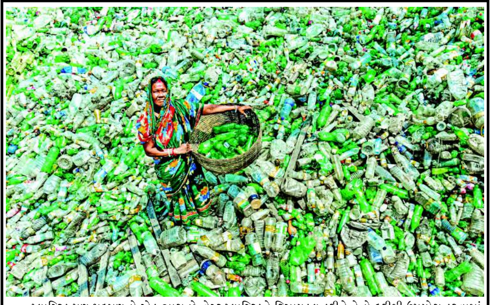
પ્લાસ્ટિક પણ પ્રદૂષણનો એક ભાગ છે, વેસ્ટ પ્લાસ્ટિકને રિસાયકલ કરીને તેનો ફરીથી ઉપયોગ કરવામાં આવે છે, જેથી પર્યાવરણનું સંતુલન જળવાઈ રહે. એક મહિલા રિસાયકલિંગ સેન્ટરમાં ફેંકી દેવાયેલી પ્લાસ્ટિક બોટલોને અલગ તારવી રહી છે.

દુર આવેલા છે. પરંતુ અંતિમ યાત્રા દરમિયાન હુમલો થયો છે તો આ મામલો વધારે ઉગ્ર બની શકે છે. અત્યારે ઈરાન અને અમેરિકા યુદ્ધની ચરમસીમાએ પહોંચી ગયાં છે. થોડી વખત પહેલી યુદ્ધ વિરામ માટે સમજૂતી કરાર થયો હતો, પરંતુ આ હુમલો પછી શાંતિ રહે તેવું લાગતું નથી. હવે ઈરાન પણ આનો જવાબ આપશે તેવું નિષ્ણાતો માની રહ્યાં છે. અમેરિકન સેનાના કલાં પ્રમાણે, આ હુમલાનો ઉદ્દેશ હોર્નુઝ સ્ટ્રેનમાંથી પસાર થયા જહાજોને સુરક્ષિત કરવાનો અને ઈરાને કમજોર કરવાનો છે. એટલું જ નહીં પરંતુ અમેરિકન રાષ્ટ્રપતિની છેલ્લા નિવેદન પછી હવે યુદ્ધની આશંકા વધારે પ્રબળ બની રહી છે. અમેરિકન ઉપરાષ્ટ્રપતિએ કહ્યું કે, 'ઈરાન માત્ર એક અઠવાડિયા સુધી જ સાડું રહે છે, જો અમારા જહાજો પર હુમલો કરશે તો અમે તેને તબાહ કરી નાખીશું'. આ યુદ્ધ માટે અમેરિકાની ઈરાનને ચોખ્ખી ધમકી છે. ચોંકાવનારી વાત એ પણ છે કે, ઈરાને અમેરિકાના આરોપને ખોટા કલાં છે. યુદ્ધ વિરામનો ભંગ અમેરિકા દ્વારા જ કરવામાં આવ્યો હોવાનો ઈરાને આરોપ પણ લગાવ્યો છે. મોહમ્મદ બાધેર ગાલિબાઈએ એક્સ પર પોસ્ટ કરતા લખ્યું કે, 'ટ્રમ્પનું પ્રશાસન શરૂઆતથી જ આ શરતોનો ભંગ કરતું આવ્યું છે. જેથી અમારે મજબૂરીમાં જવાબો આપવા પડ્યાં છે. અમેરિકા દબાણ કરવાનો પ્રયત્ન કરી રહ્યું છે કે, પરંતુ તેના થઈ તેને કોઈ પ્રાપ્ત થવાનું નથી, અમે (ઈરાન) હાર માનવાના નથી.'